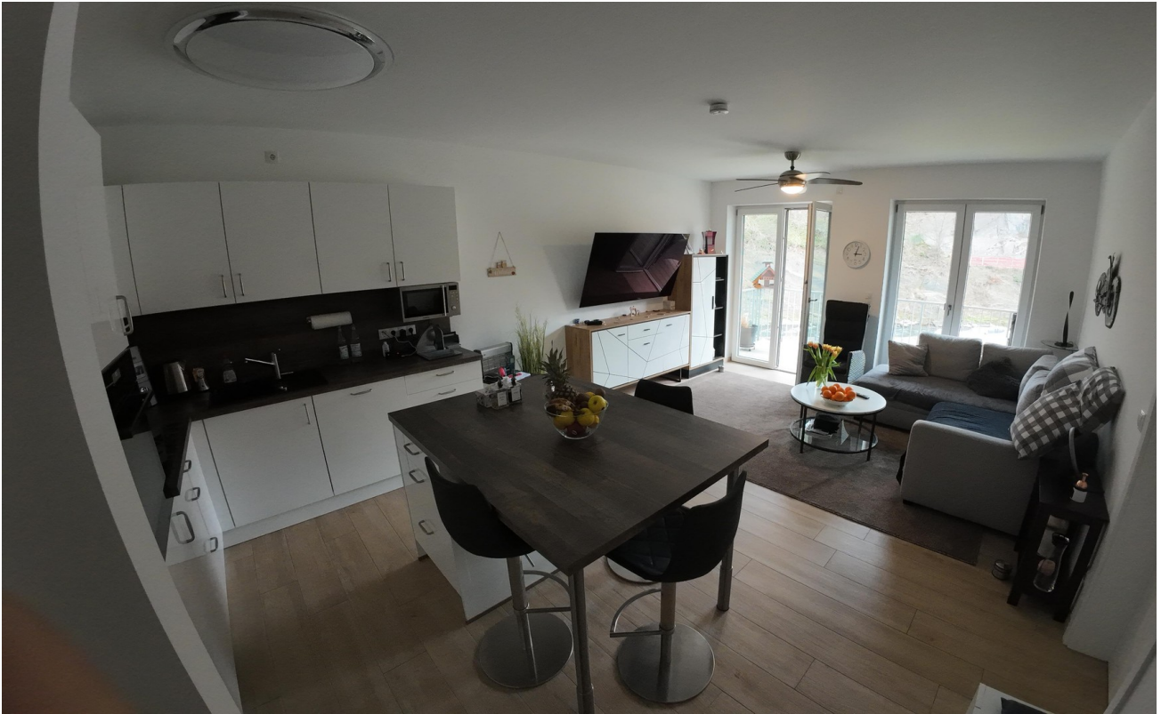
Küche / Wohnzimmer