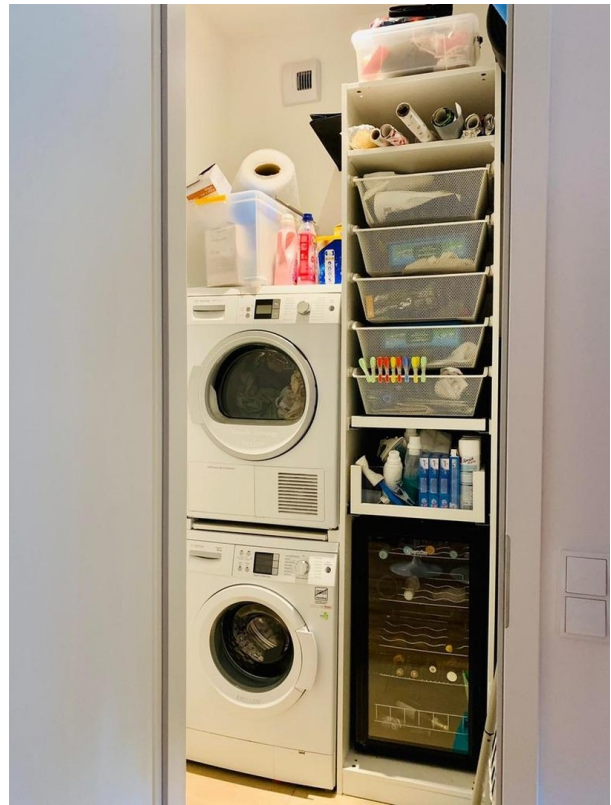
Abstellraum mit WM + Trockner