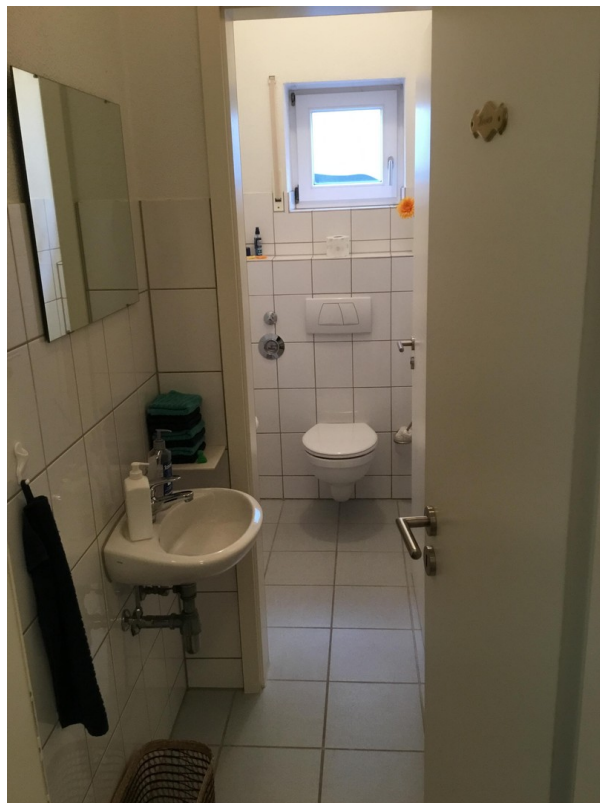
WC Herren Büro