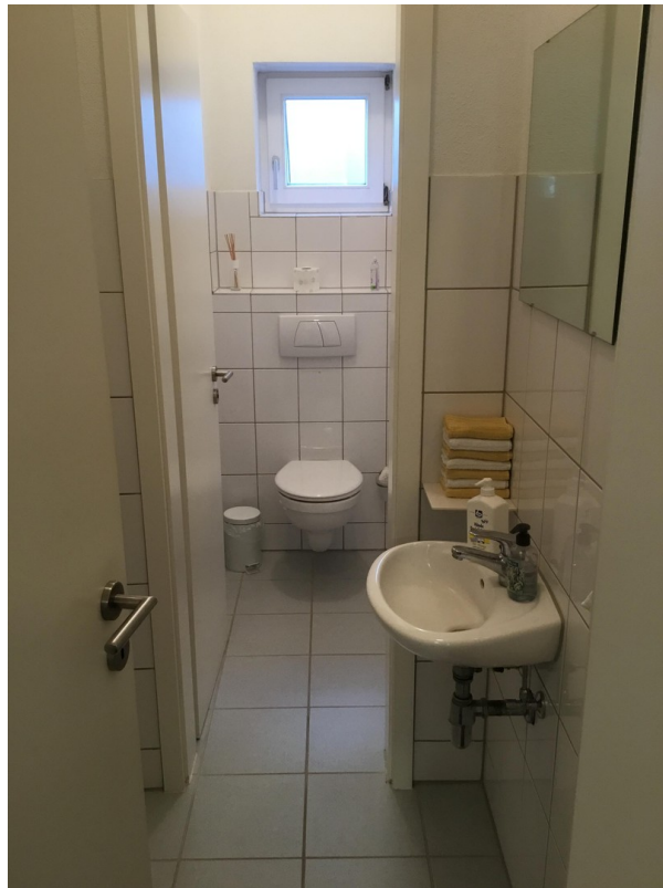
WC Damen Büro