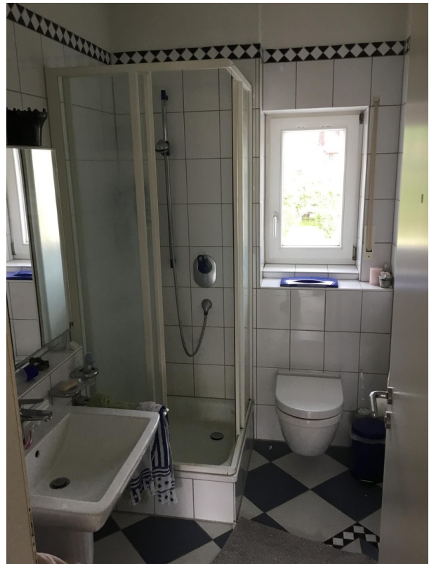
WC mit Dusche OG