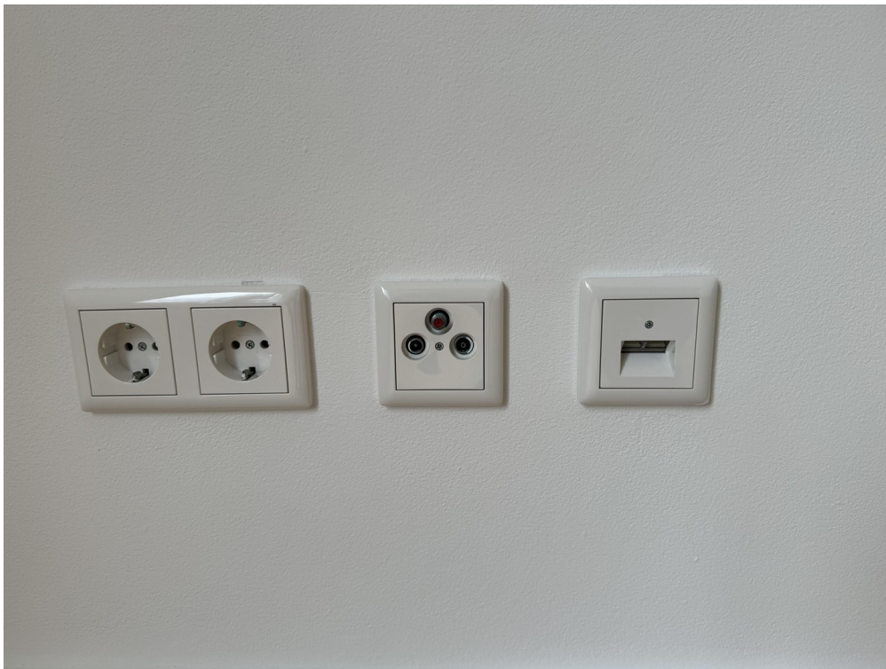
Sat / Netzwerk