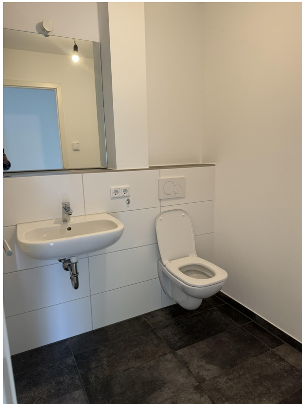
Bad / Kind