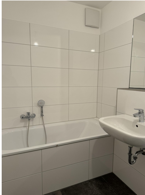
Bad / Kind