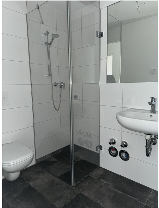
Bad / Eltern