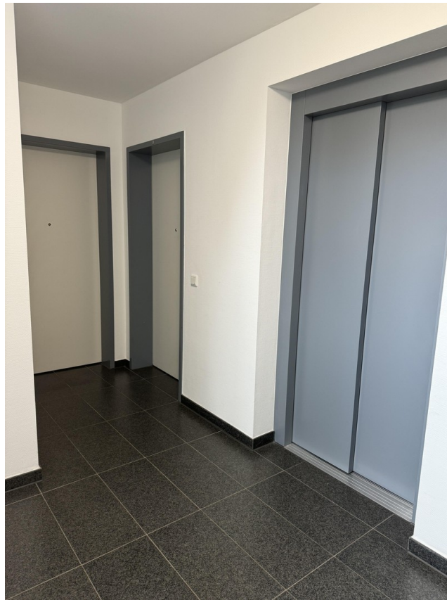
Eingang / Aufzug