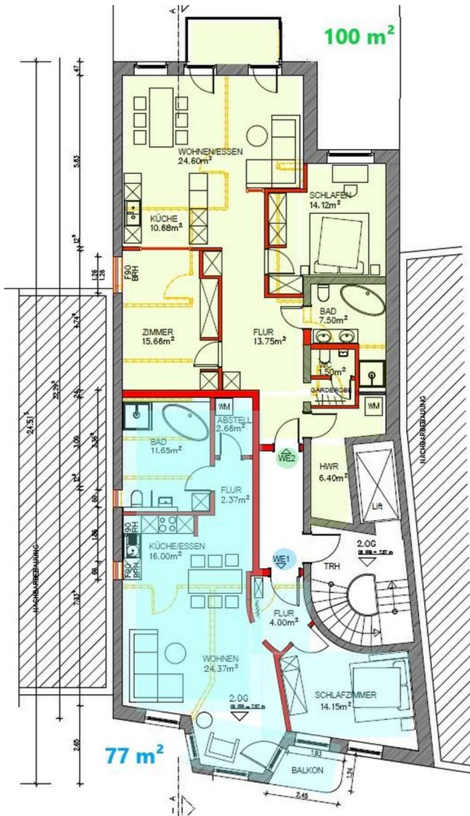
Whg. 77 qm hellblau markiert