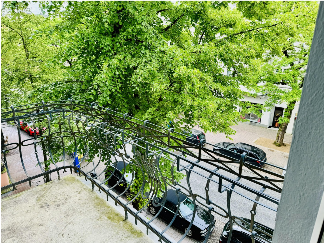
Balkon zur Mühlenstraße