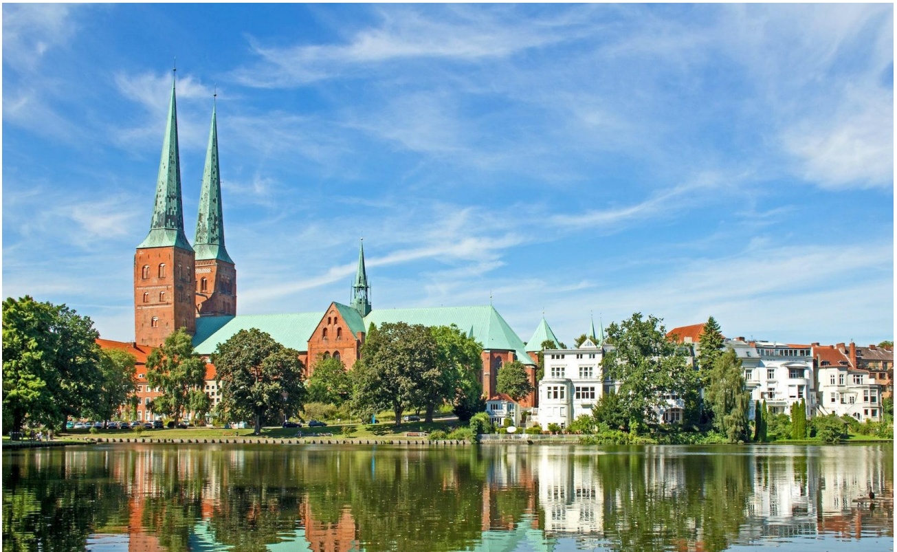
Mühlenteich 5 Minuten zu Fuß