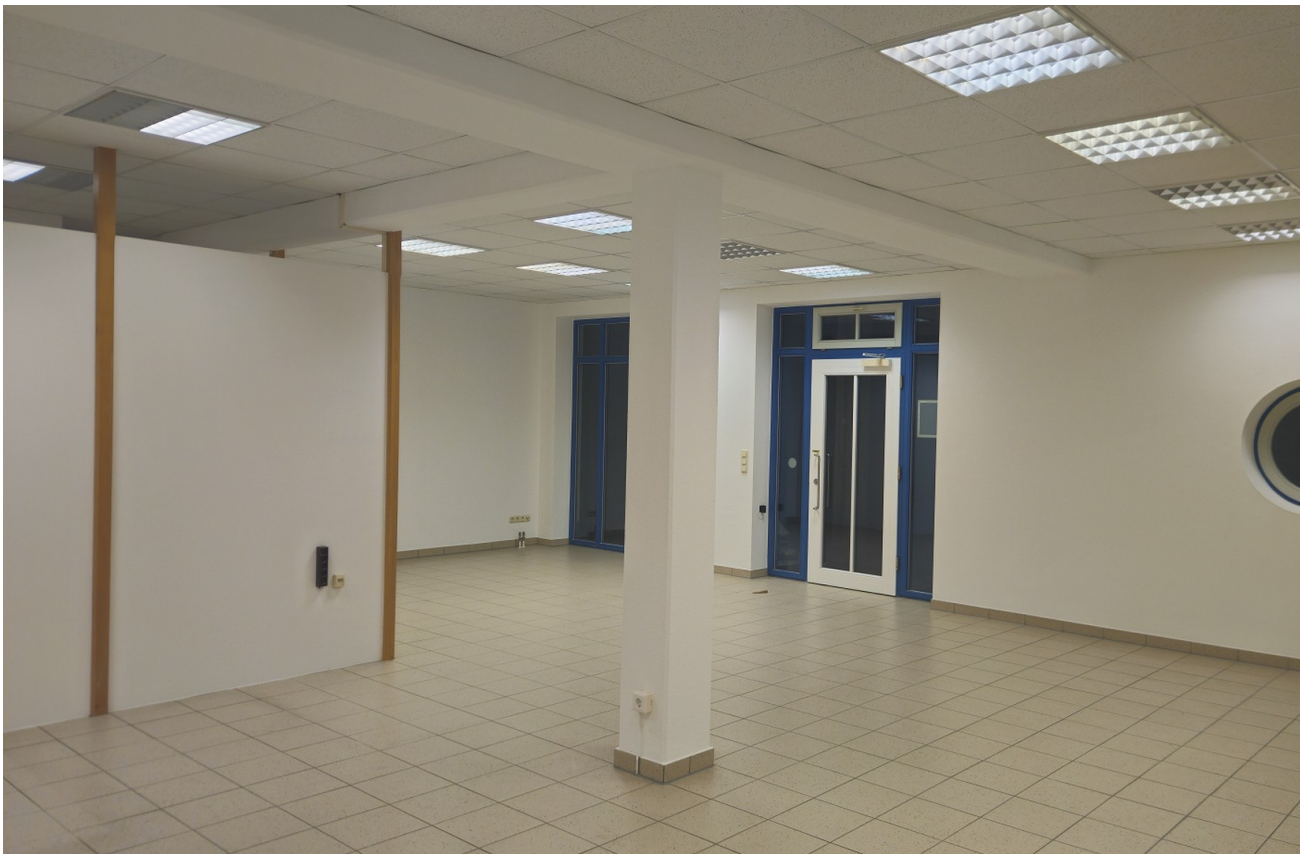
Raum von innen