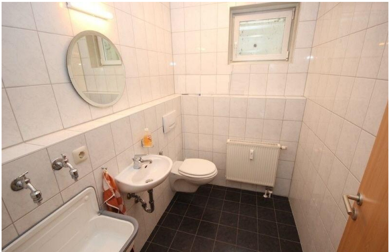
Toilette im Keller