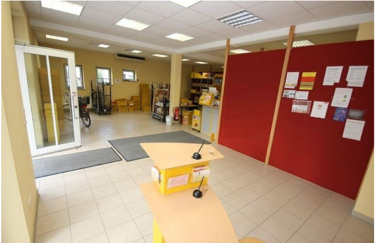
Innen damals als Post