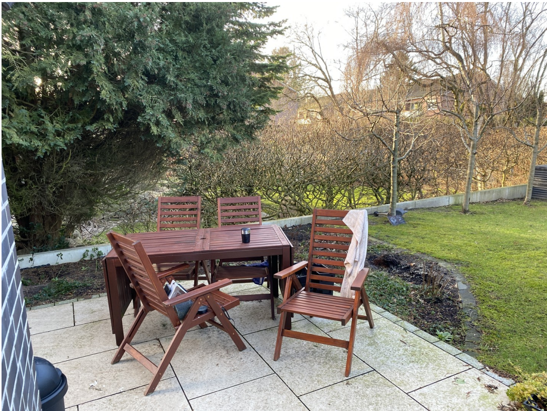
Terrasse mit kleinem Garten