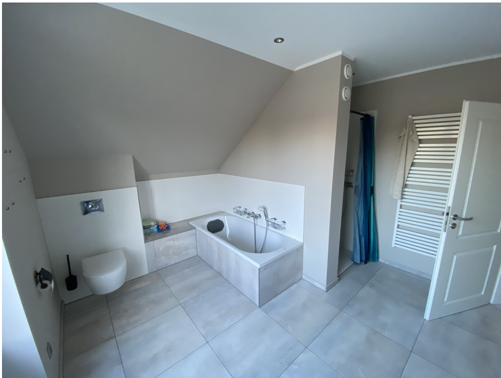
Vollbad im OG