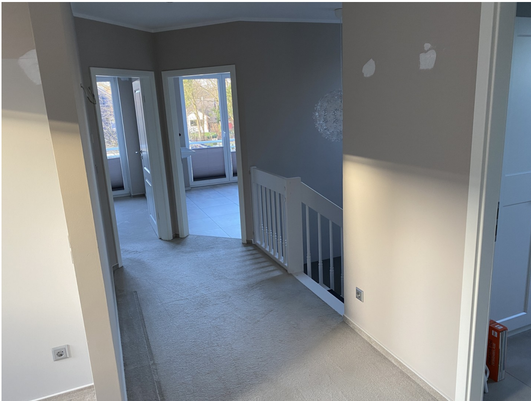
Flur OG mit Teppich