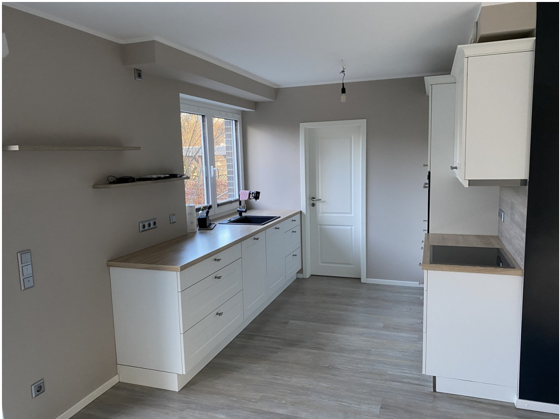
Offene Wohnküche mit Kammer