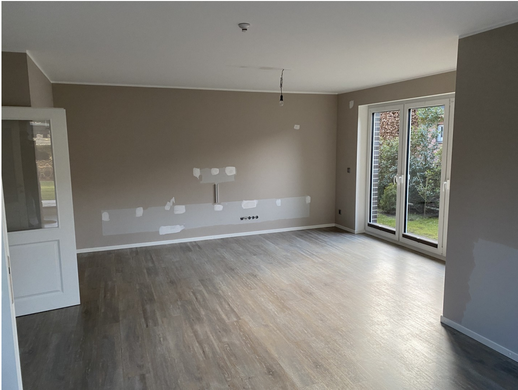
Wohnzimmer mit Flügeltür