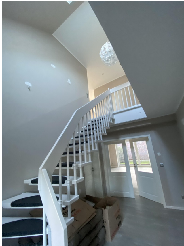
Helle Diele mit Treppe ins OG