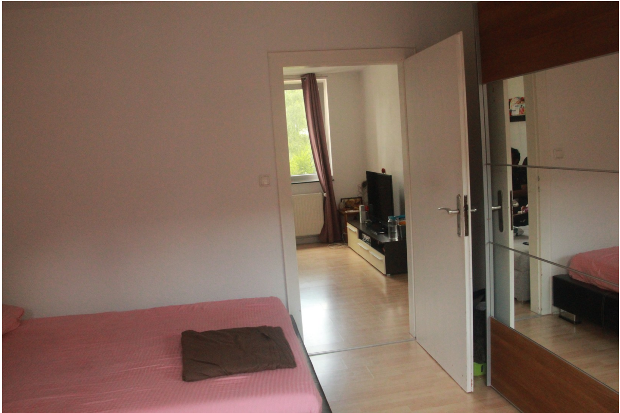
Schlafzimmer mit Tür zum Wohnz