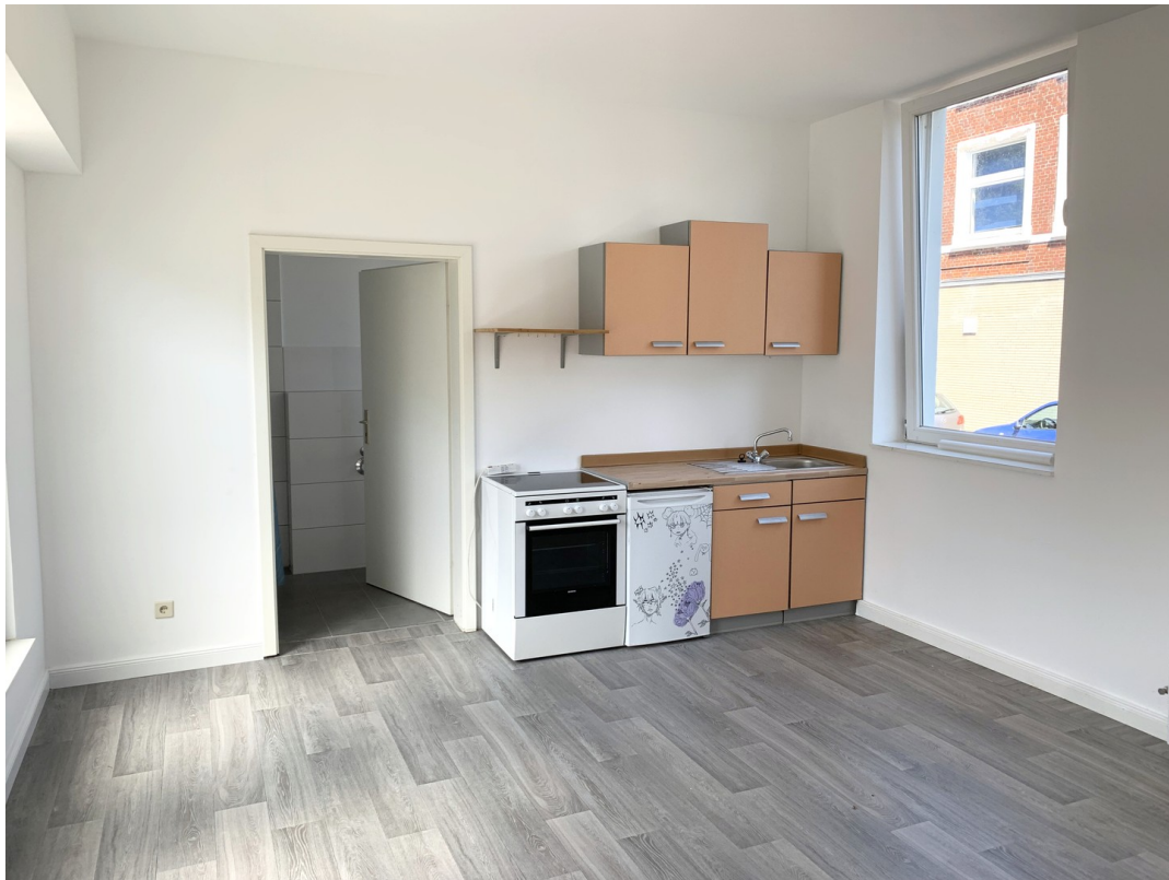
Wohnbereich mit Küche