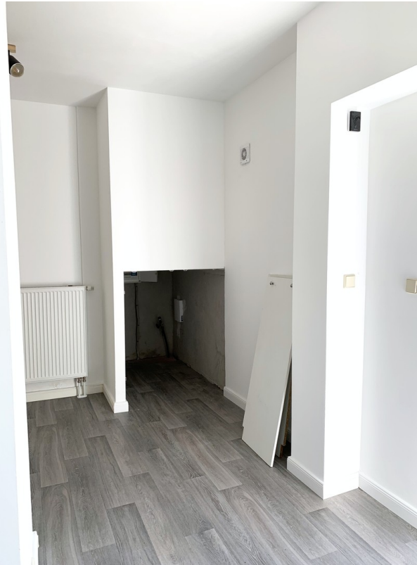
Flur mit Abstellkammer