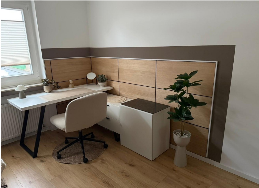
Arbeitsplatz im Schlafzimmer