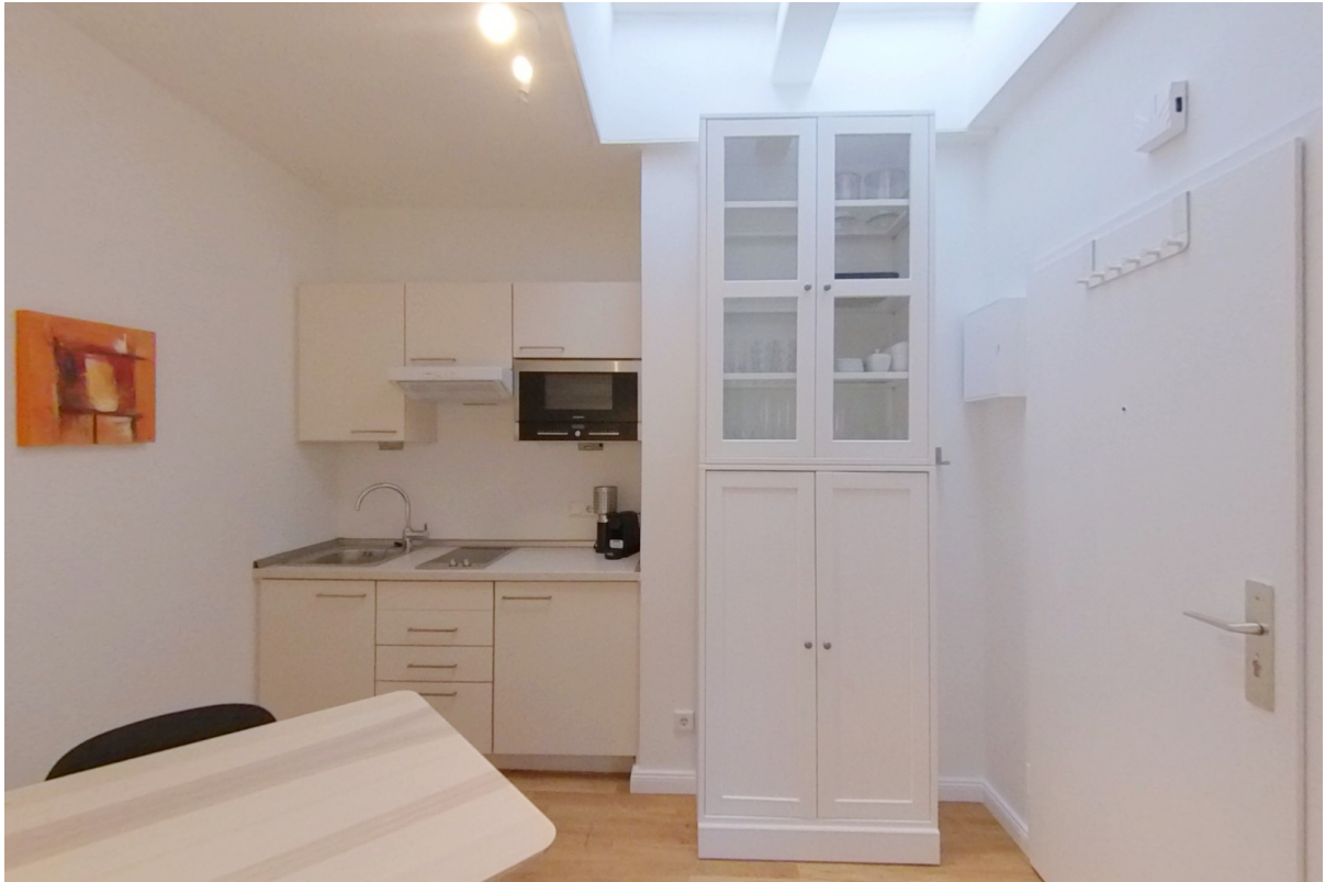
Raum mit Küche