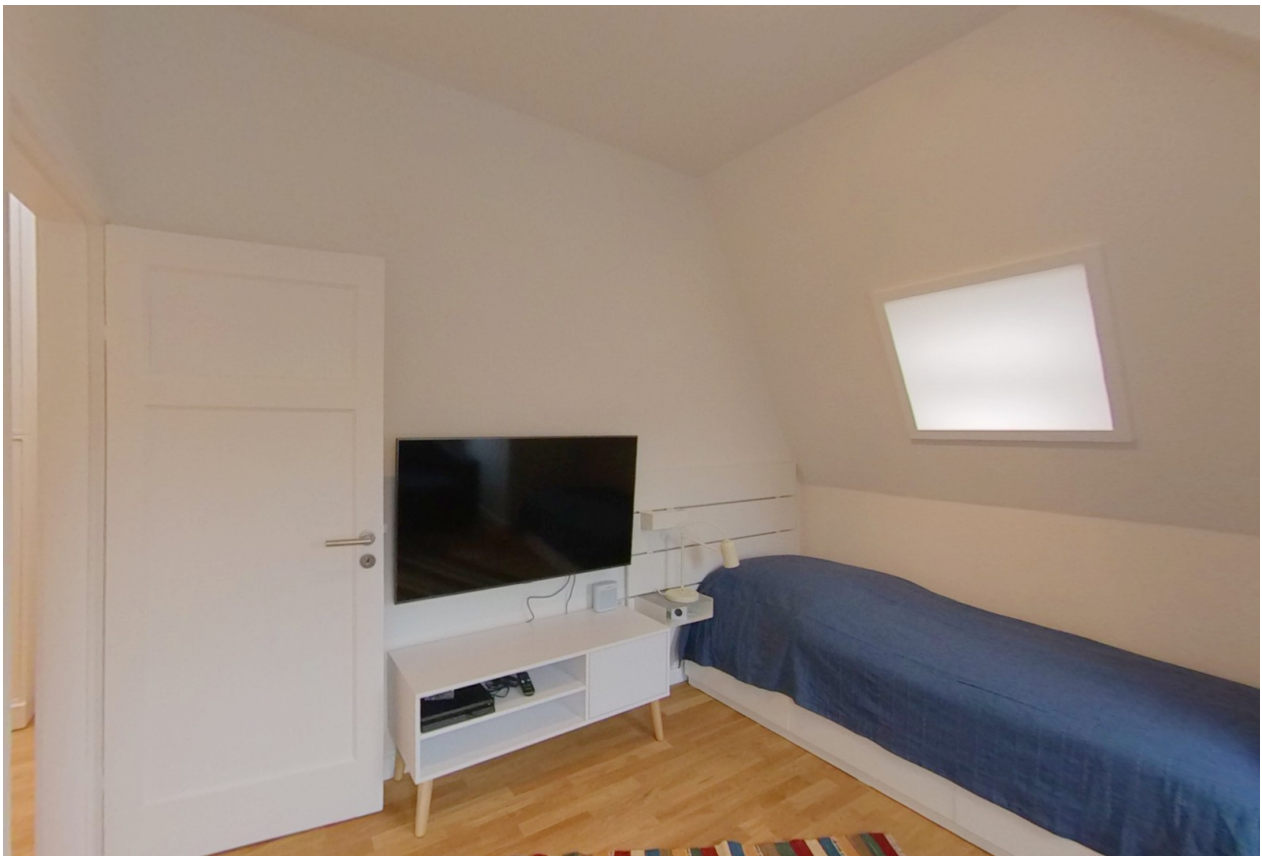
Wohnraum mit Bett