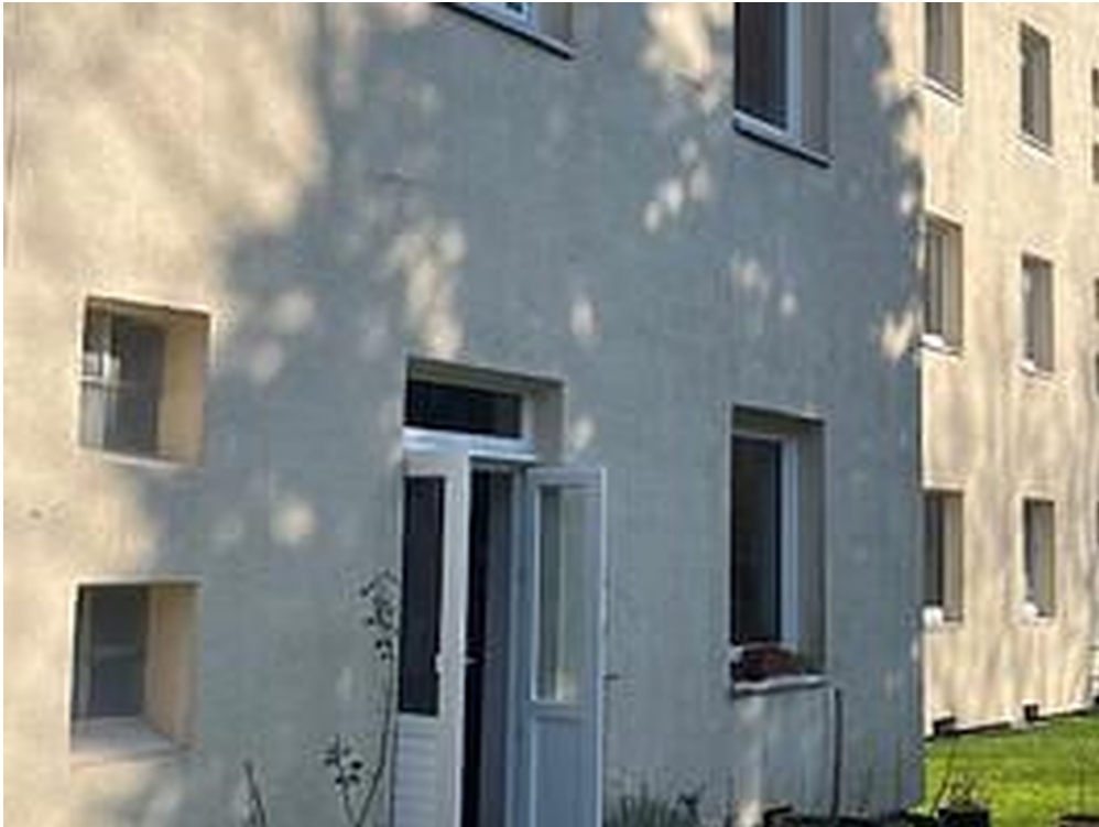
Musterbild für Gartenzugang