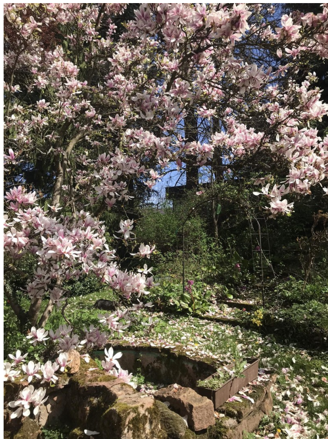
Treppe zum alten Steintisch