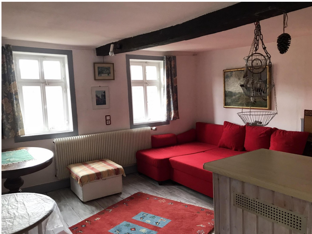
Zimmer 2. OG mit Kochnische