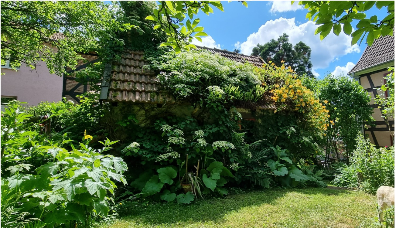
Gartenansicht und Hexenhaus