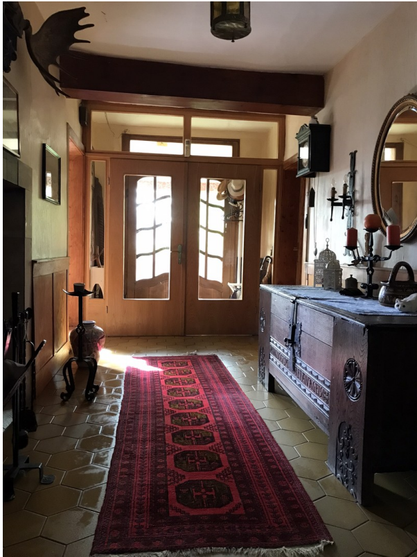
Flur, Blick auf Haupteingang