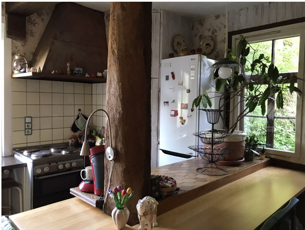
Küche mit Frühstückstheke