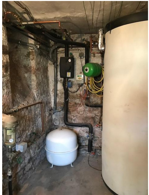
Technikkeller Solarregler, etc