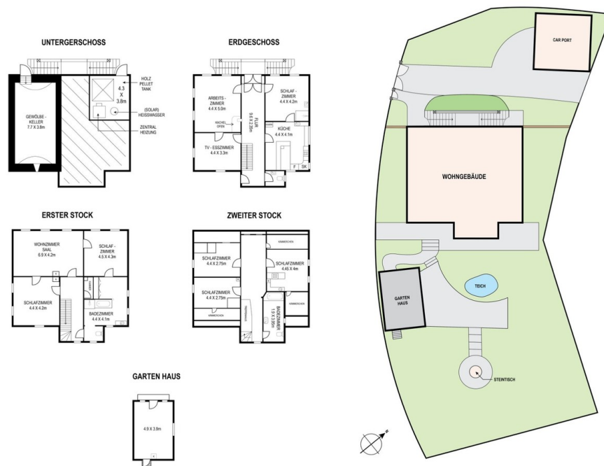
PFARRHAUS ANNO 1801

ALLE GRUNDRISSSE SIND NUR FÜR DIE ILLUSTRATION UND FORMEN KEINE RECHTLICHEN ANSPRÜCHE. ALLE MASSE UND PROPORTIONEN BASIEREN AUF UNGEFÄHRE ZAHLEN.