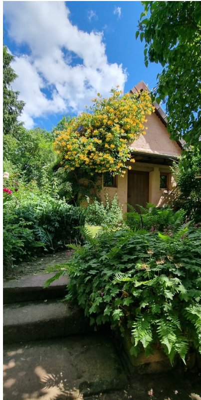
Hexenhäuschen im Garten