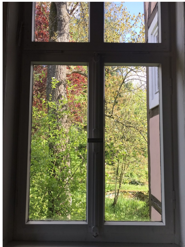
Ausblick in den Garten, 1. OG