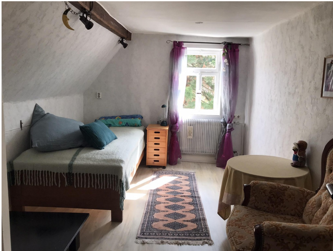
Zimmer 2. OG