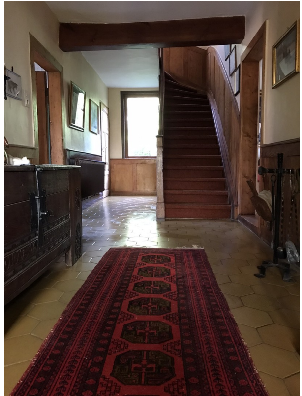
Flur mit Treppe zum 1. OG