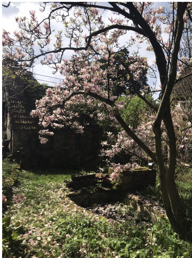
Garten mit gemauerten Grill