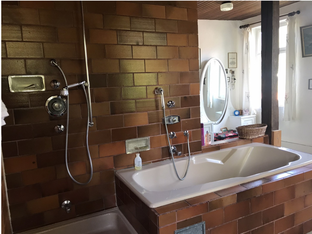
Badezimmer mit Ankleide 1. OG