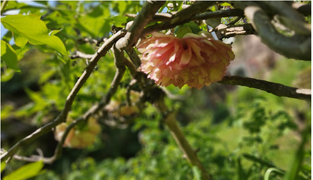
Besondere blühende Sträucher