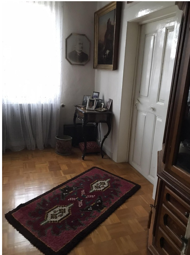
gr. Zimmer / kleiner Saal