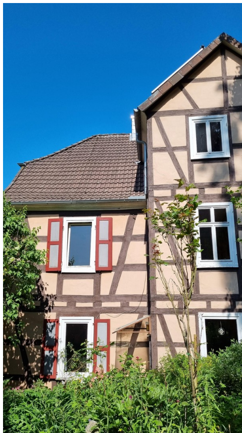
Ansicht vom Garten aus