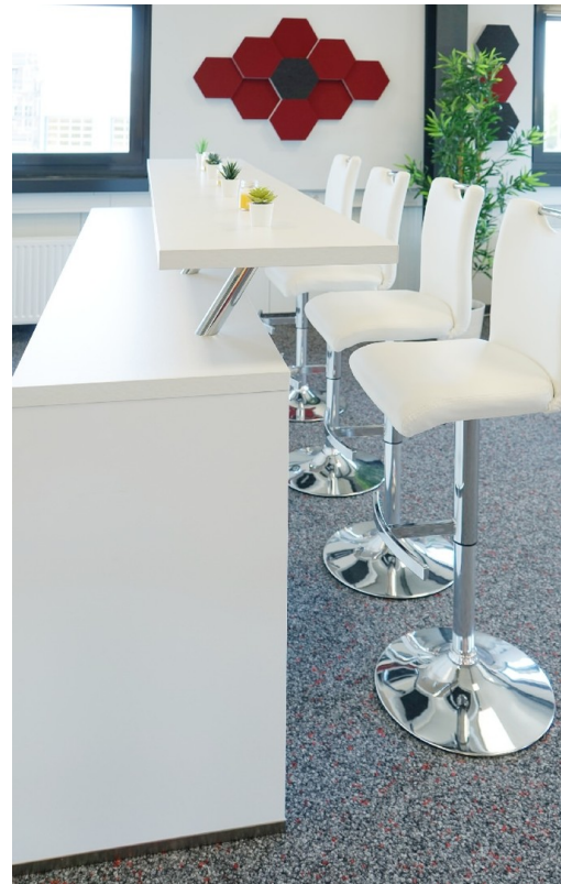
Bar 1. OG SÜD