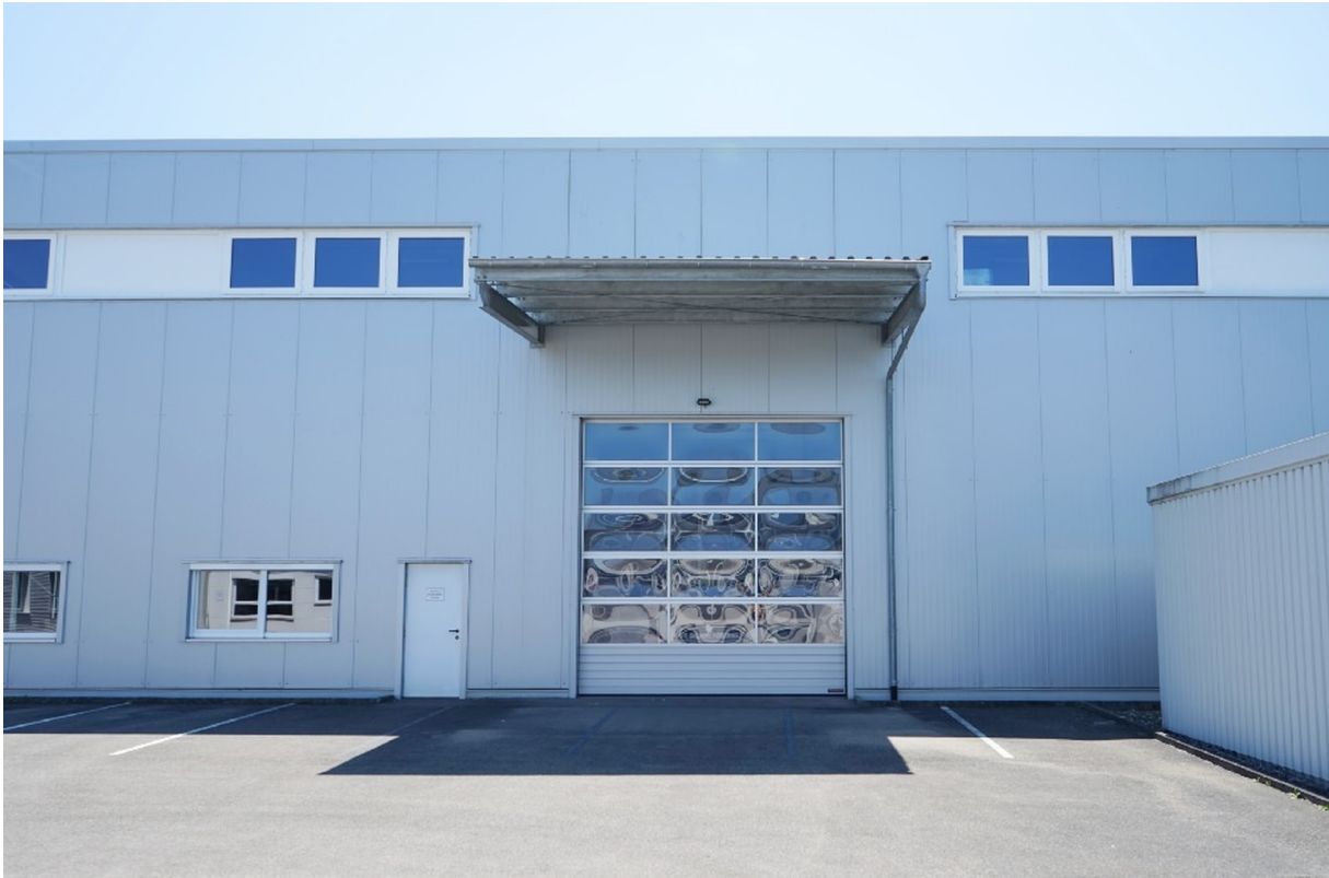
Sektionaltor Lagerhalle SÜD