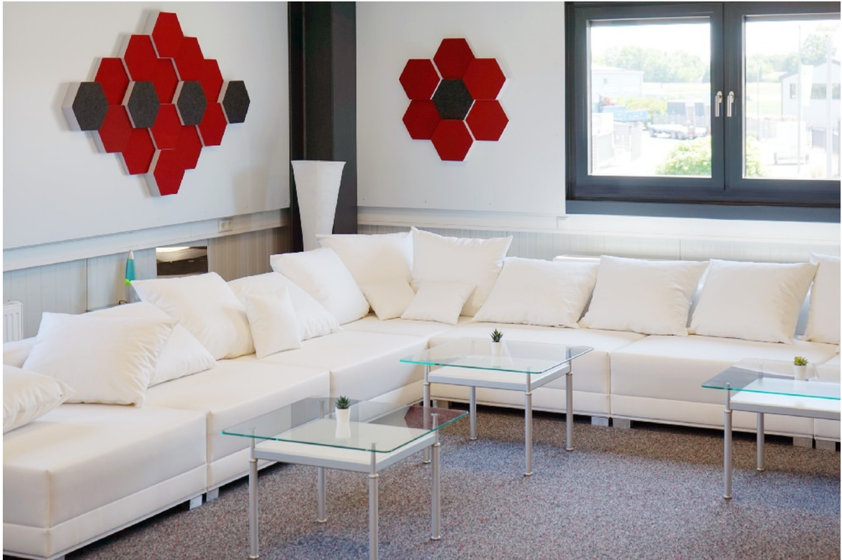
Lounge 1. OG SÜD