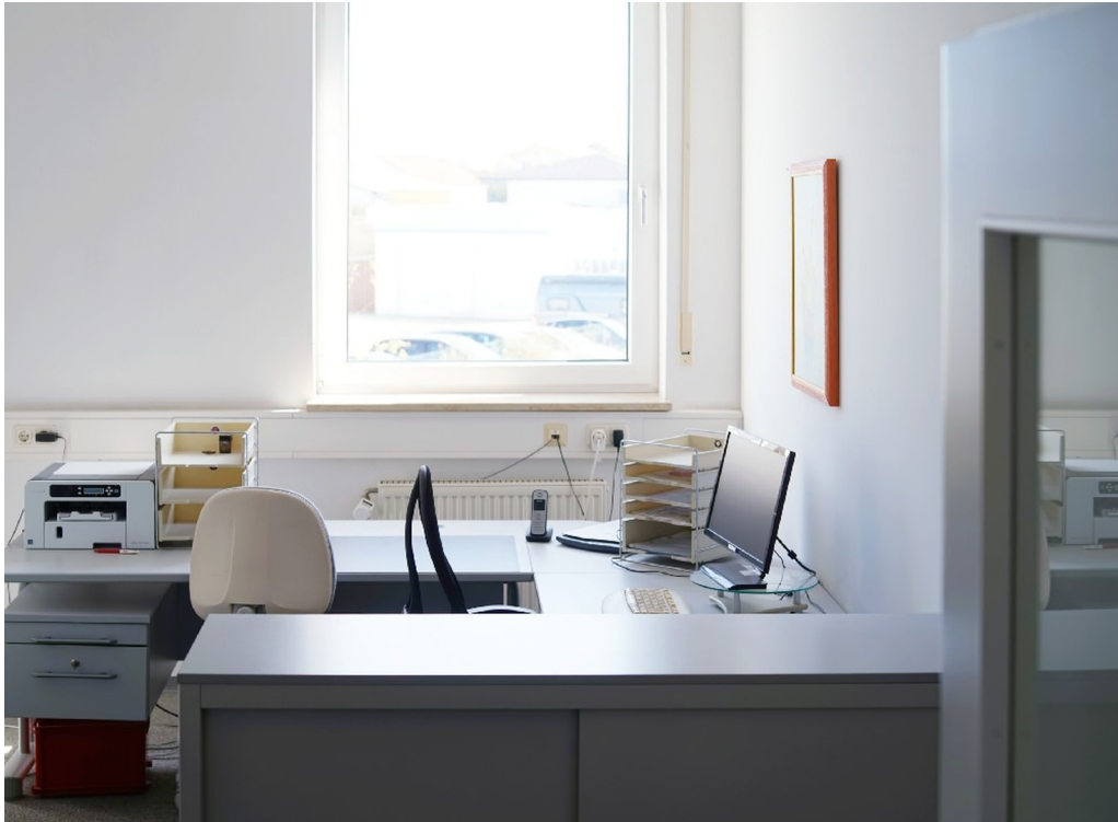
Büro 1. OG NORD