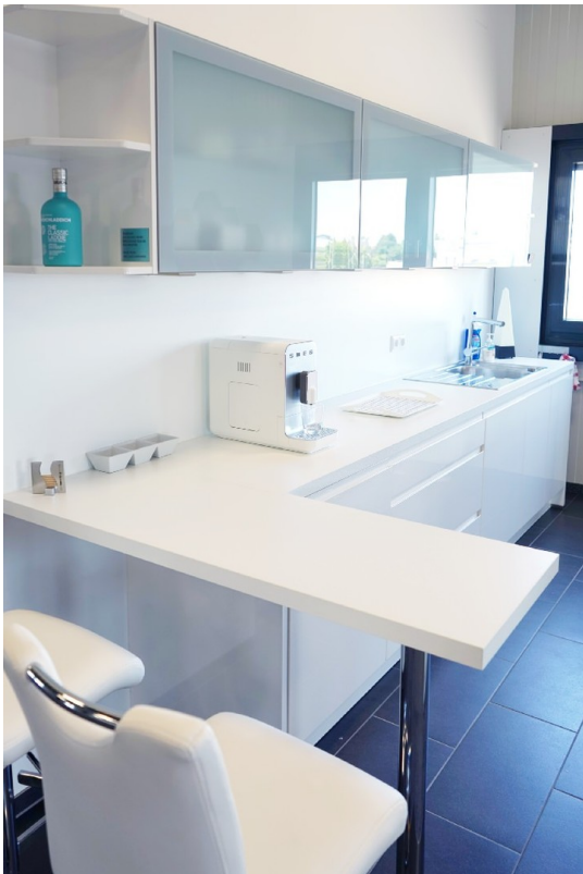
Bar 1. OG SÜD