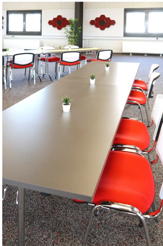
Konferenzraum 1. OG SÜD