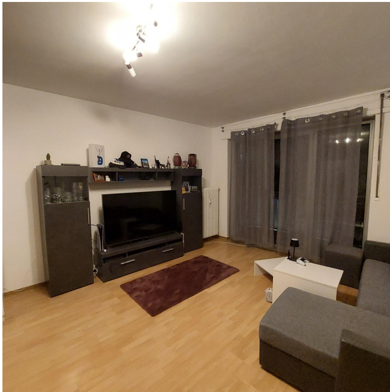
Wohn- und Schlafbereich 2