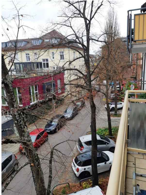
Aussicht Balkon 1