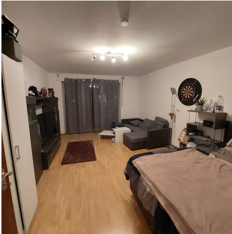
Wohn- und Schlafbereich 1