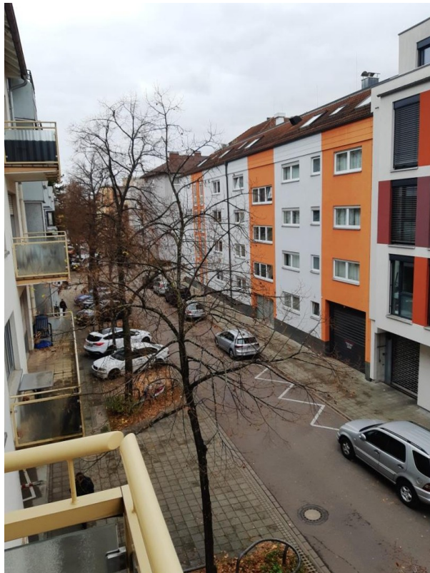
Aussicht Balkon 2