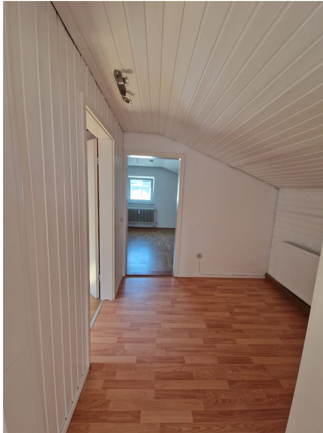
Flur ins Schlafzimmer