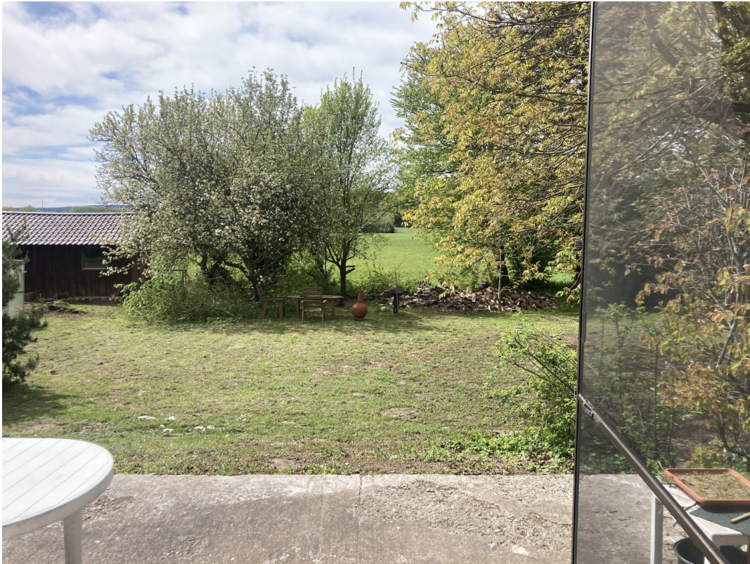
Willkommen in der Natur