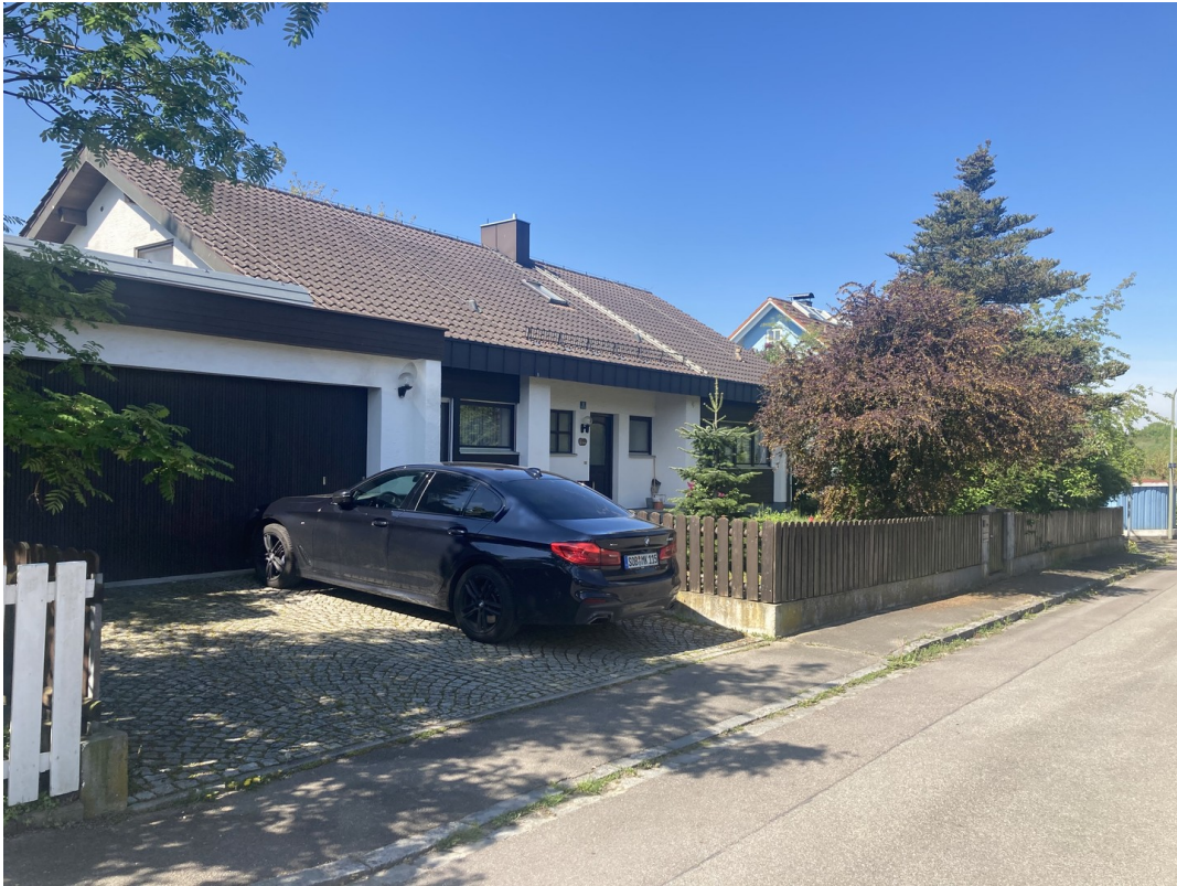
Nordseite / Garage / Eingang