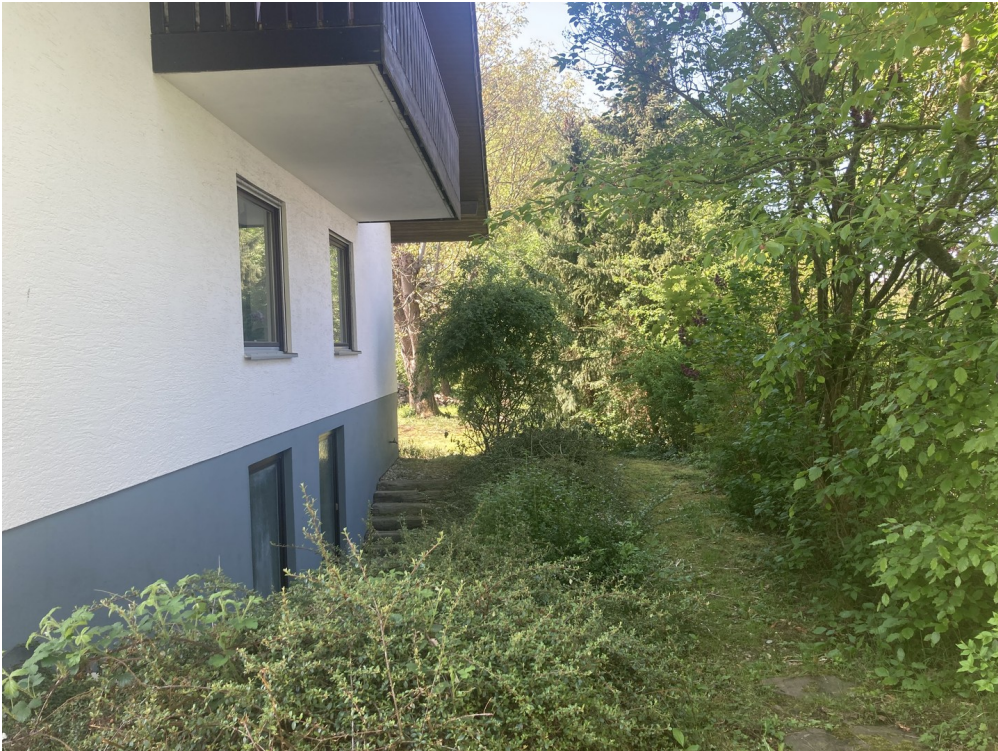
Weg in Garten