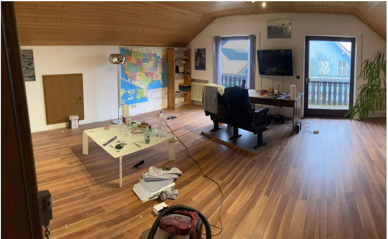
Büro / Wohnzimmer, OG