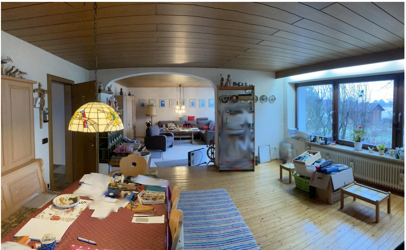
Wohnzimmer & Esszimmer, EG