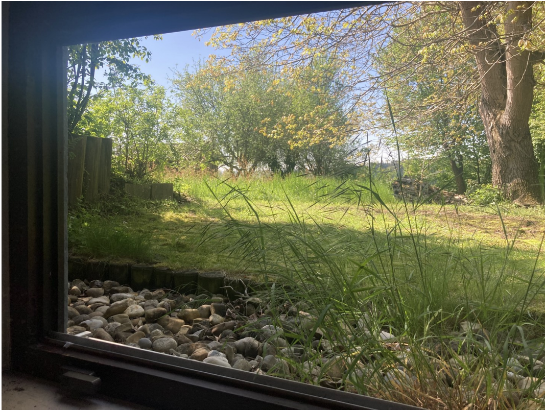
Ausblick Pool auf Garten