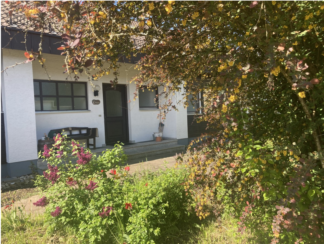
Vorgarten / Eingang