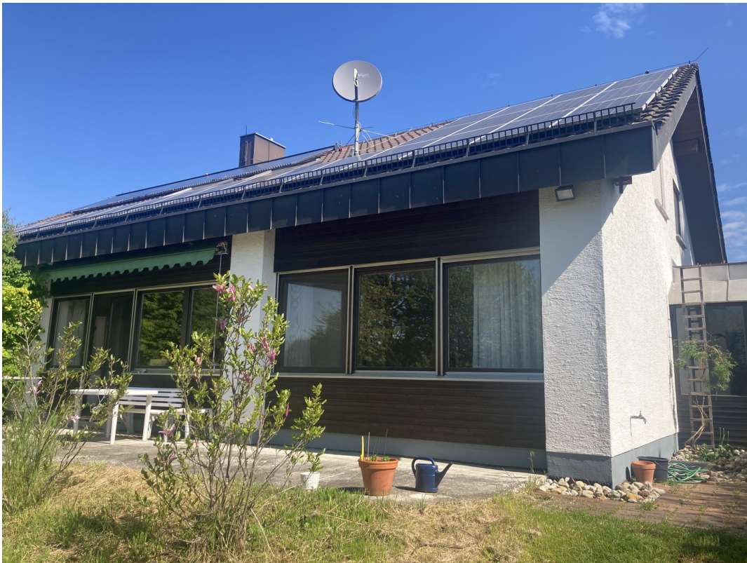
Südseite & Terrasse