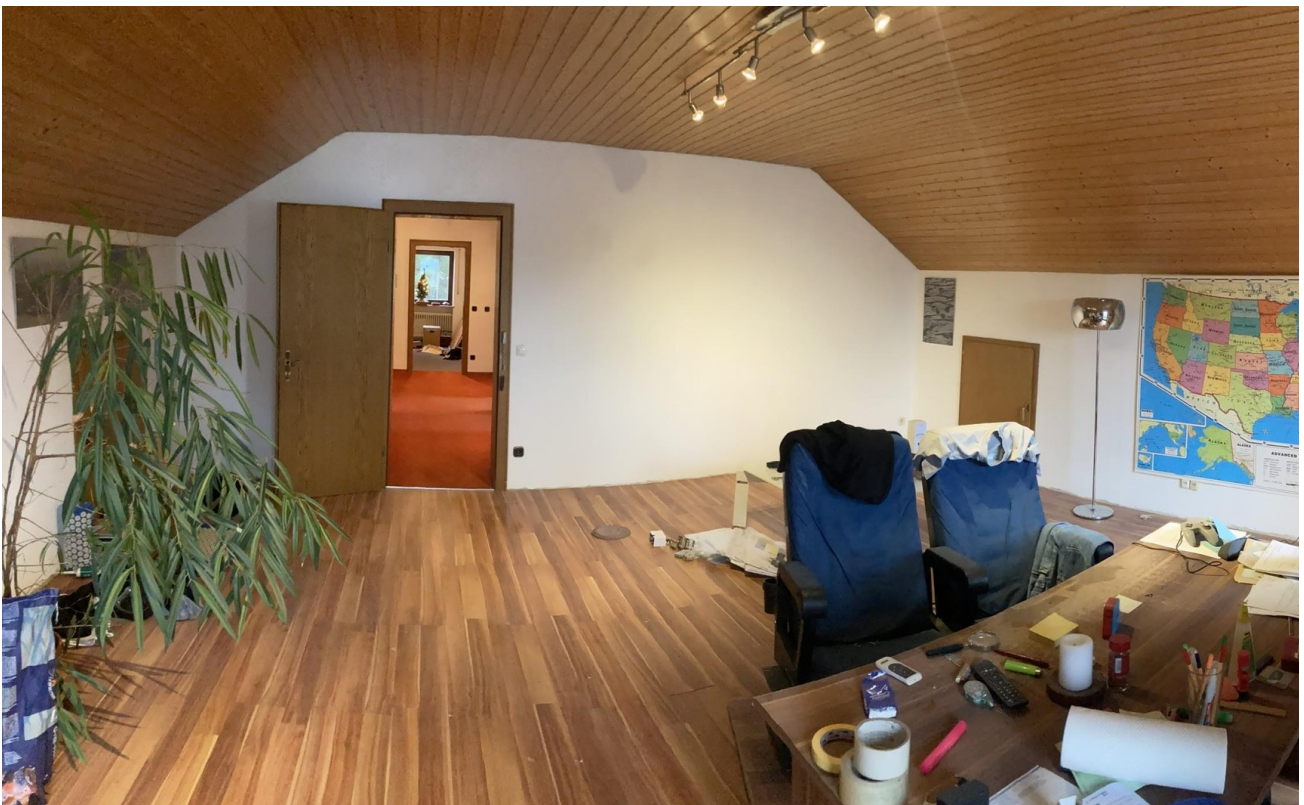
Büro / Wohnzimmer, OG