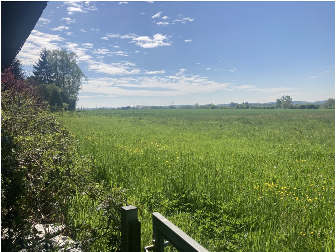
Blick ins Grüne, Südost