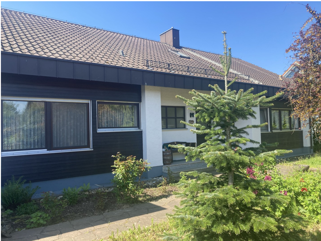
Vorgarten / Eingang 2