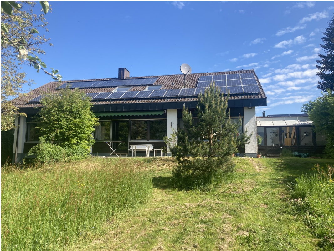
Südseite & Garten 2