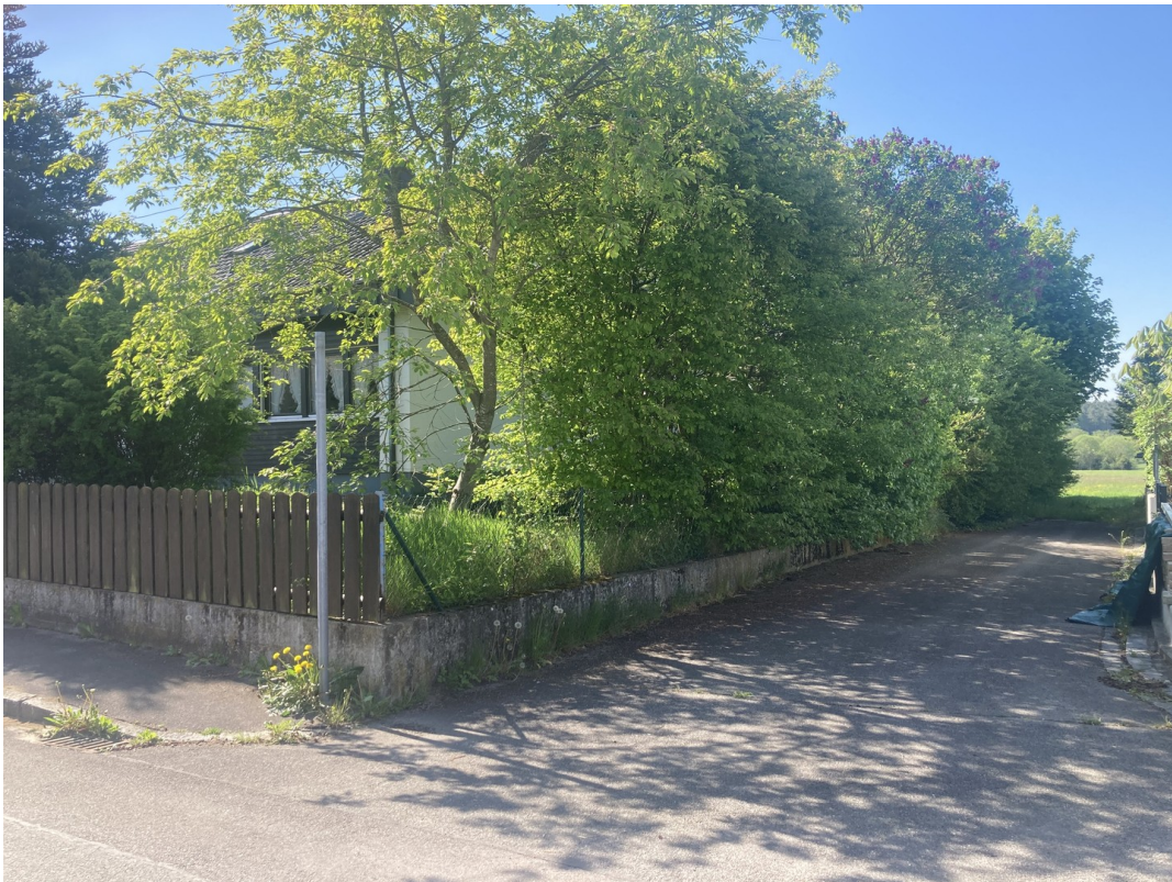
Draufsicht / Wirtschaftsweg 2