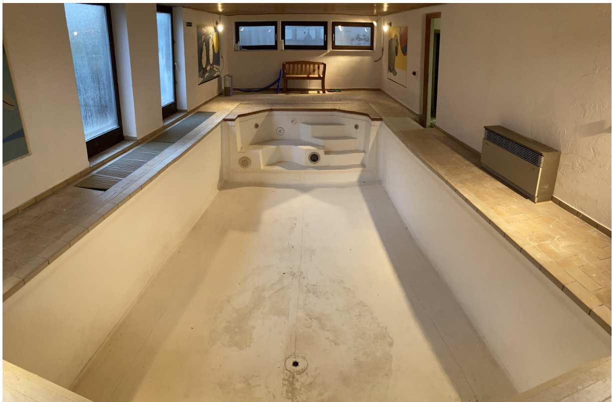
Pool, Blick Richtung Norden