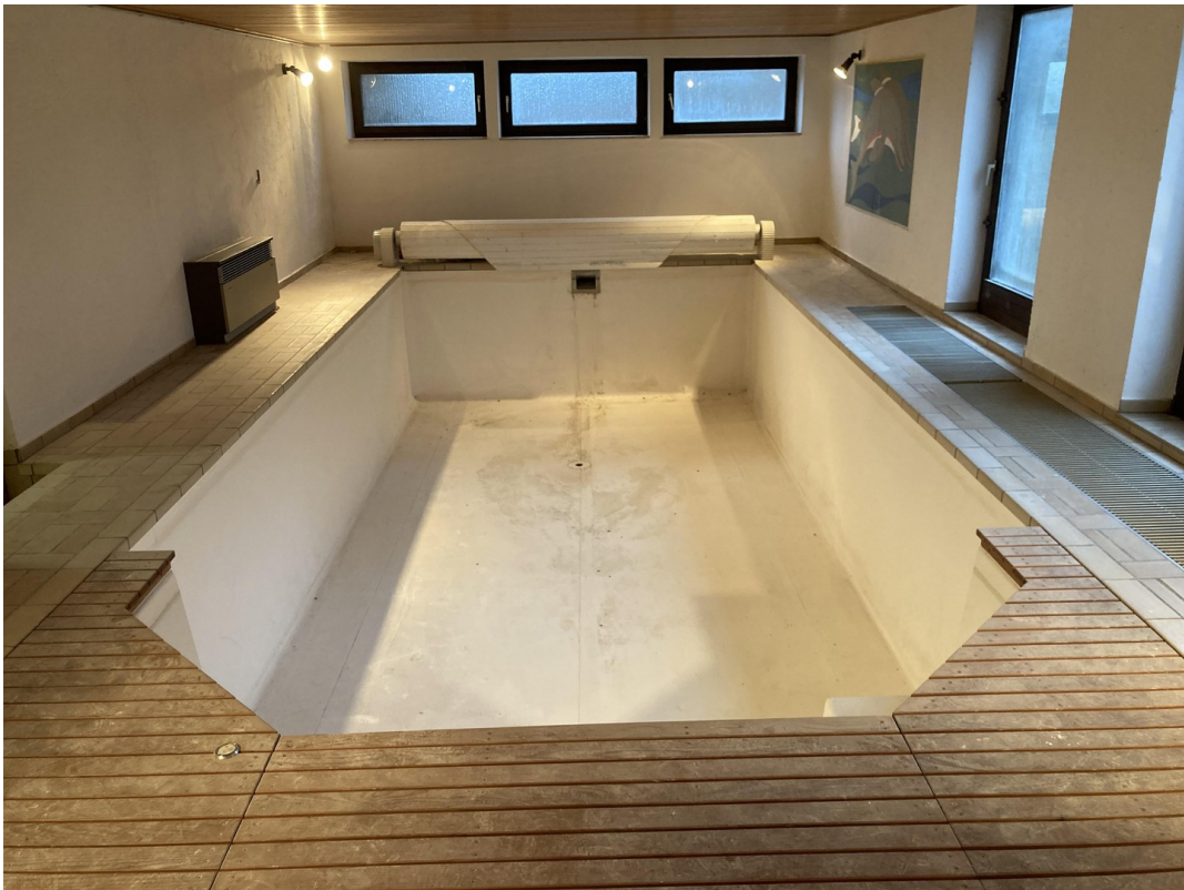
Pool, Blick Richtung Süden