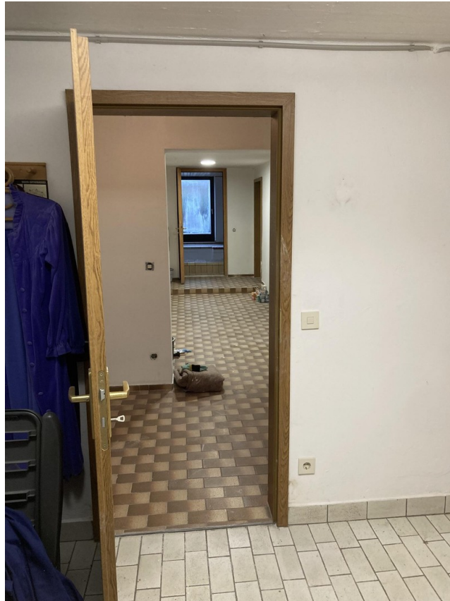
Flur, UG 2