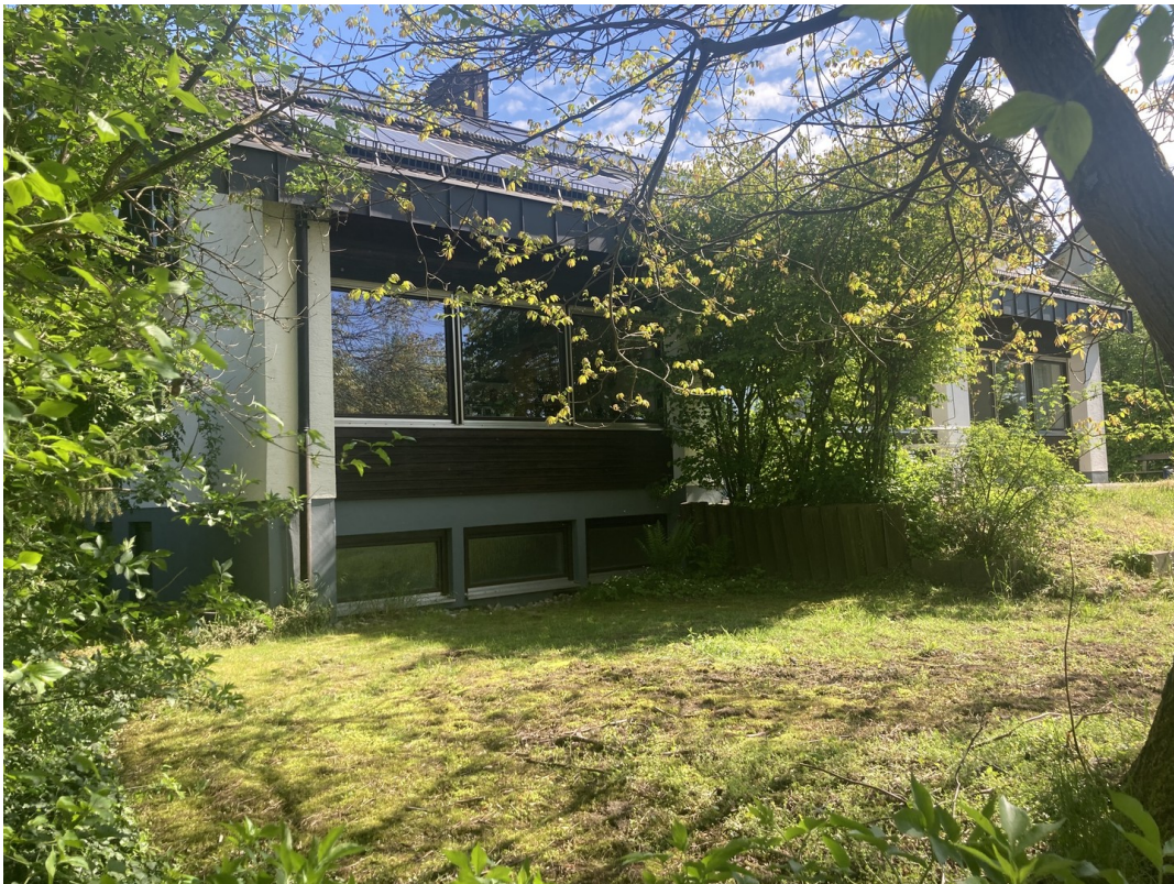
Süden & Westen