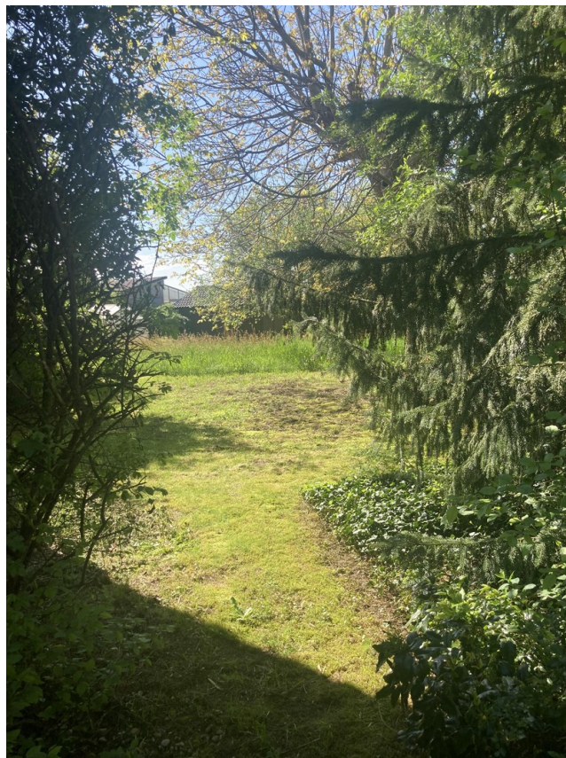
Weg in Garten 2