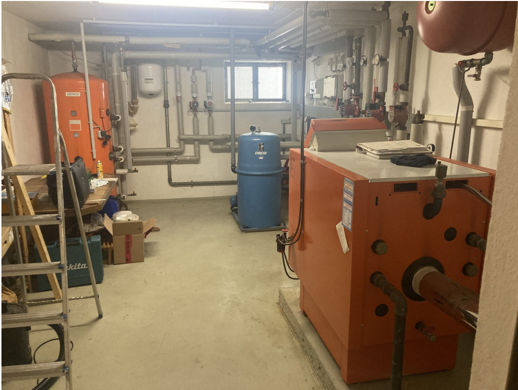
Heizraum – Top Anlage!