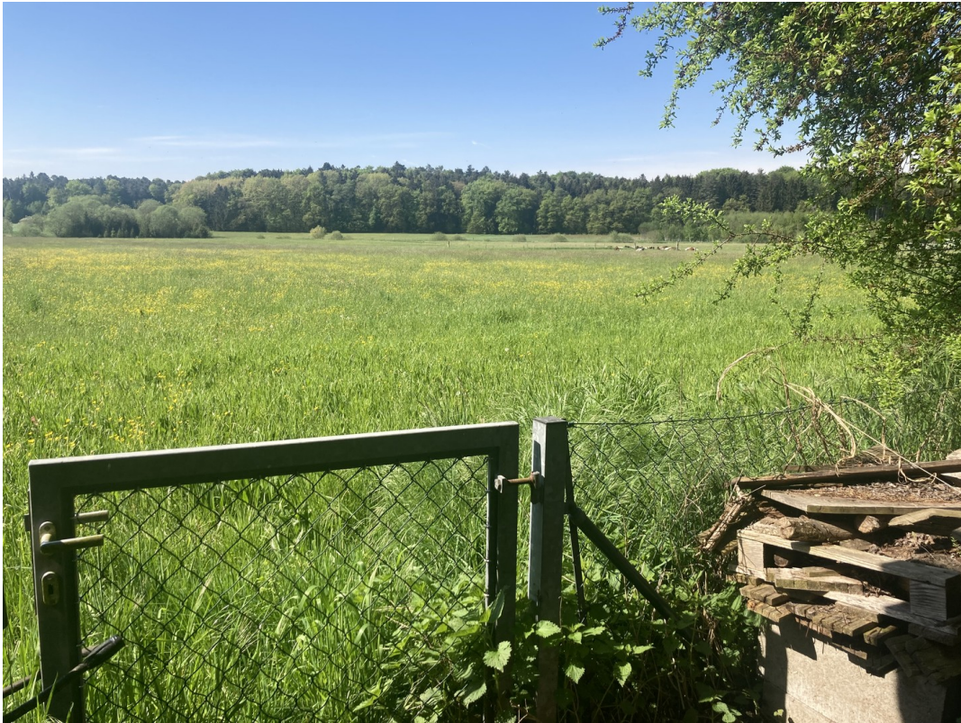
Blick ins Grüne, Süden