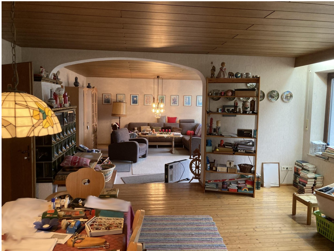
Wohnzimmer & Esszimmer, EG 2