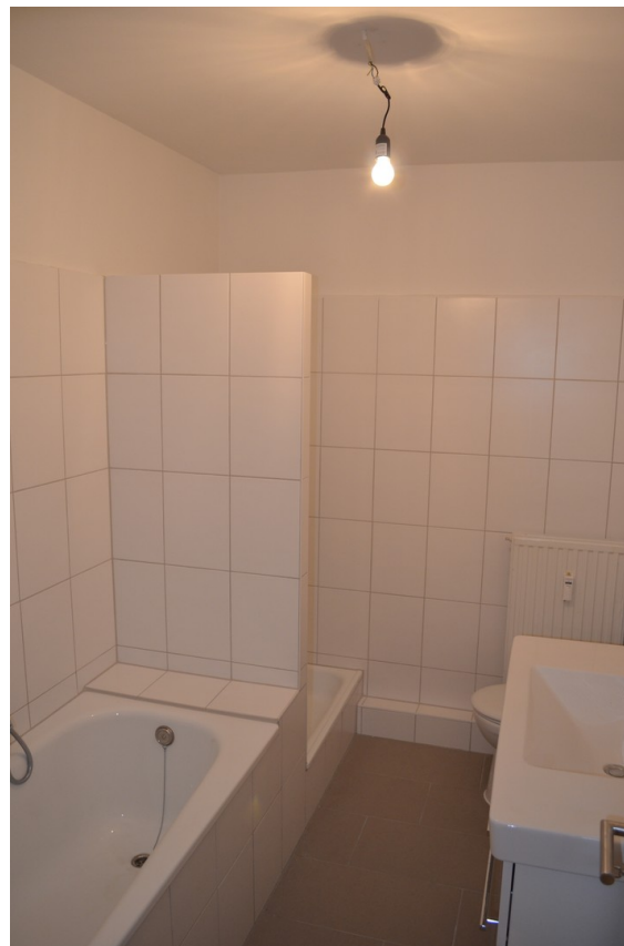
Bad (Badewanne / Dusche )