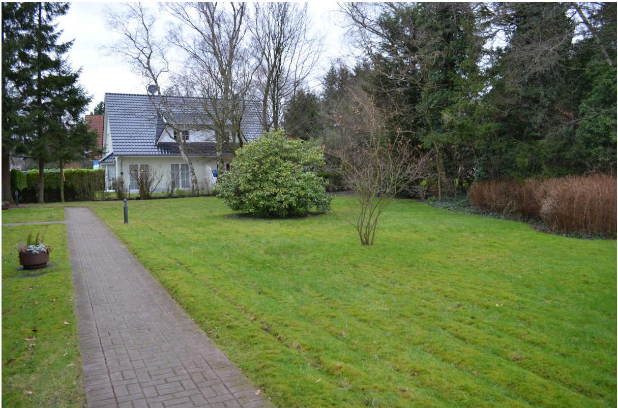
Hinter dem Haus große Grünanla