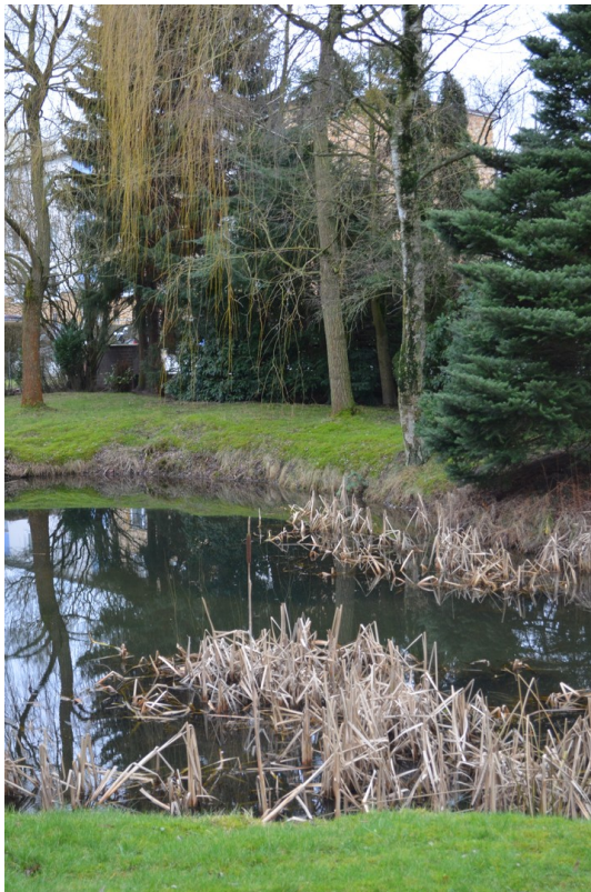
Blick in die Parkanlage