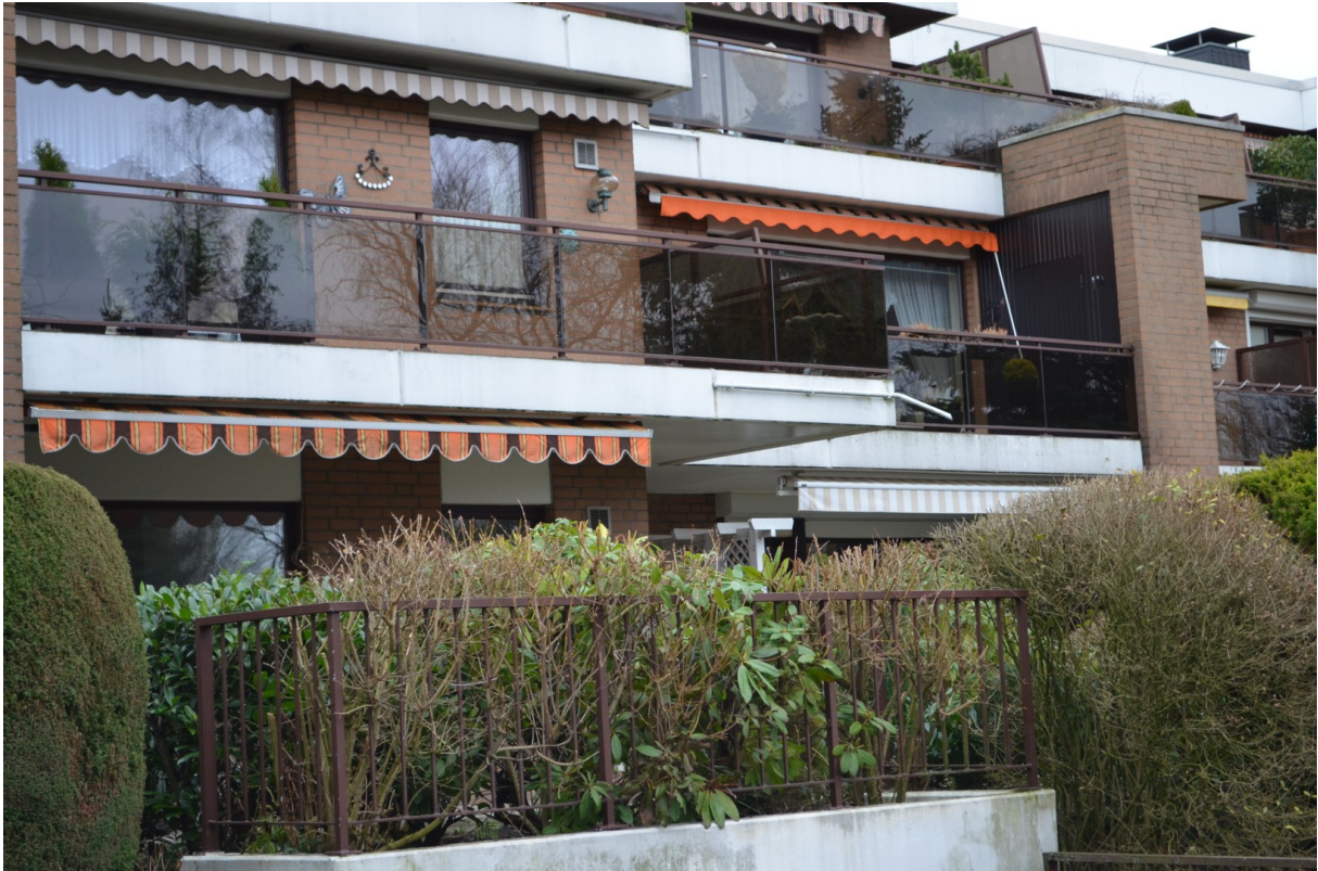
Blick auf das Haus