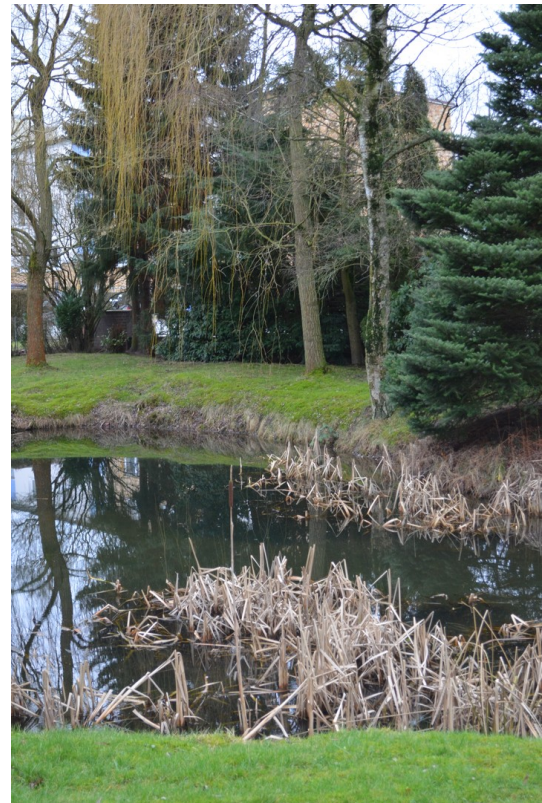
Blick in die Parkanlage