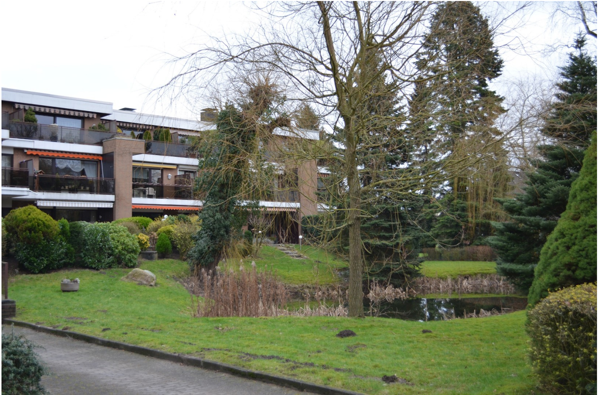
Aussen Blick von der Strasse