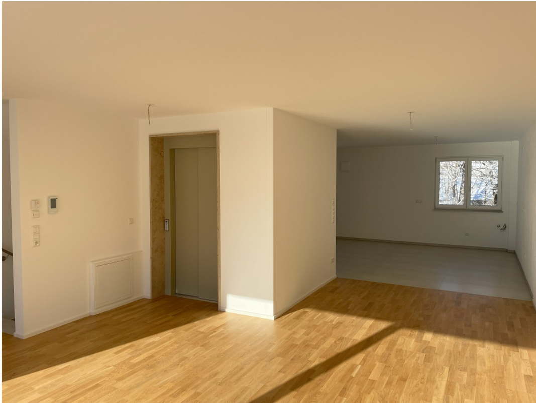
Blick in Küche aus Wohnbereich