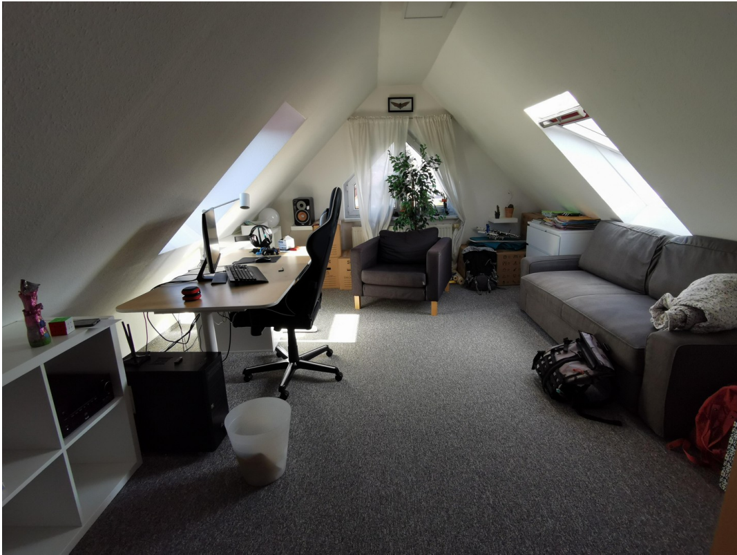
DG Hobbyraum rechts