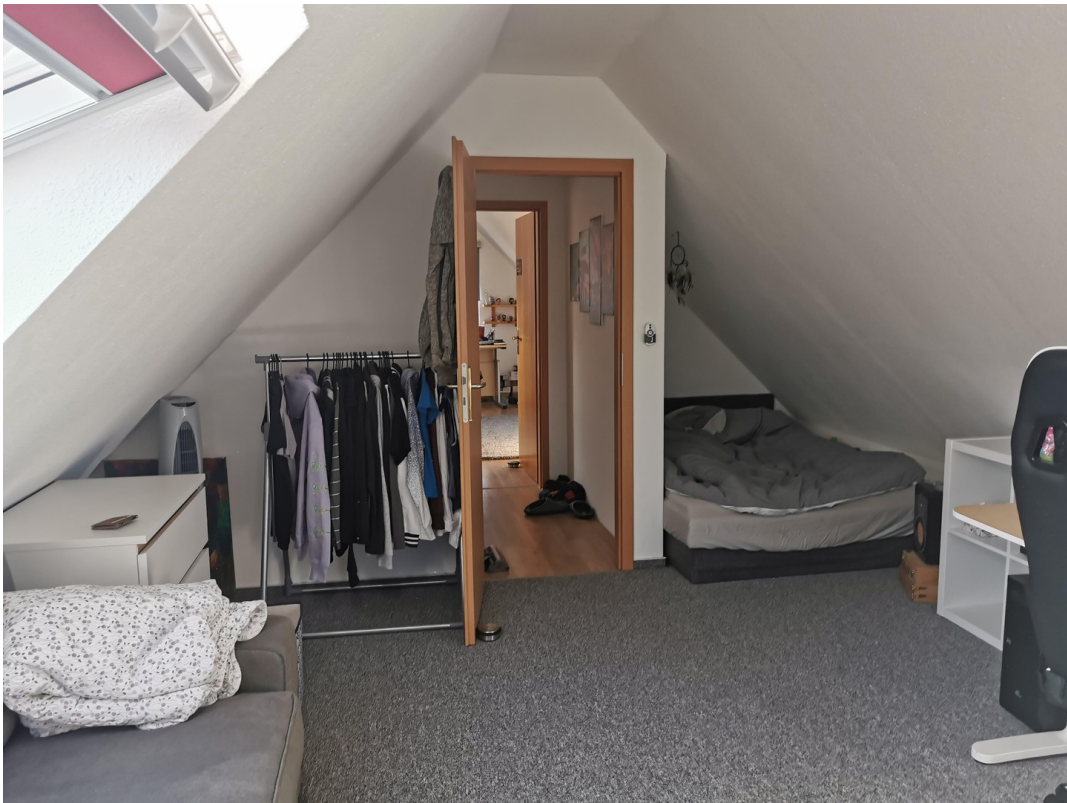
DG Hobbyraum rechts