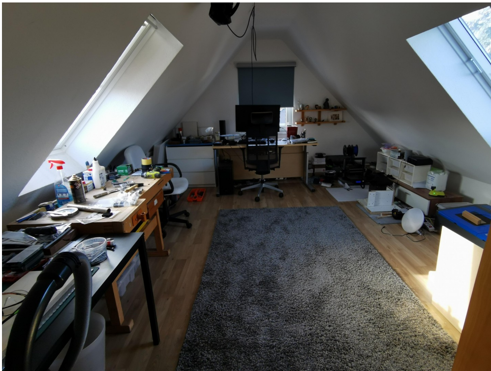
DG Hobbyraum links