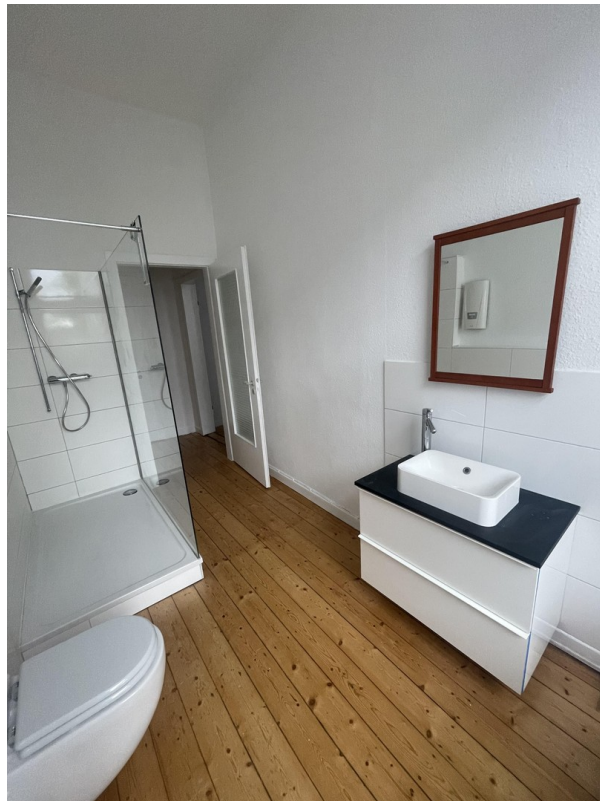
Sehr große Dusche