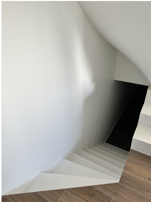
Treppe zu Keller