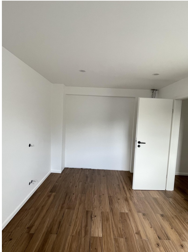
Schlafzimmer 1 oben