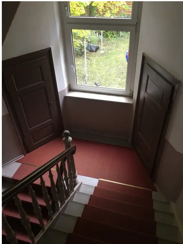
Hausflur mit Abstellkammer