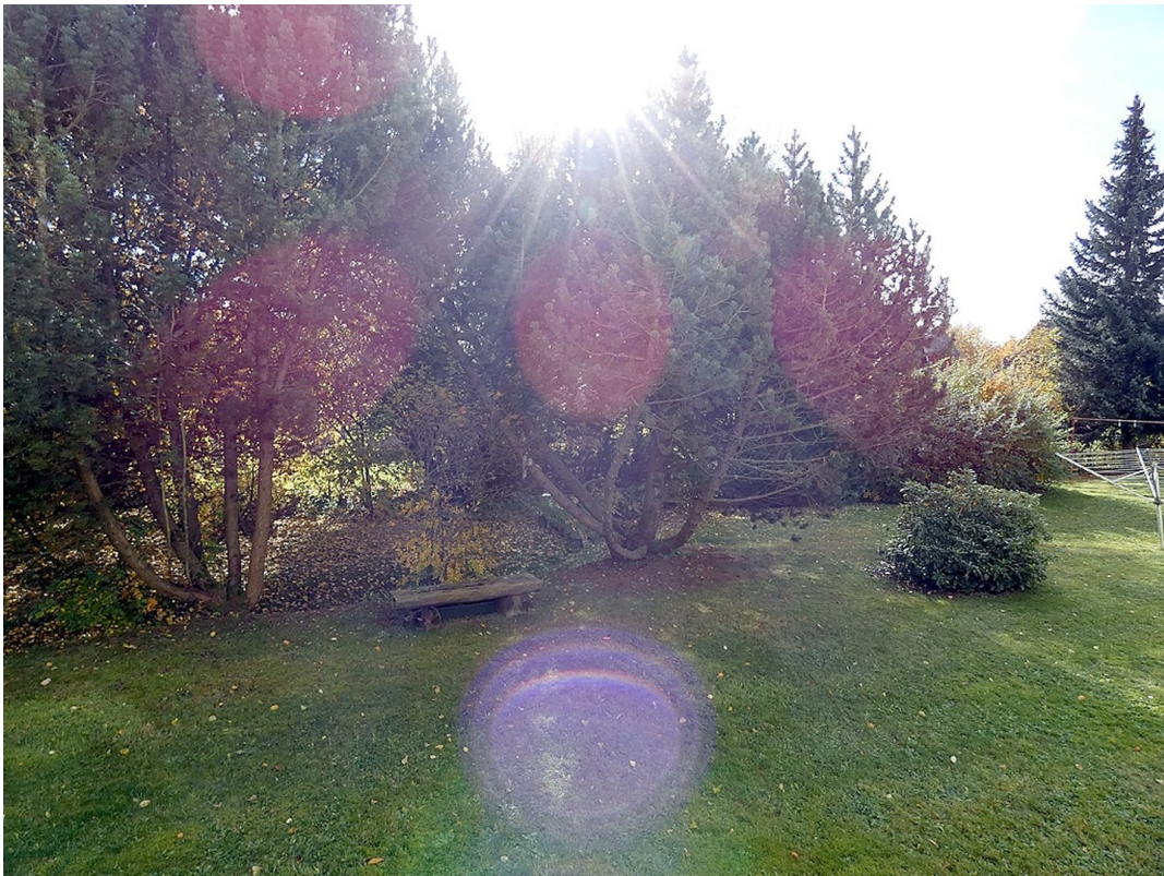
Blick in Garten