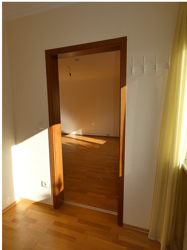
Blick vom Schlafbereich