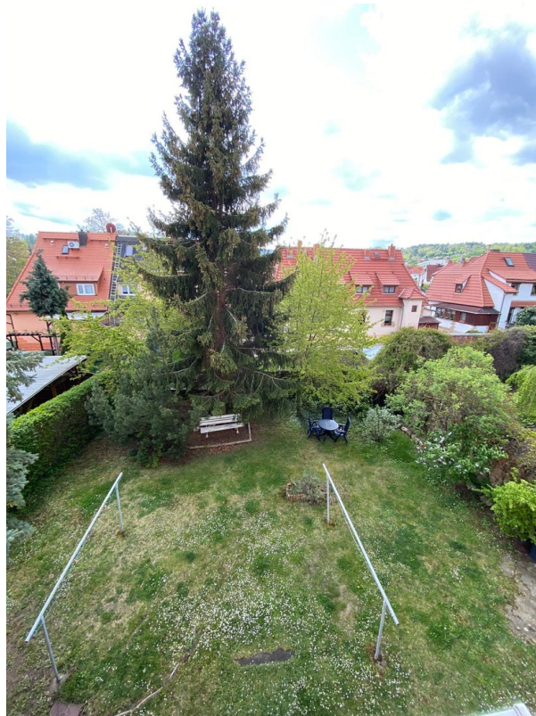
Garten hinterm Haus