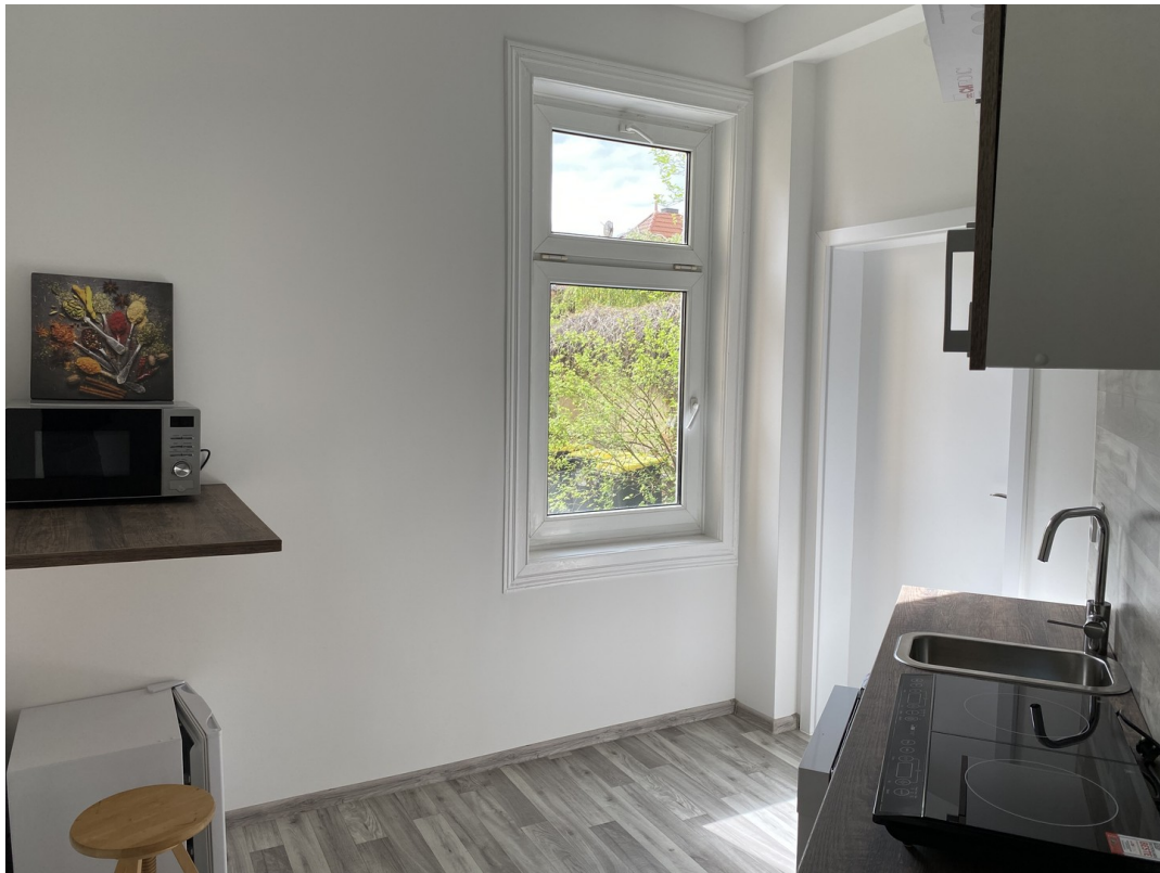
Küche Kühlschrank Mikrowelle..