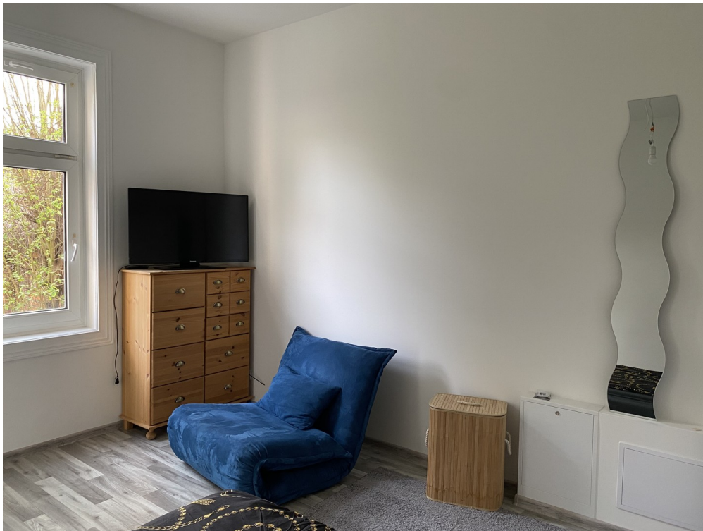
TV und Sessel mit Schlaffunkt.