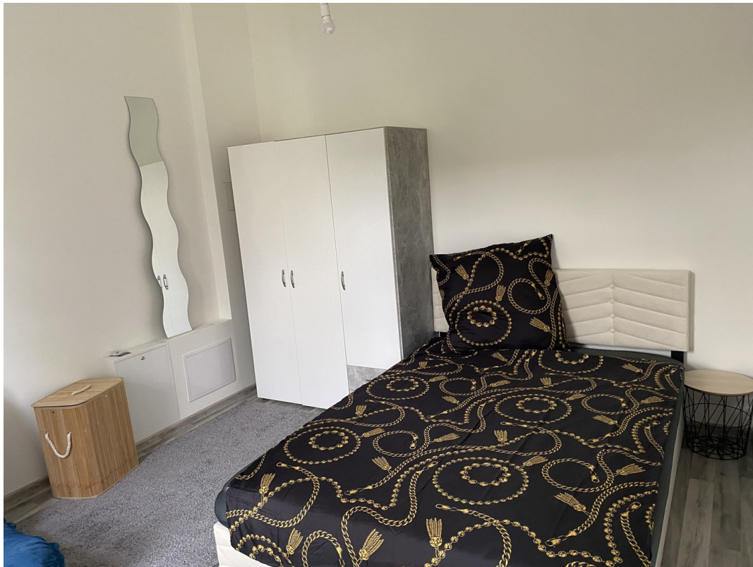
Bett mit Kleiderschrank