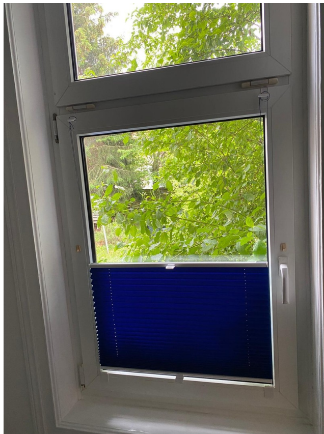
Plissee am Schlafzimmerfenster