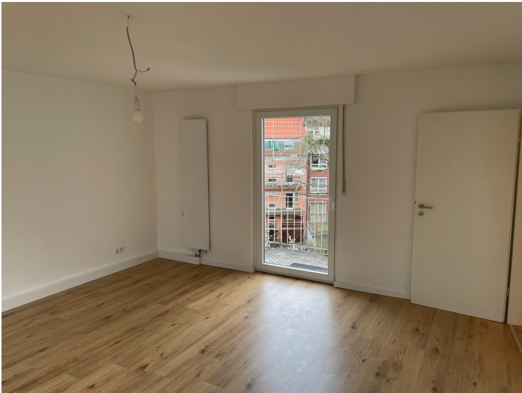
Wohnzimmer Blick Süd