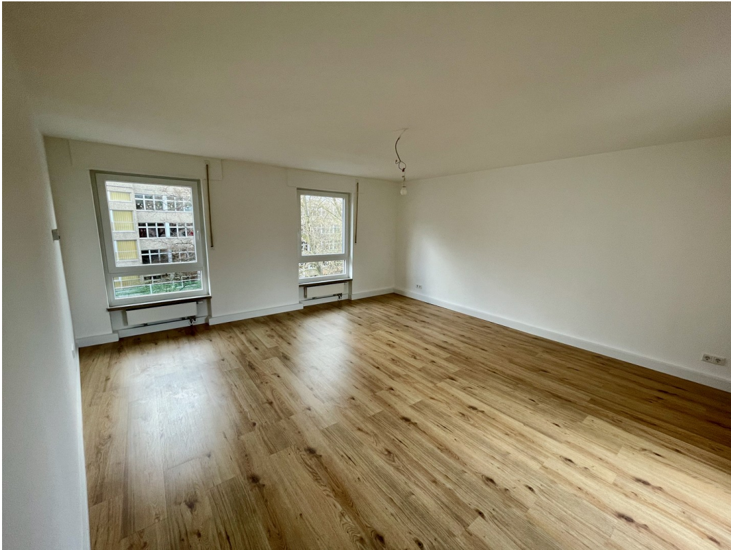
Wohnzimmer Blick Nord