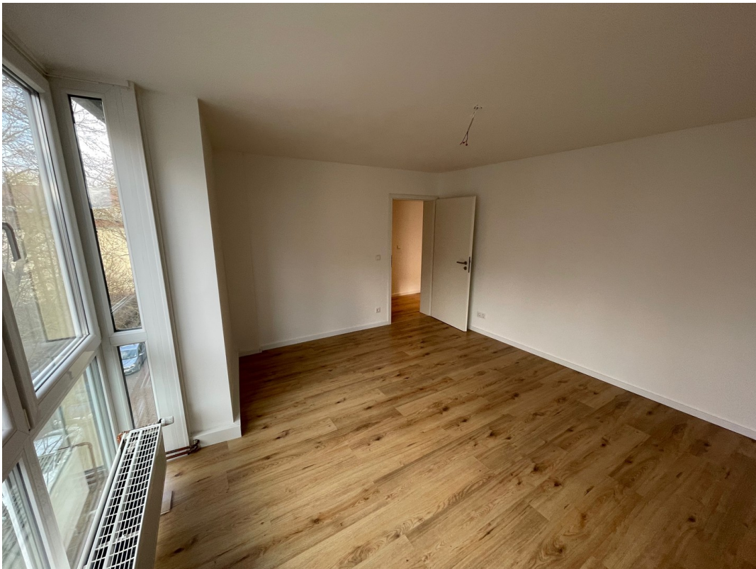
Arbeitszimmer mit Atrium