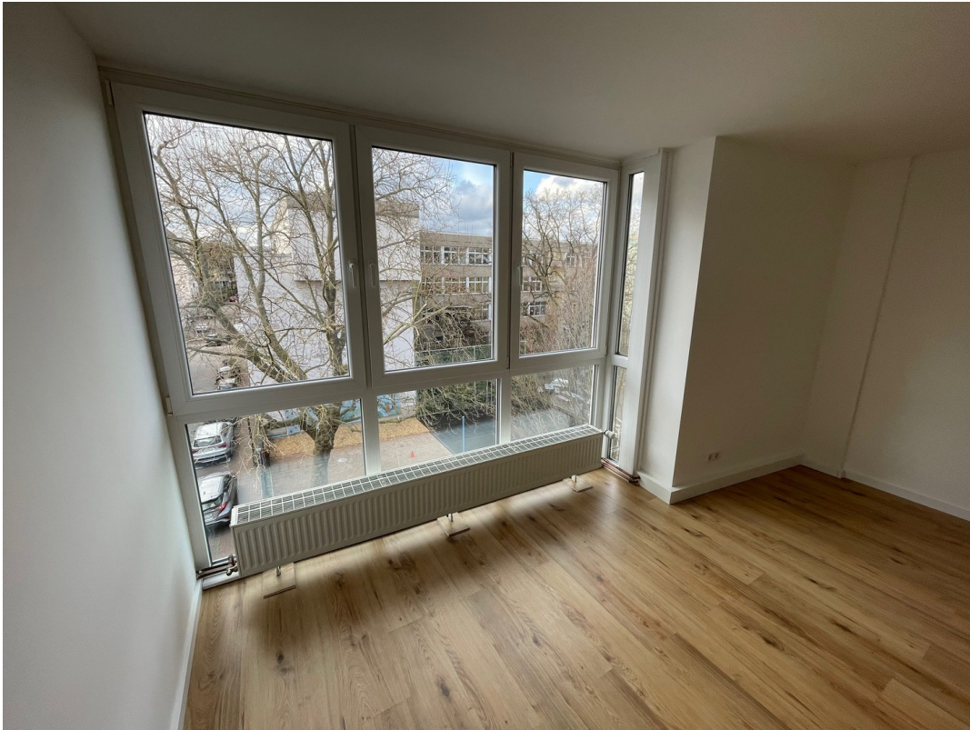
Arbeitszimmer mit Atrium