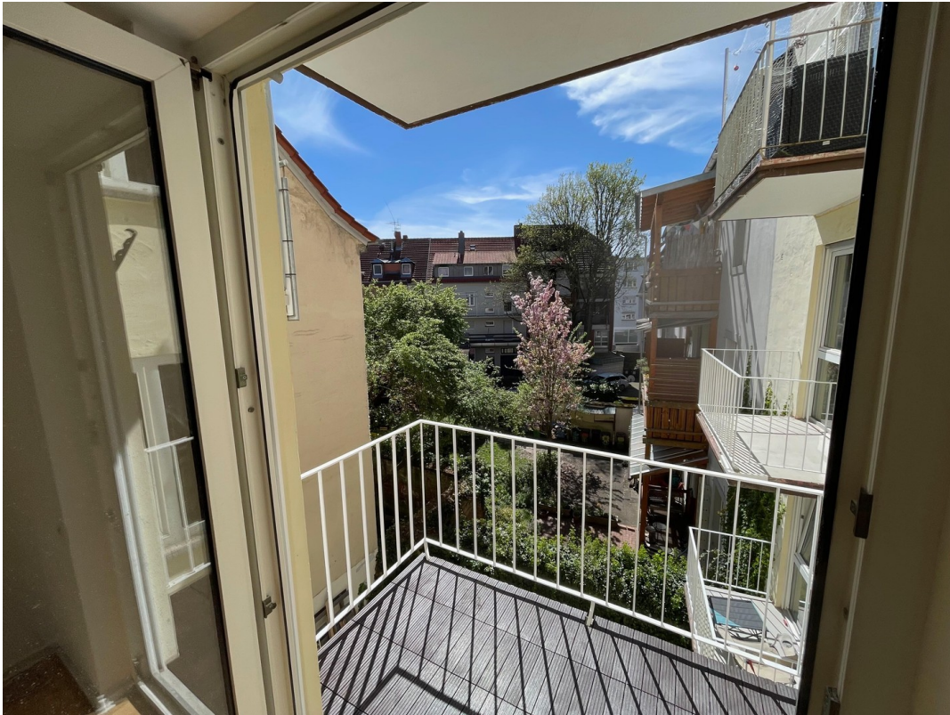
Südbalkon grüner Innenhof