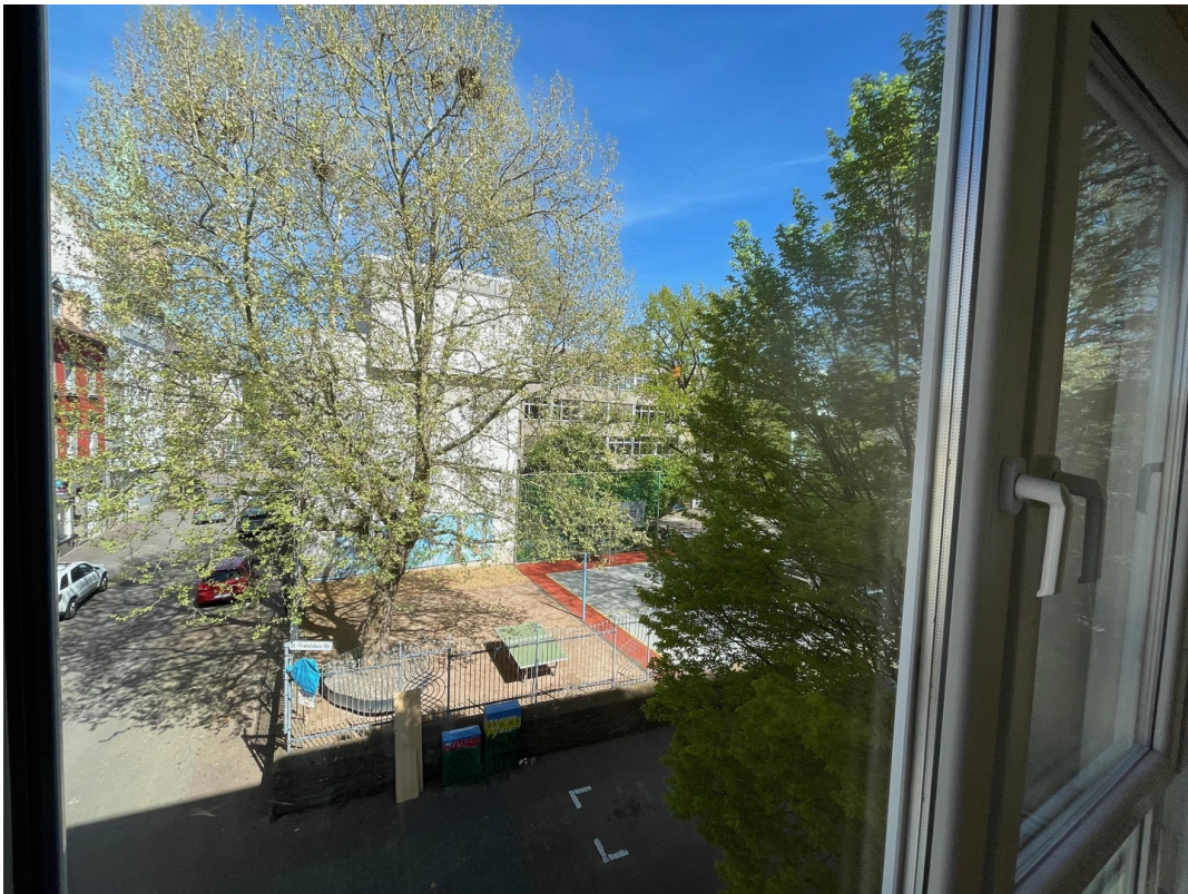
Blick Nord (Gymnasium)