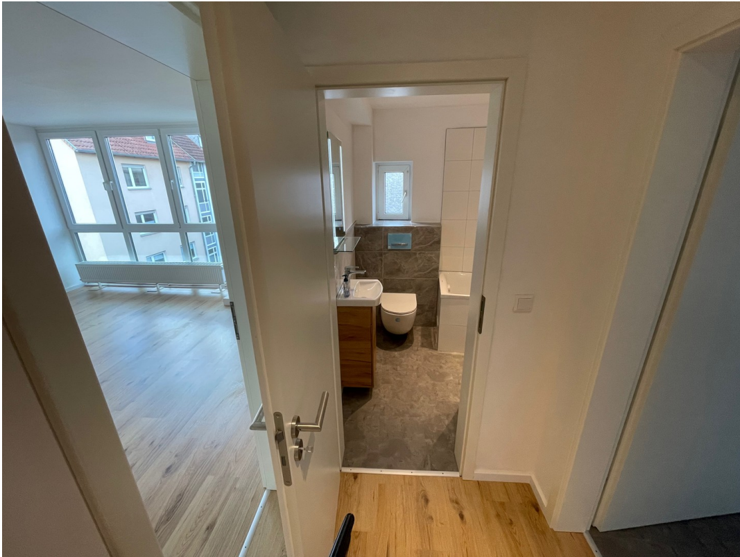
Diele zu Bad & Küche