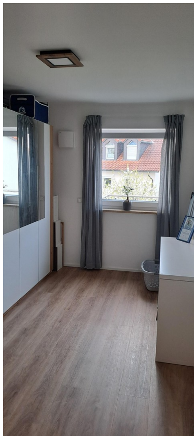
Büro / Kinderzimmer