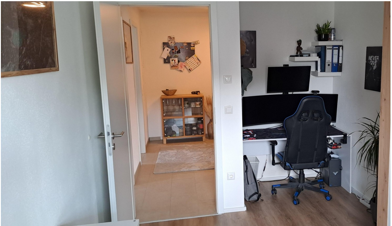
Büro / Kinderzimmer