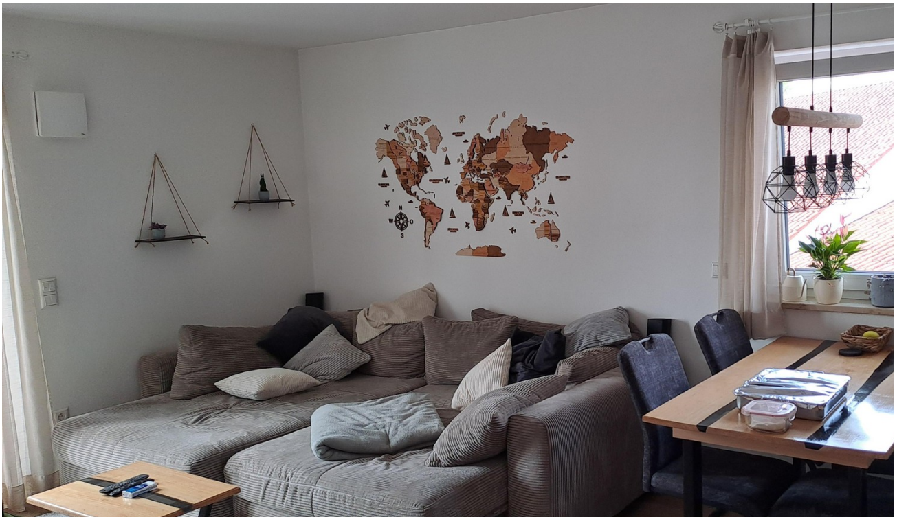
Wohnbereich mit offener Küche