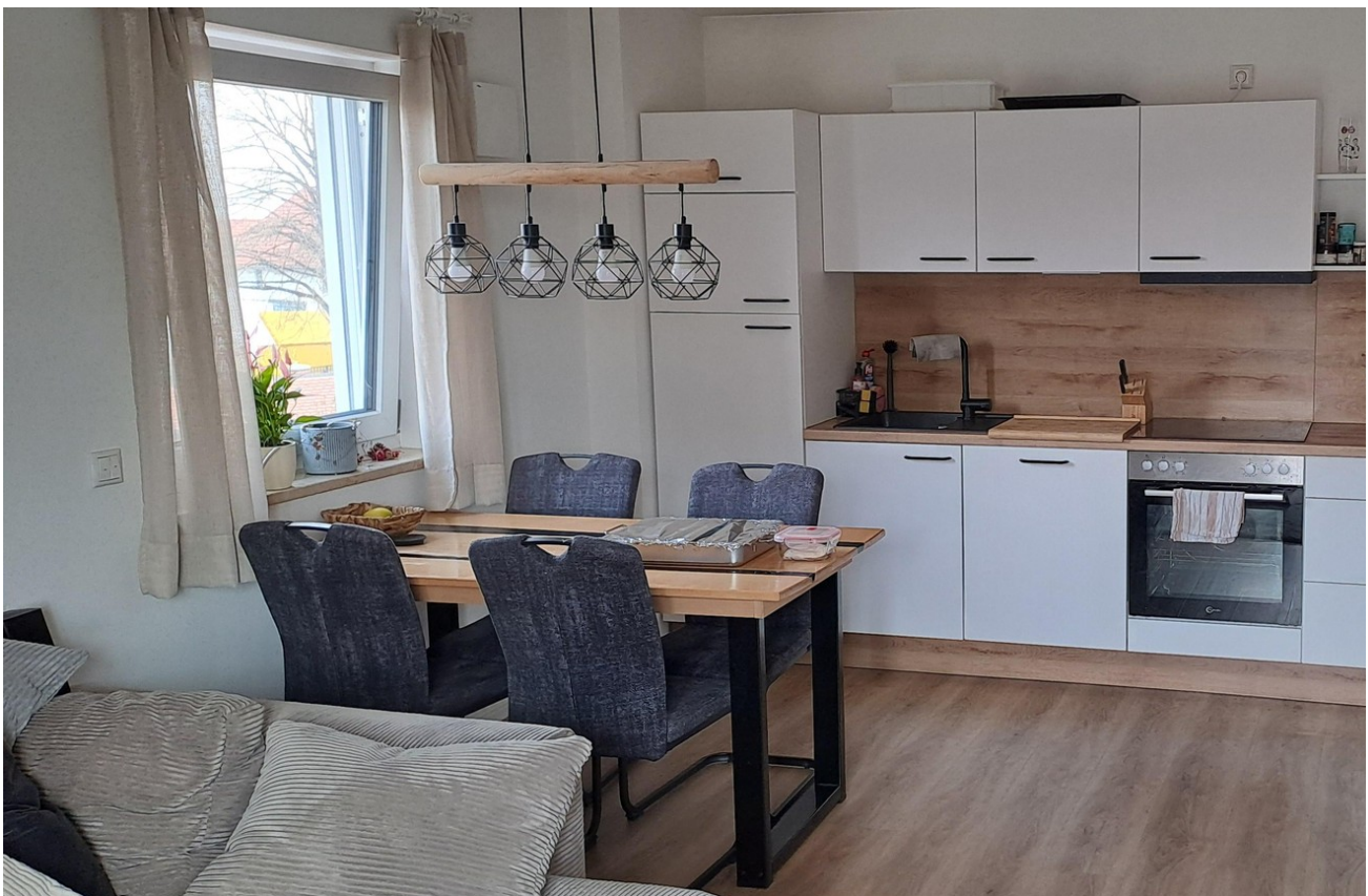
Wohnbereich mit offener Küche