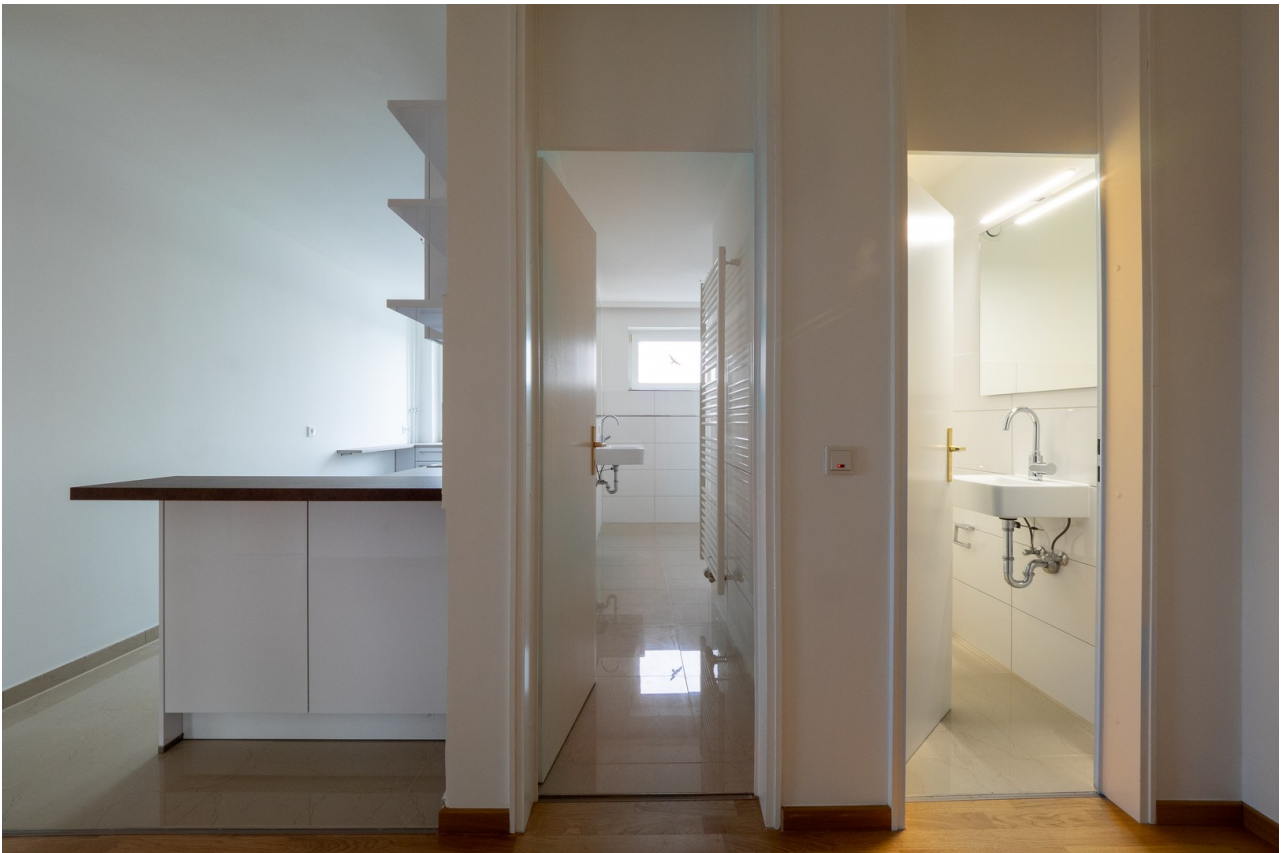
Blick auf Bad und WC