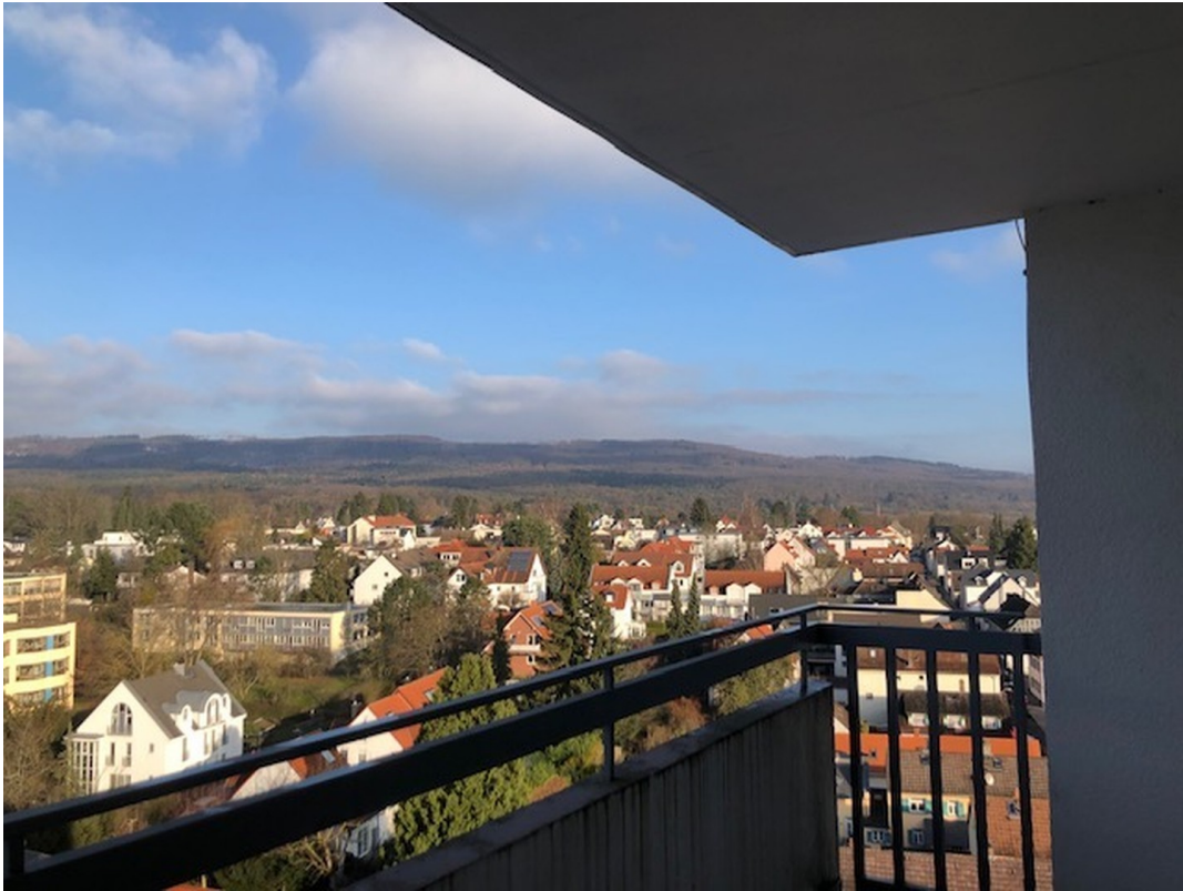
Balkon mit Blick zum Herzberg