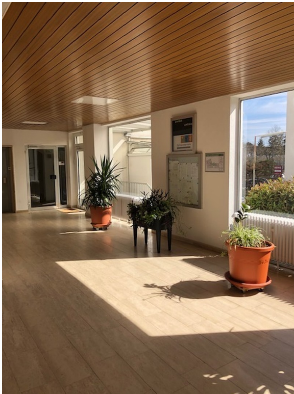
Eingangsbereich des Hauses