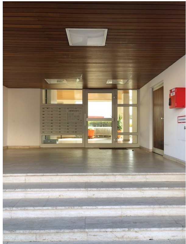
Eingang des Hauses