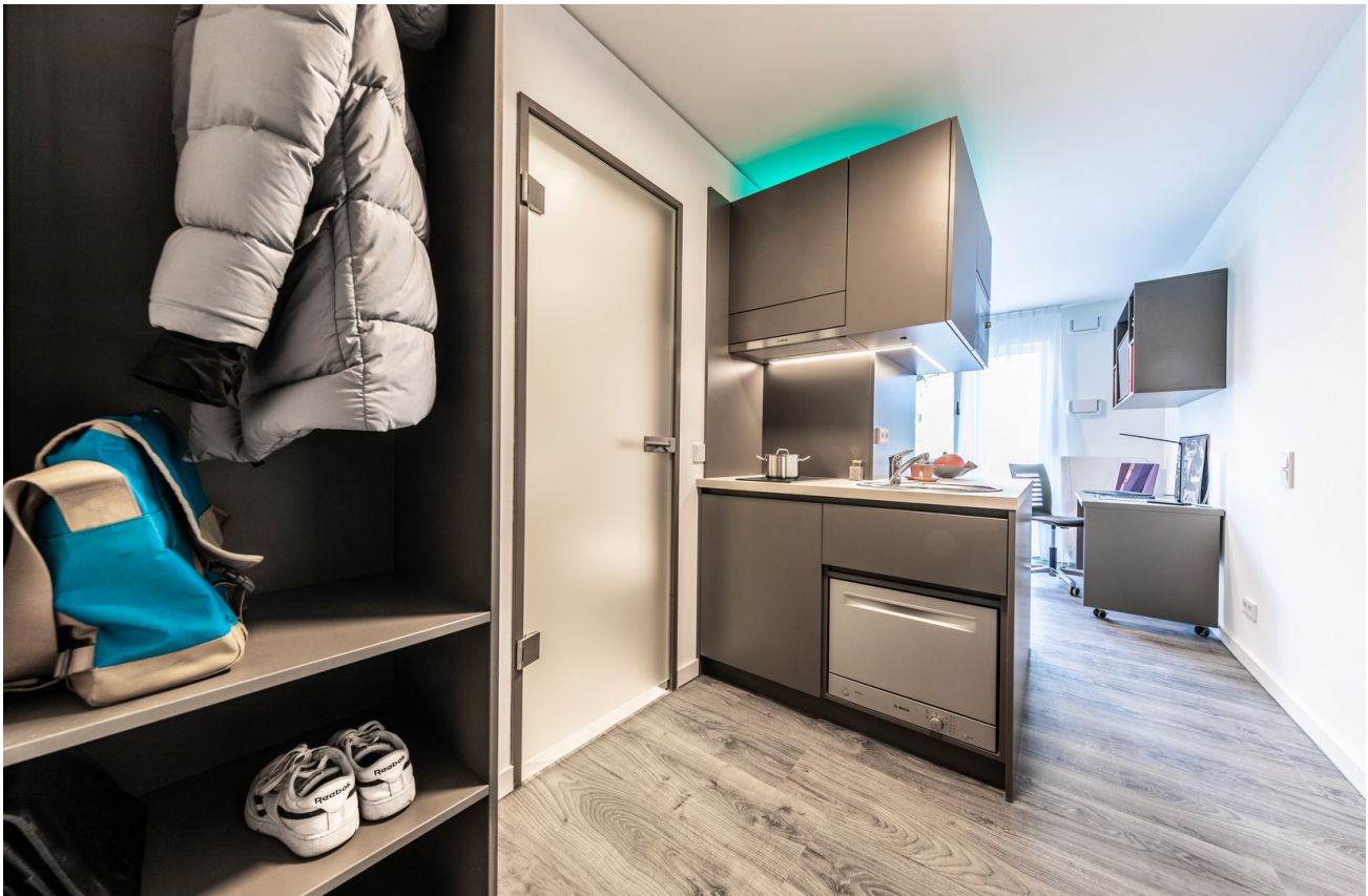
Eingangsbereich und Küche