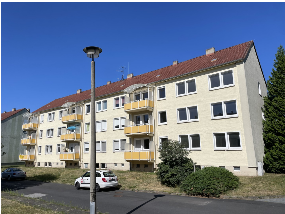
Außenansicht des Hauses