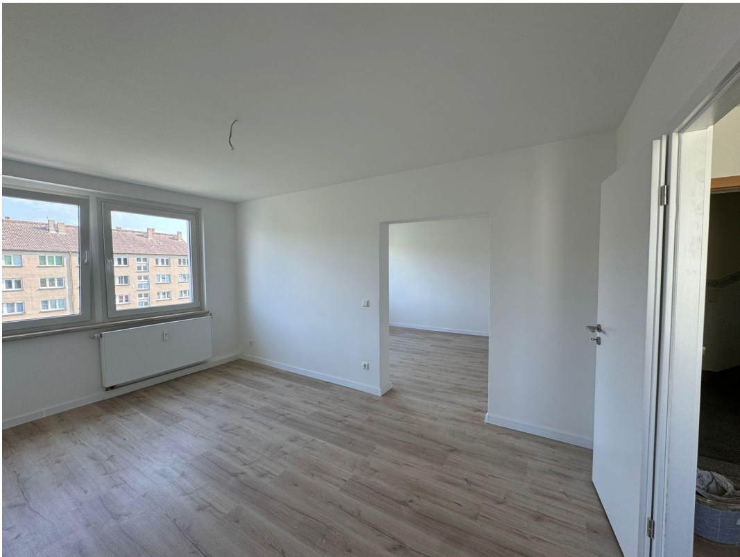
Blick von Küche ins Wohnzimmer