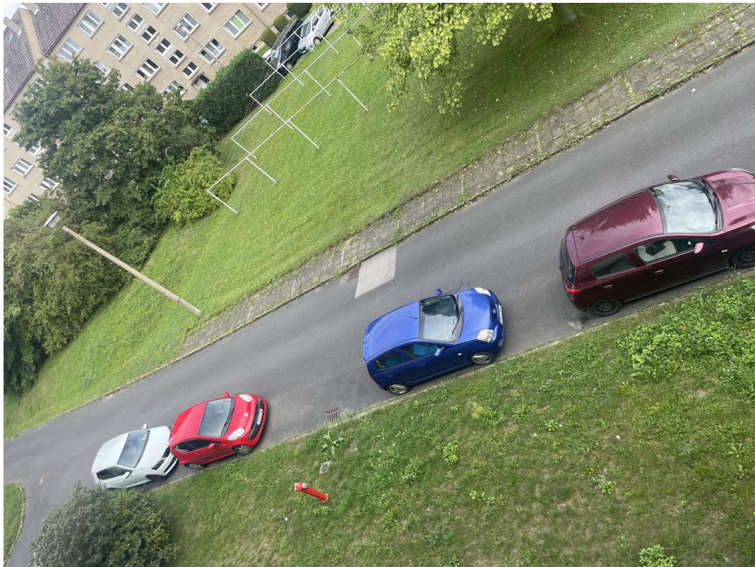
Parkplätze vor der Tür