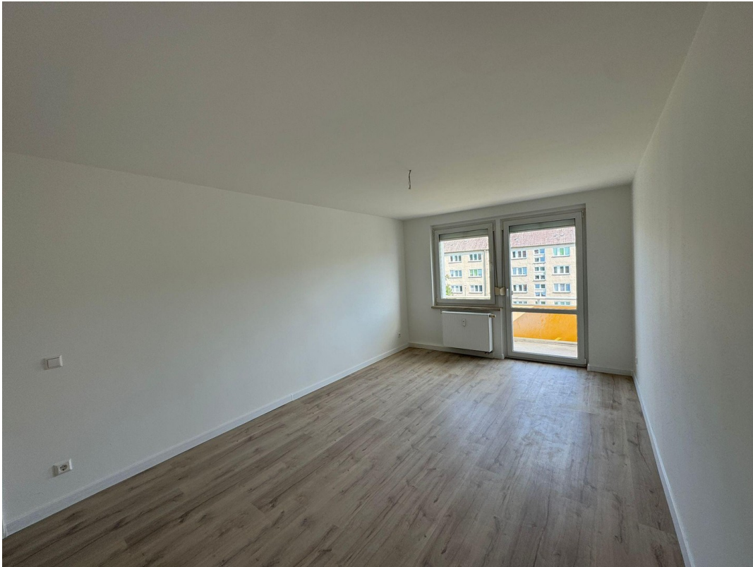
Schlafzimmer mit Balkonzugang