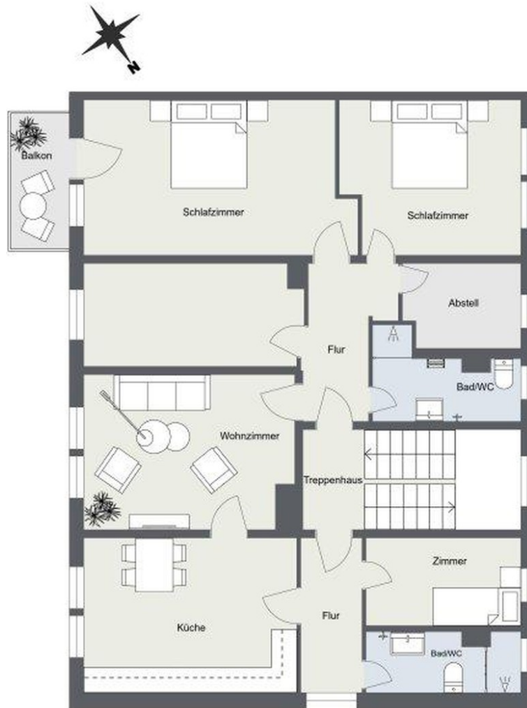
Grundriss der Wohnung