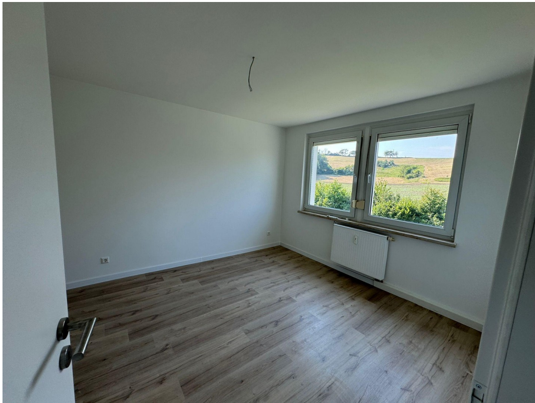
Zimmer zum Feld