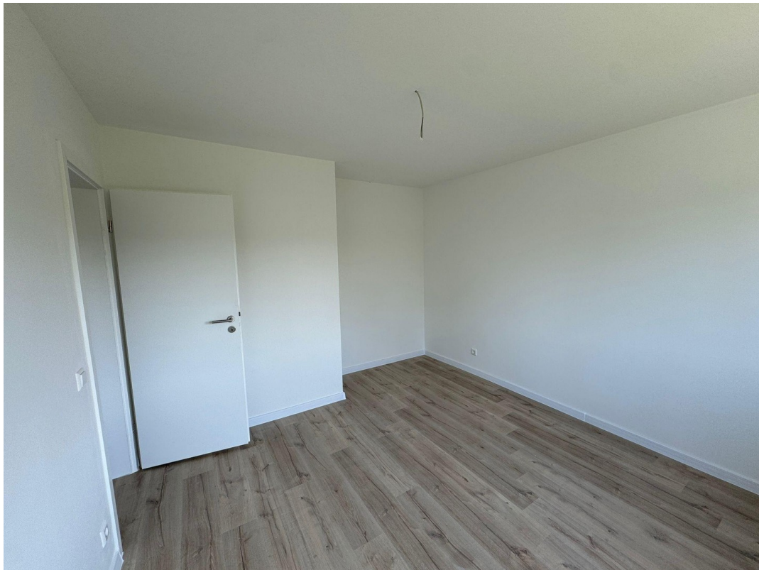
Zimmer zum Feld