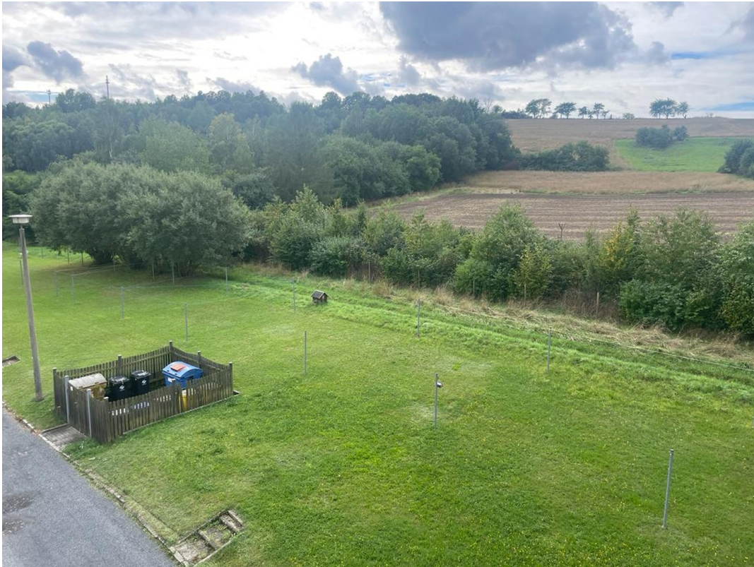
Ausblick, mit Wäscheplatz