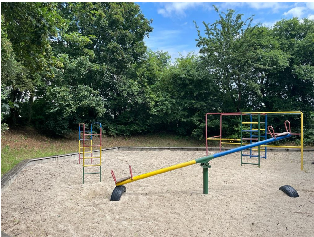
Spielplatz vor dem Haus