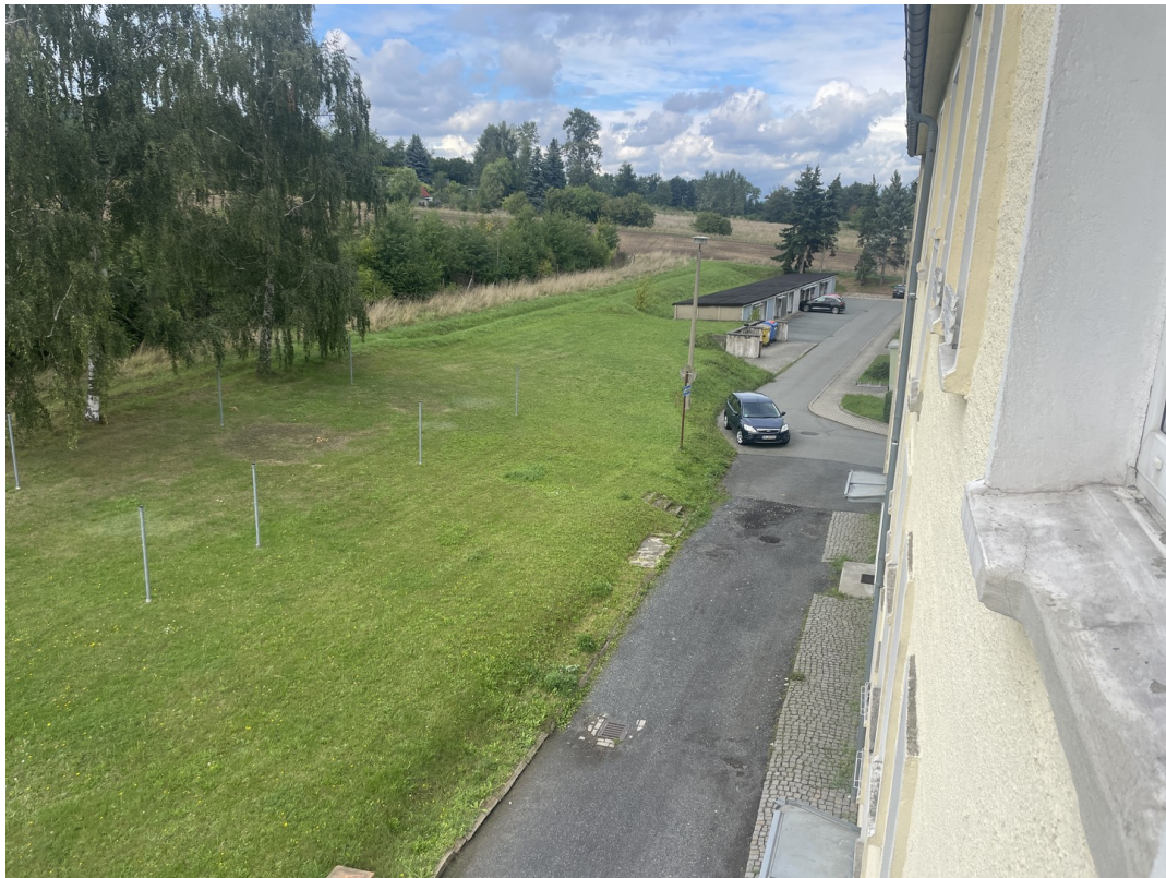
Zuwegung zu den Eingängen