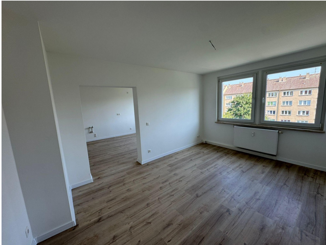
Blick vom Wohnzimmer zur Küche