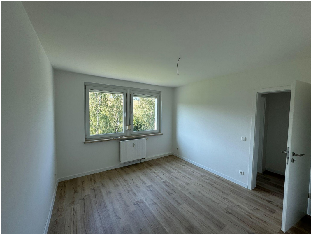
Zimmer zum Feld