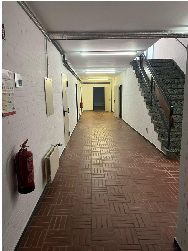
Flur im UG