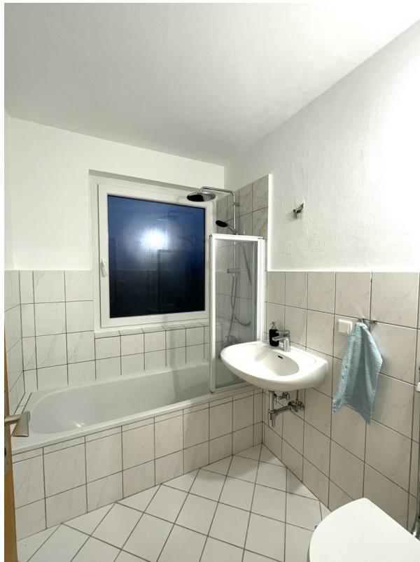
Bad mit Regendusche