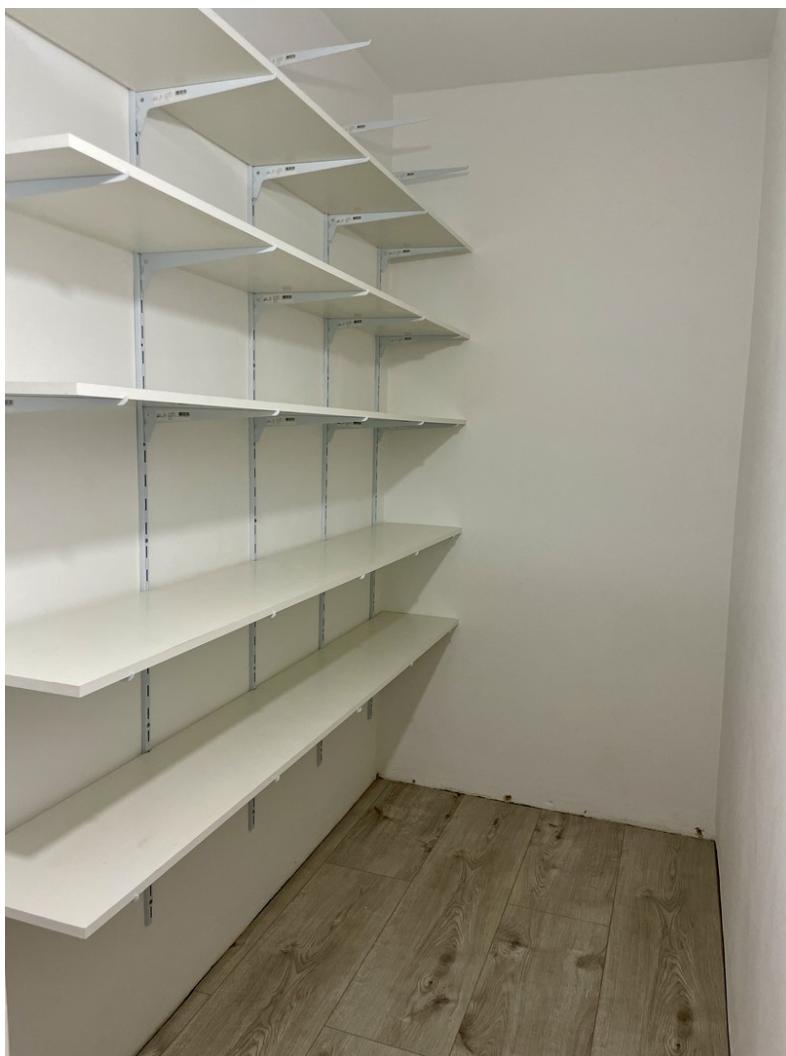
Abstellkammer mit Regalsystem