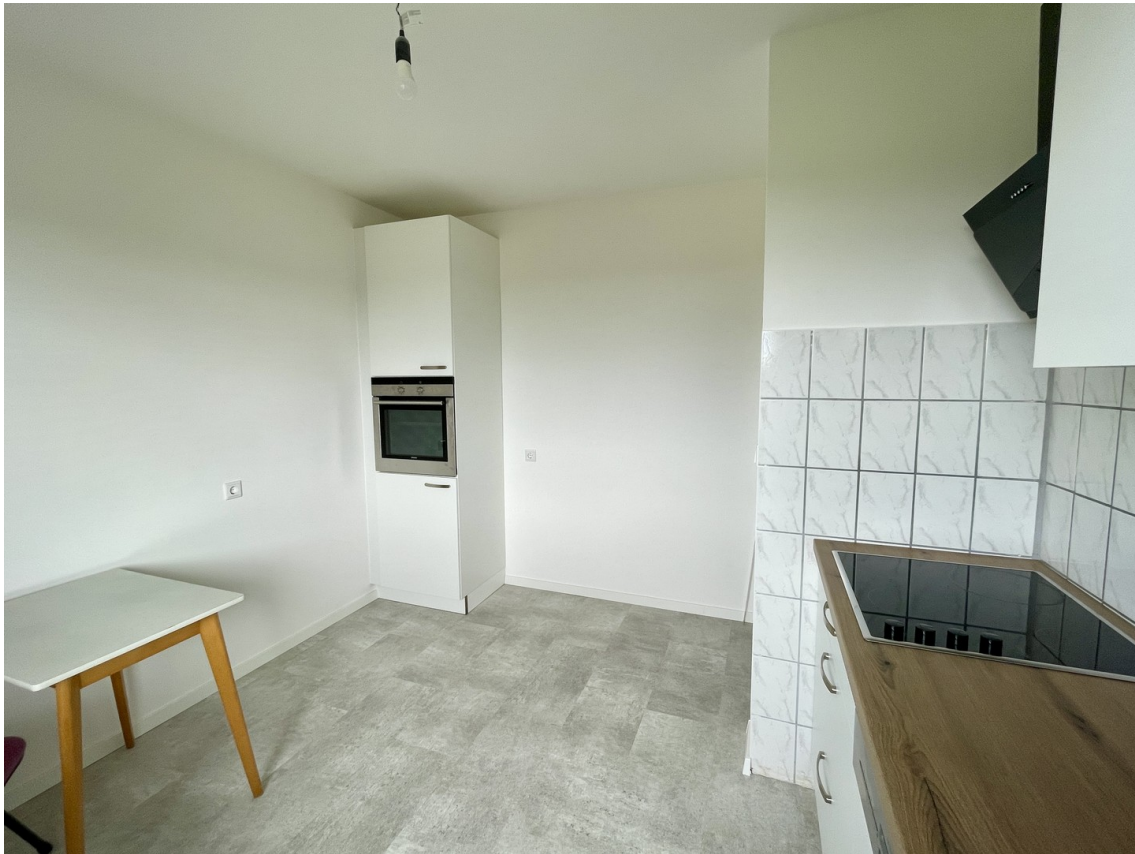
Backofen auf bequemer Höhe