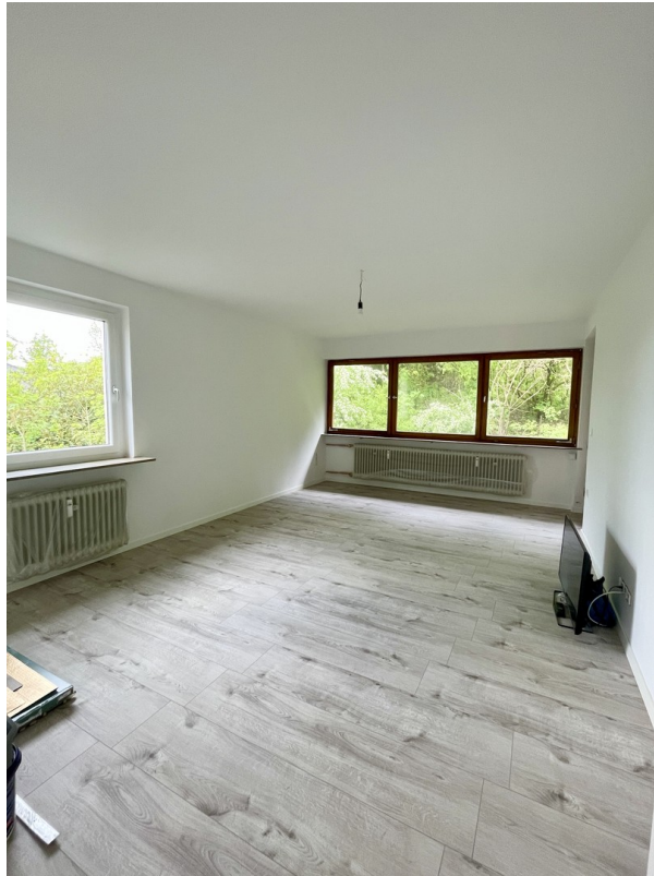
Wohnzimmer mit Blick ins Grüne