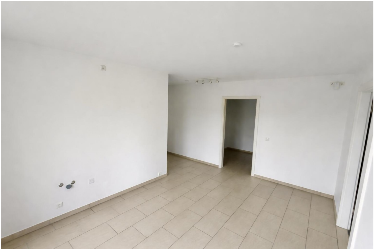
OG Vorbereitung 2. Küche