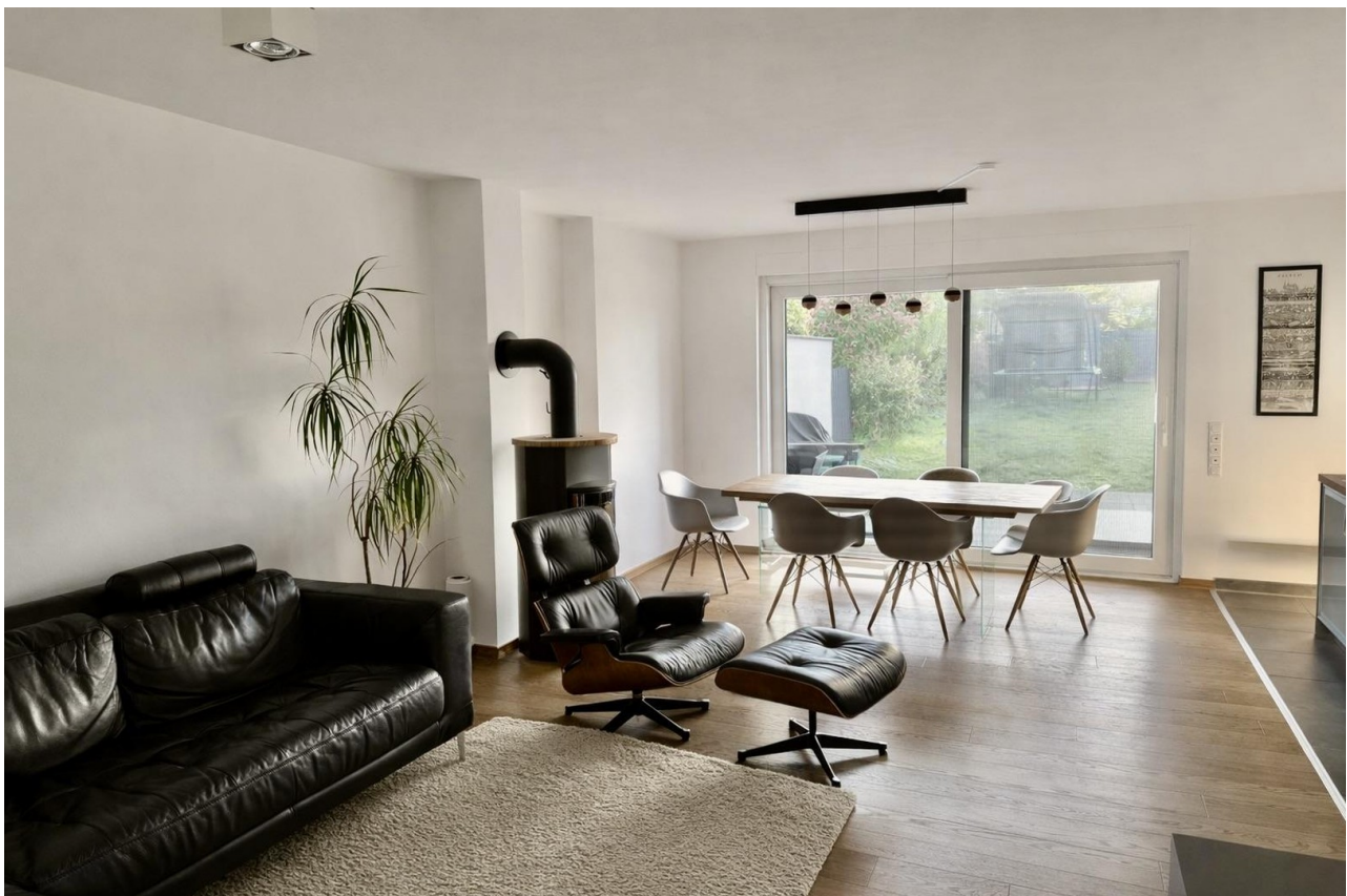
EG Wohn-, Essbereich