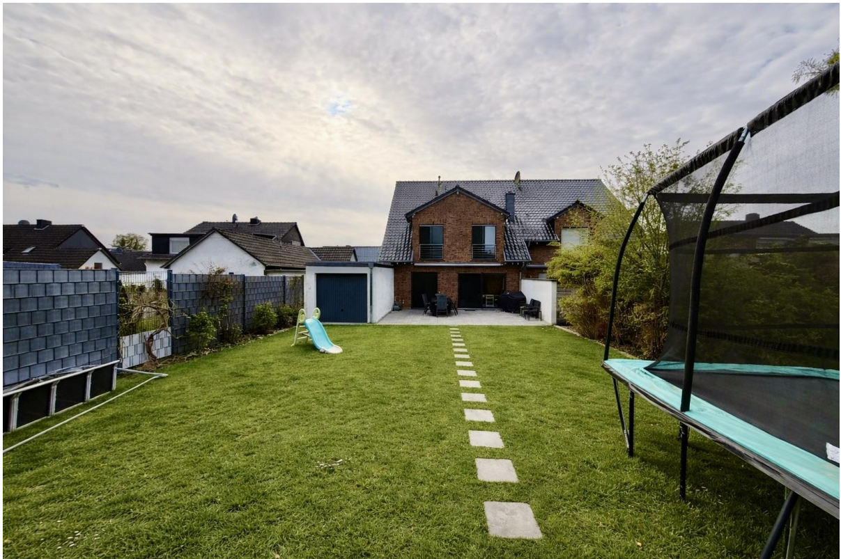
Garten (Blick zum Haus)