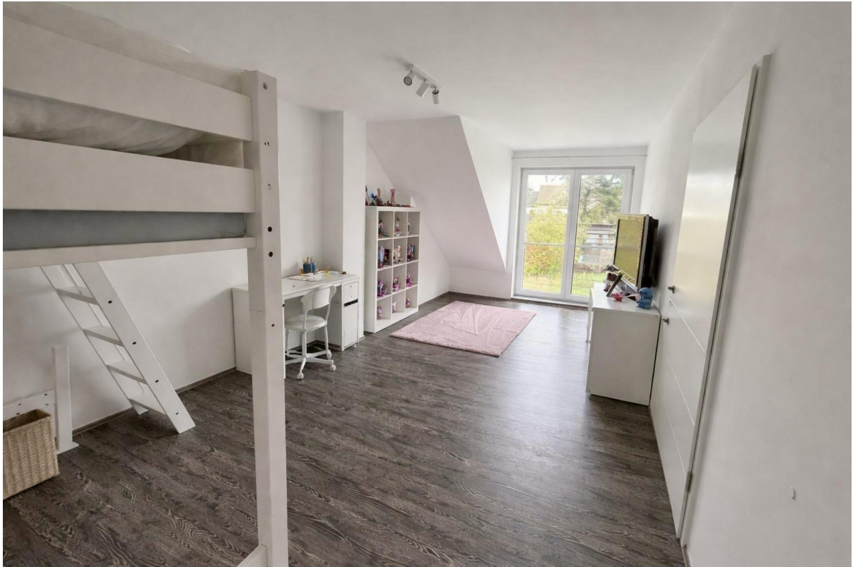
OG Zimmer 3