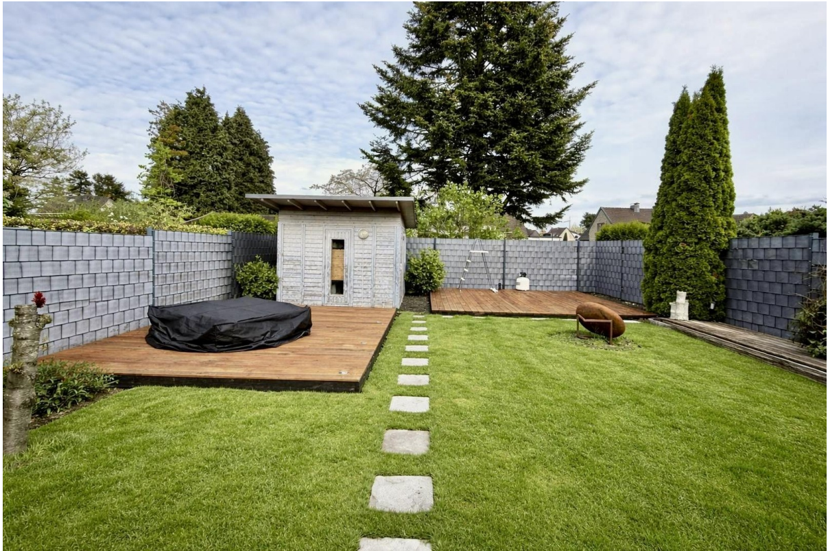
Garten hinten mit Sauna