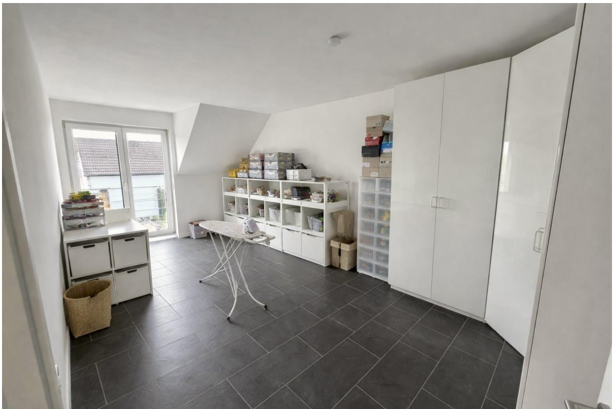
OG Zimmer 2