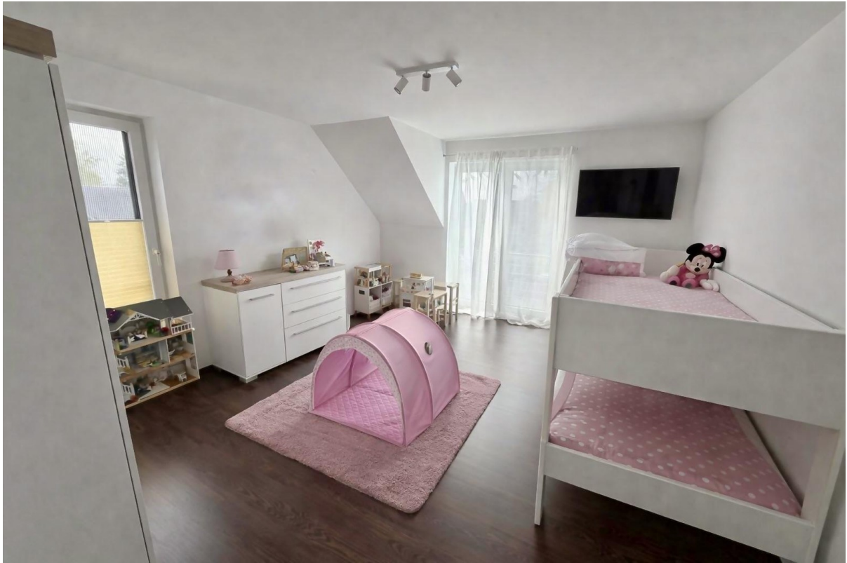
OG Zimmer 1