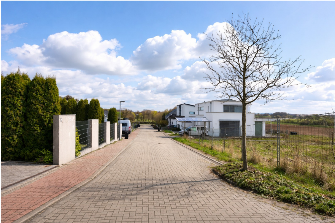
Gepflegte Wohnlage mit Niveau