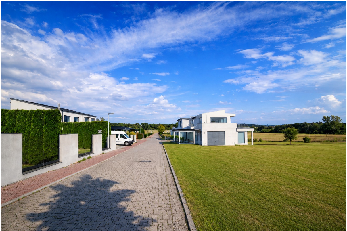
Premiumlage am Feldrand