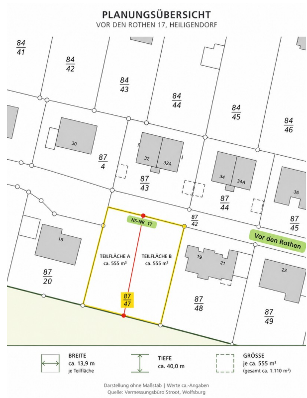
2 Grundstücke à ca. 555 m 2