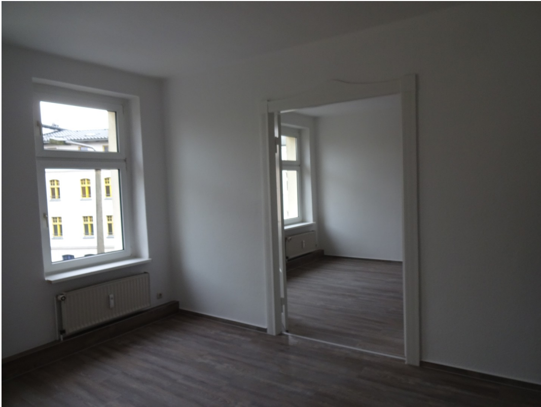
Zimmer mit Verbindungstür