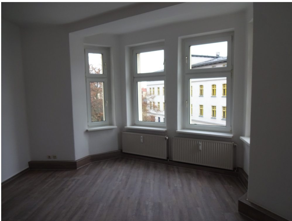
Wohnraum mit Erker