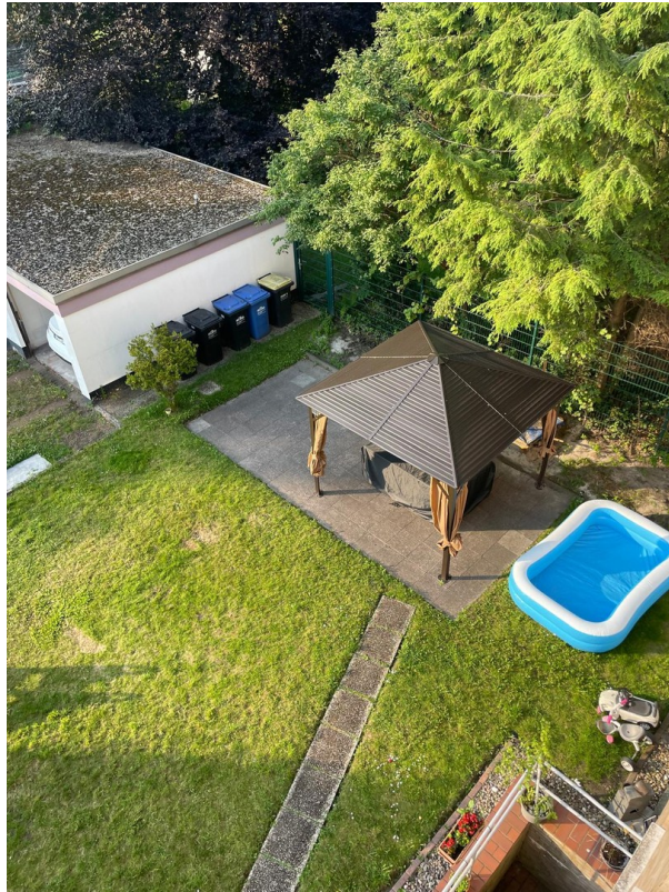
Balkonblick auf den Garten