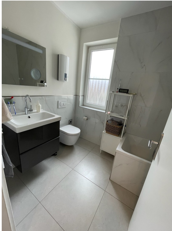
Badezimmer mit Dusche, Wanne