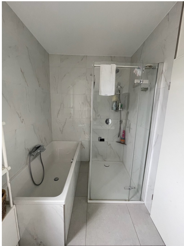
Badezimmer mit Dusche, Wanne