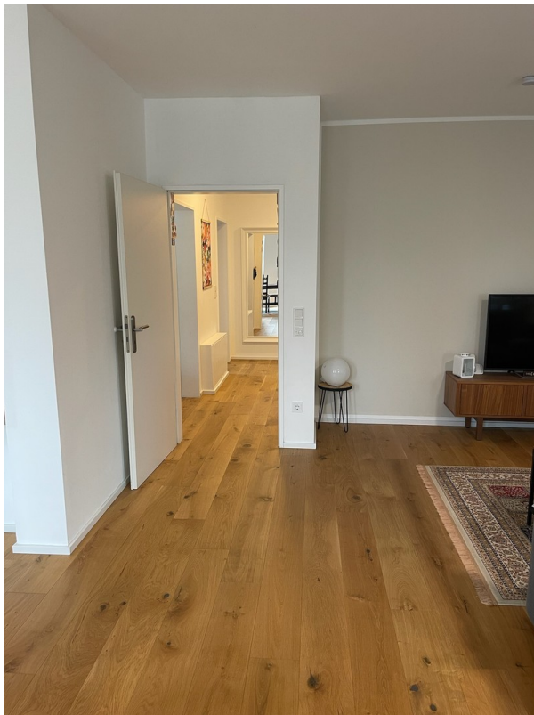
Wohnzimmer Blick Flur