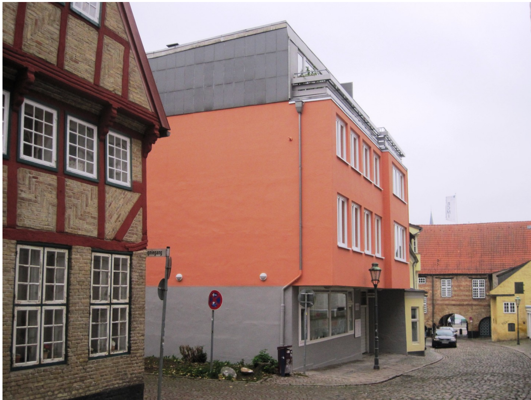
Westseite zur Große Straße