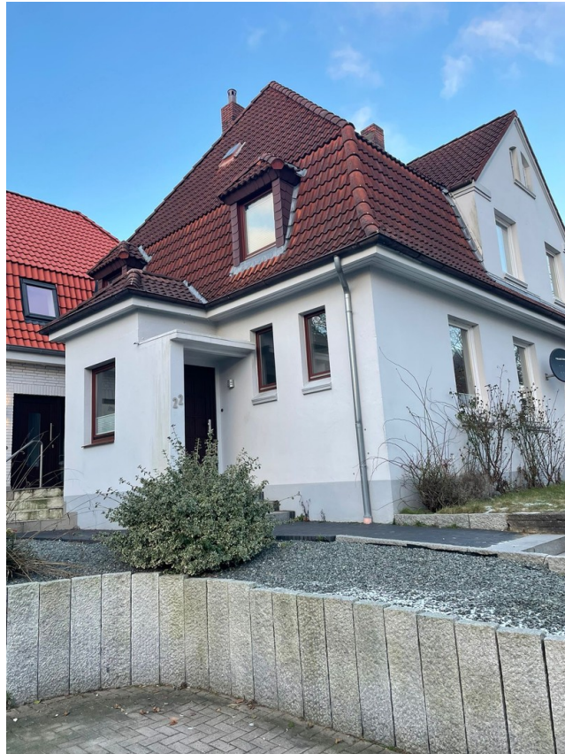
Alter Teil des Hauses, front