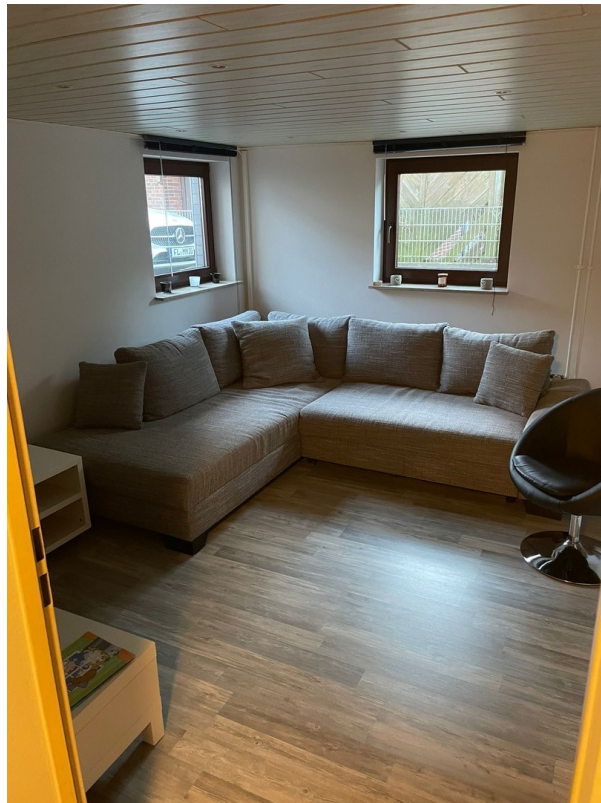
Gästezimmer Keller (neu)