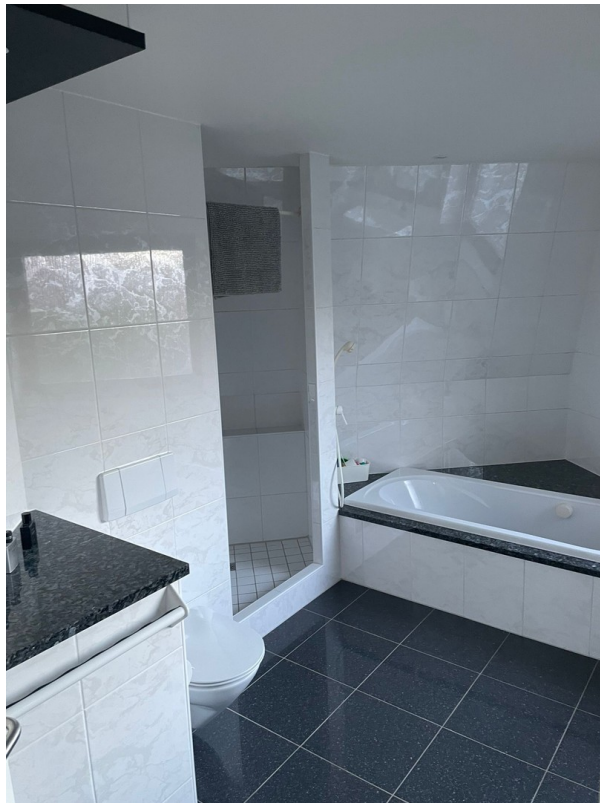
Vollbad 1. Obergeschoss (neu)