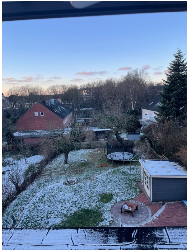
Aussicht Dachgeschoss (neu)