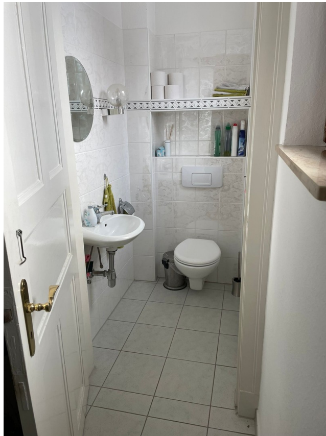
Gäste WC (alt)