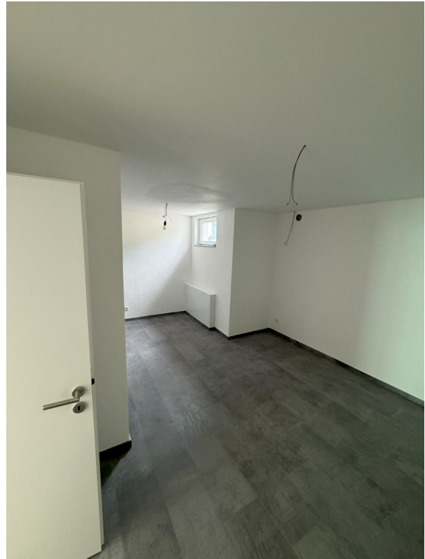
Wohnung 1 Küche