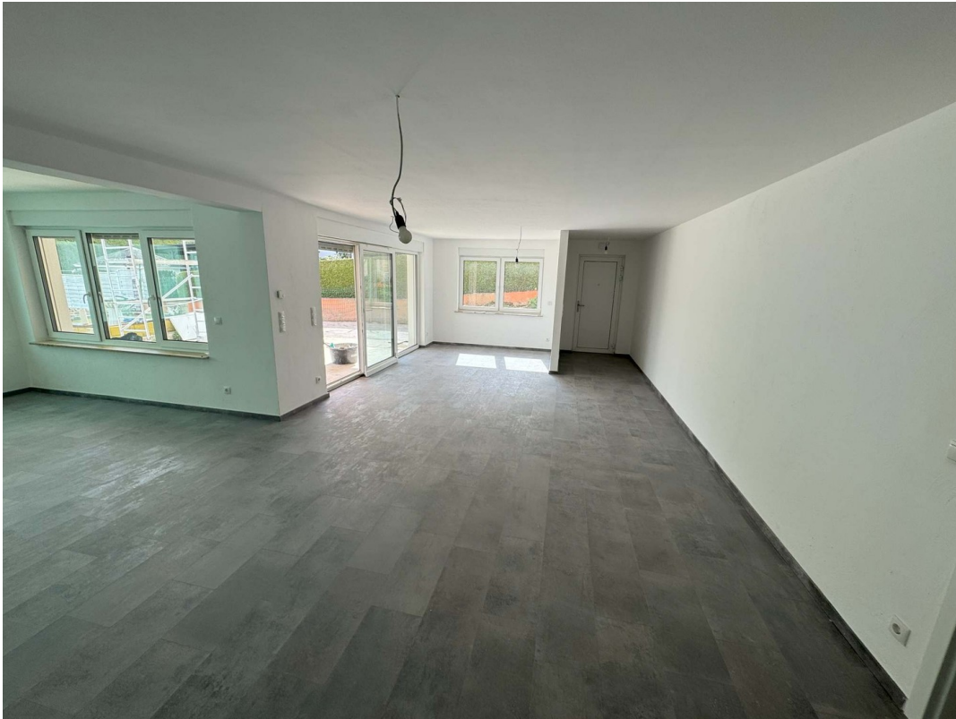
Wohnung 1 Wohn & Essbereich