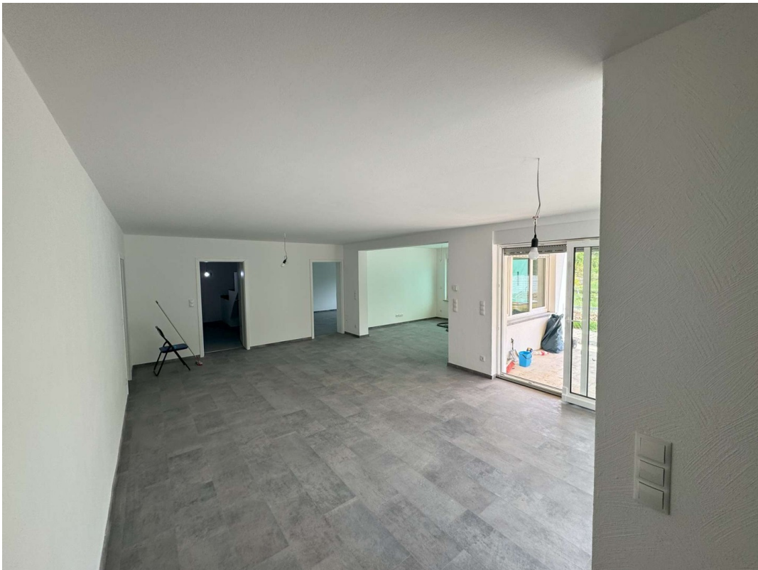
Wohnung 1 Wohn & Essbereich