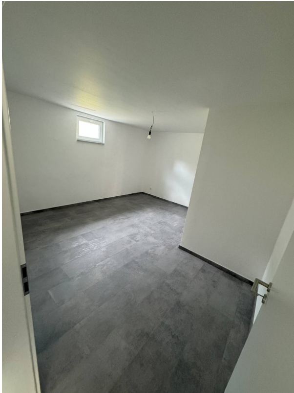
Wohnung 1 Kind