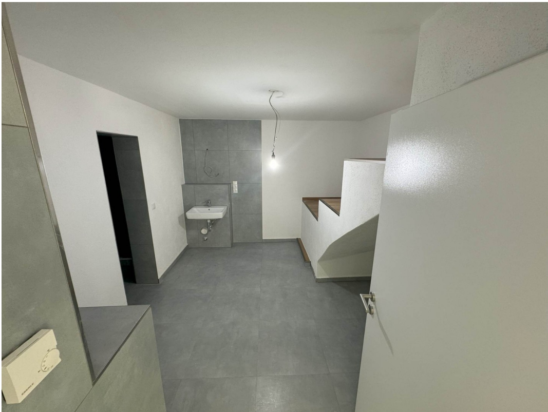
Wohnung 1 Bad