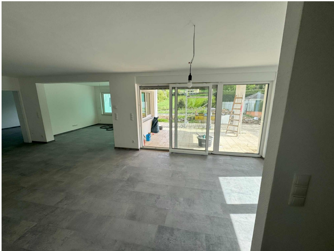
Wohnung 1 Wohn & Essbereich