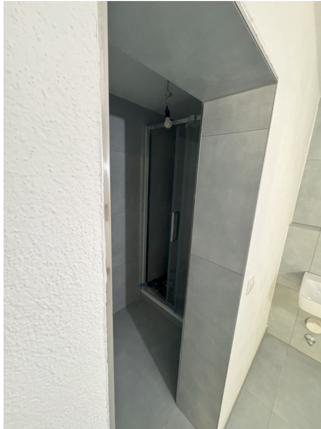
Wohnung 1 Bad