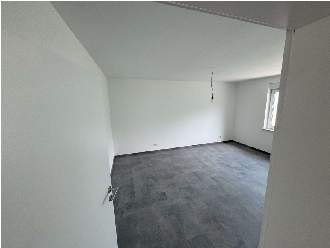
Wohnung 1 Schlafzimmer