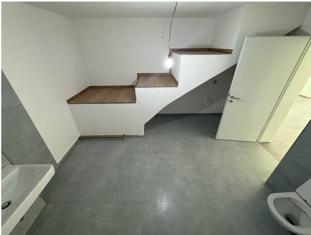
Wohnung 1 Bad