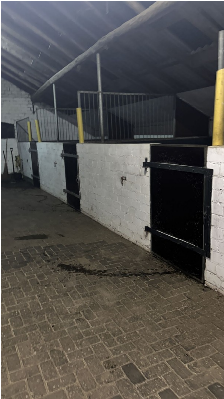
Teilansicht Boxen rechte Seite