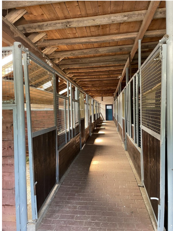
Pferdeboxen linke Seite