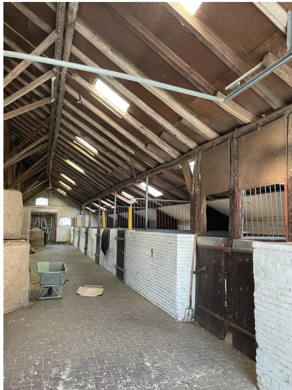
Pferdeboxen rechte Seite