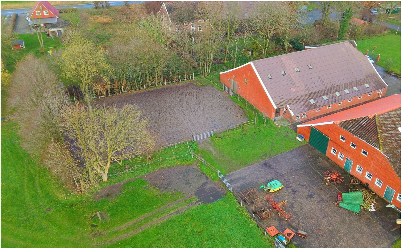
Paddock auf der Rückseite