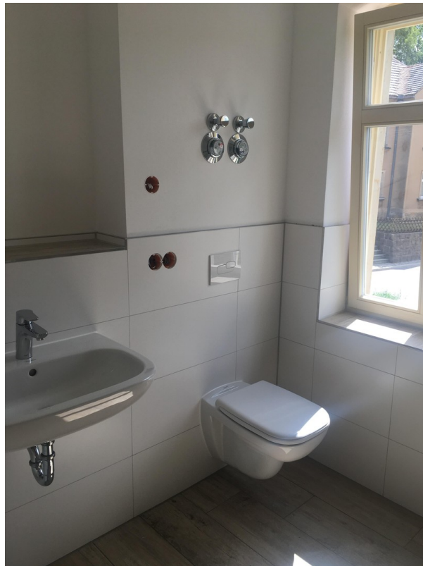
Badausstattung WC, Waschbecken