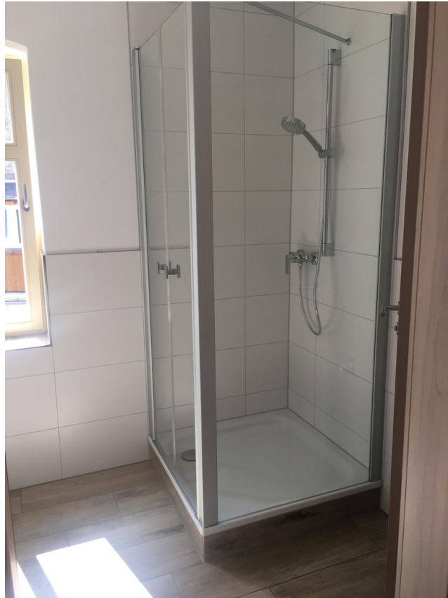
Dusche + Badewanne