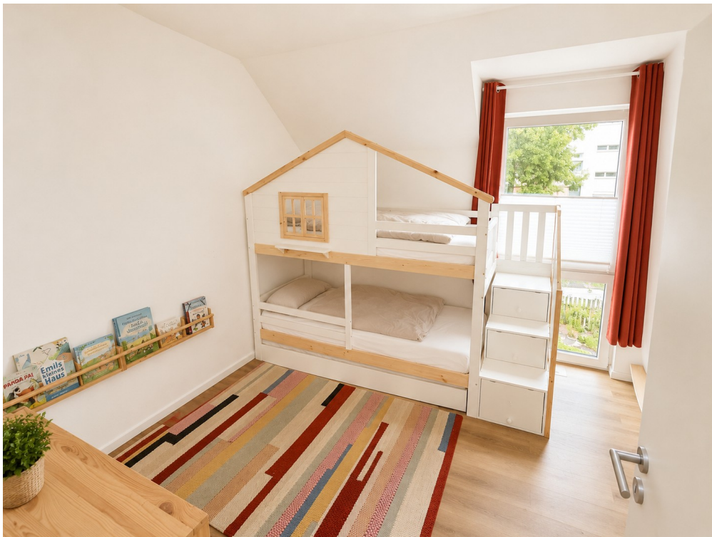
Kinderzimmer 1 OG