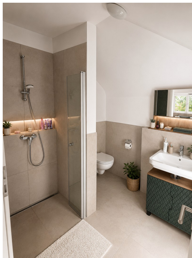
Vollbad 2 OG