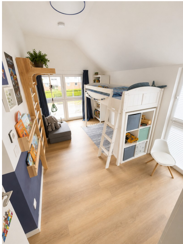
Kinderzimmer 2 OG