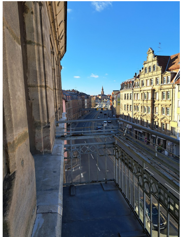
Blick vom Balkon Ri. Süd-West