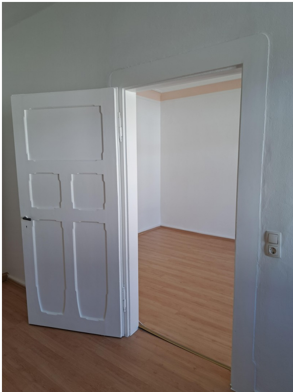
Blick aus Ki.-o Arbeitszi