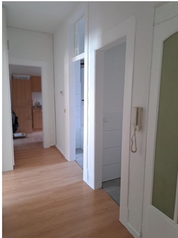
Diele Ri- Küche, re Whgtür