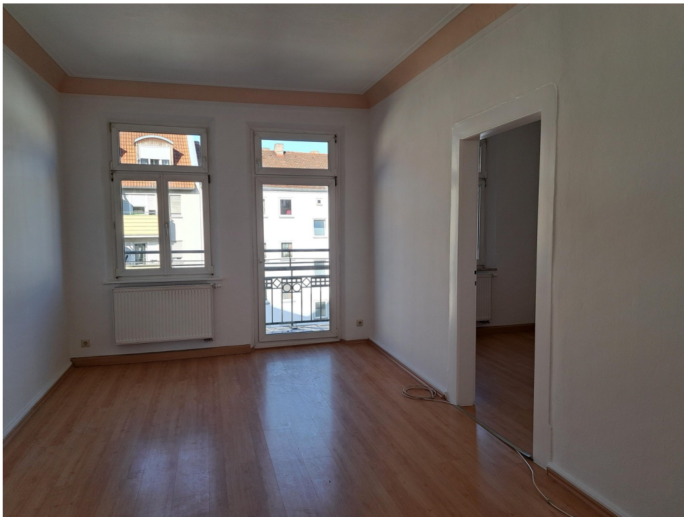
Wohn-Zi mit Zugang zum Balkon