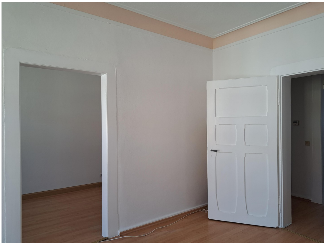
Blick vom Wohnzi