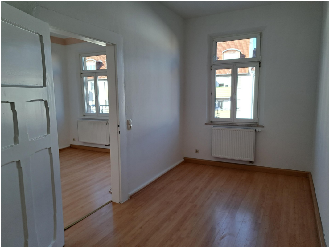
Kinder- o. Arbeitszimmer