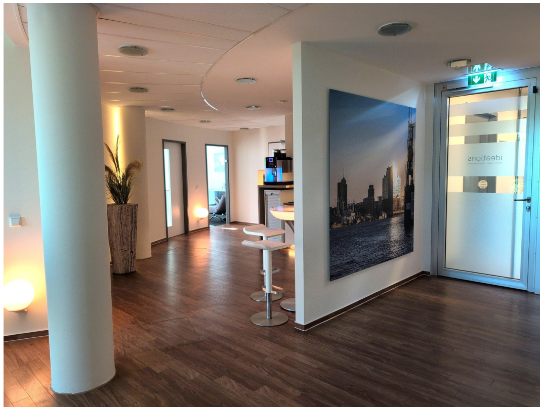
Eingang Blick rechts / Küche