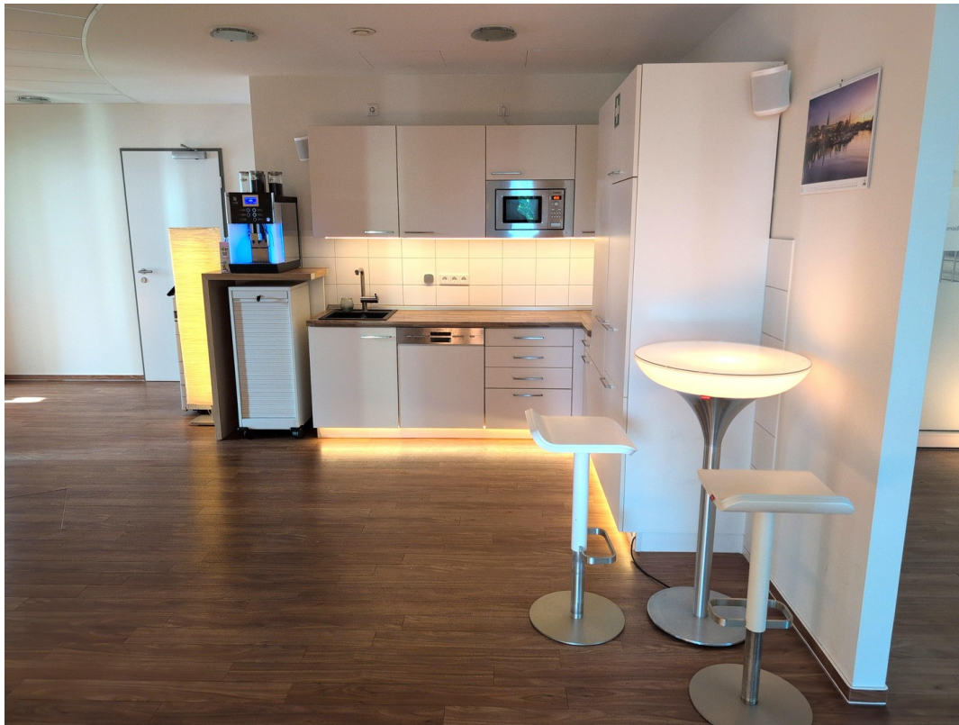
Küche mit Kaffeevollautomat