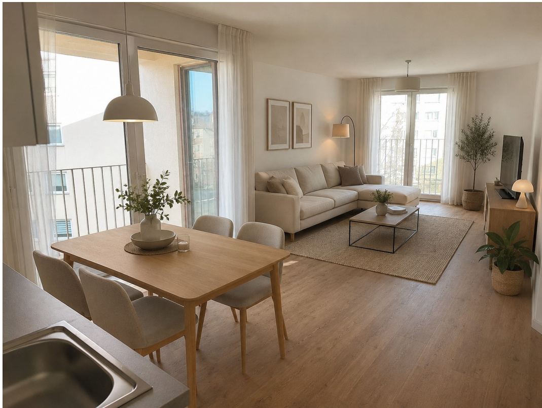
Wohn-Essbereich mit Möbel KI