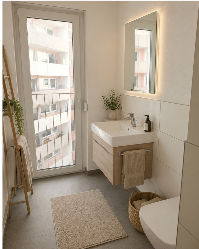
Badzimmer mit Möbel KI