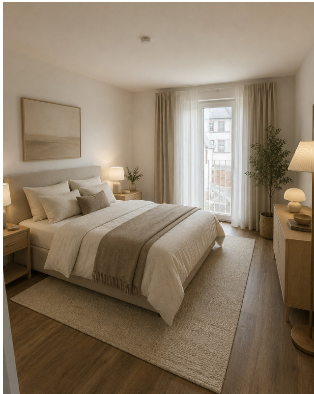
Schlafzimmer mit Möbel KI