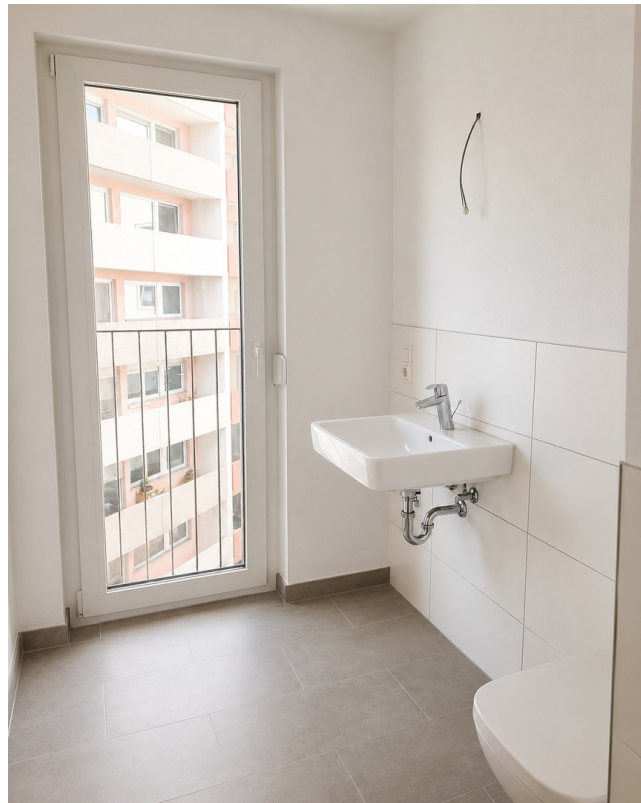
Badzimmer mit Duschplatz