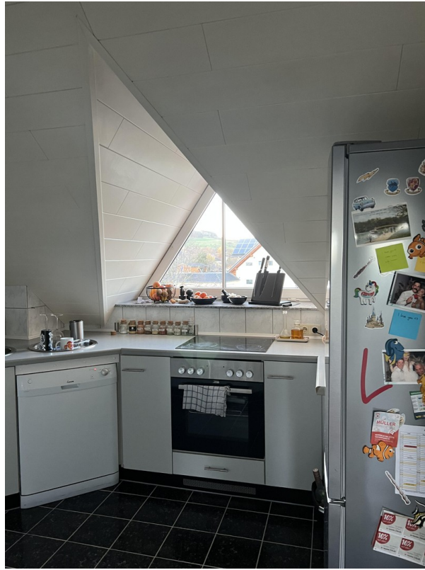
Küche - DG