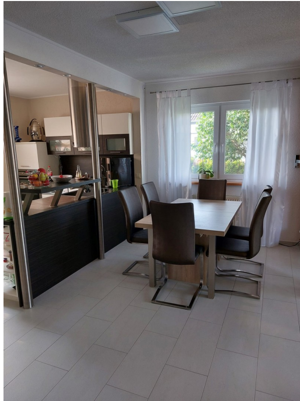
Essbereich - EG