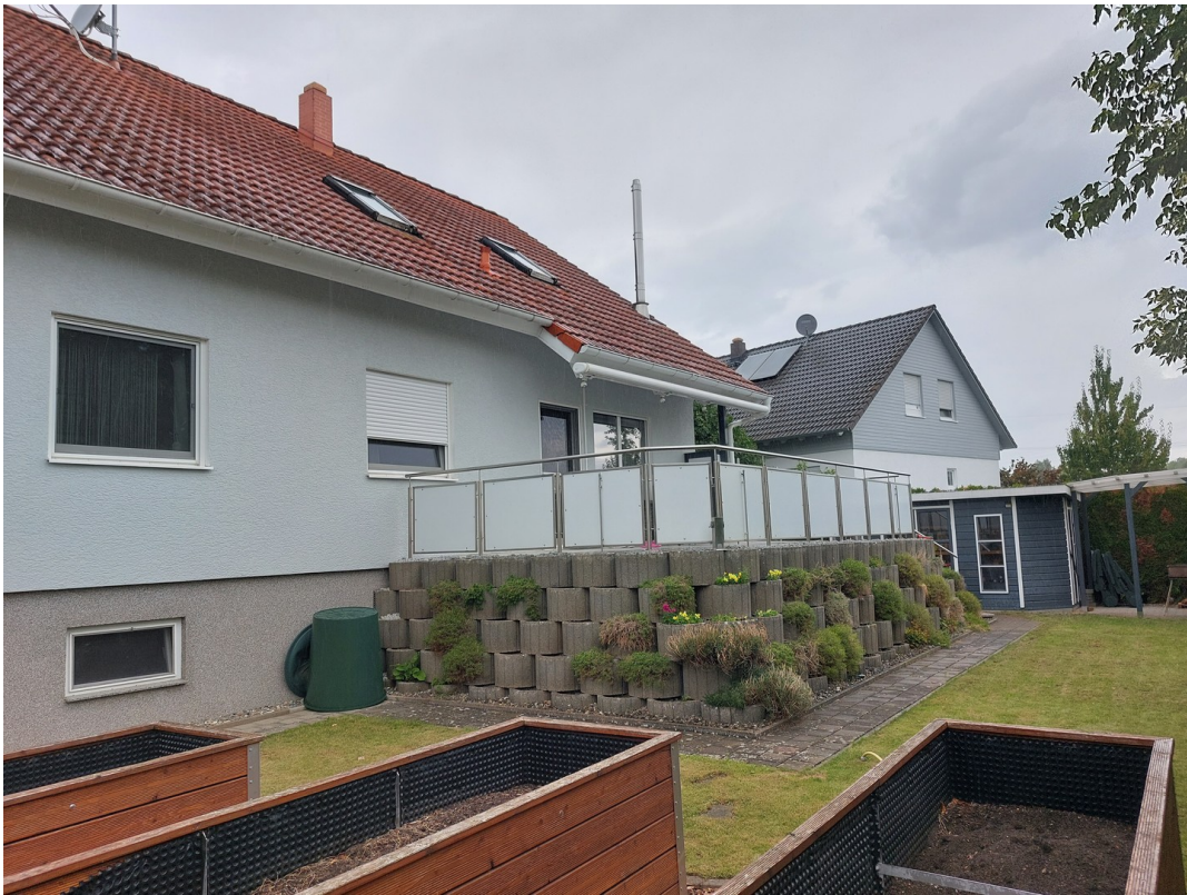
Haus von hinten