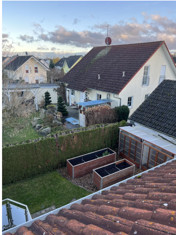
Blick aus dem Bad - DG