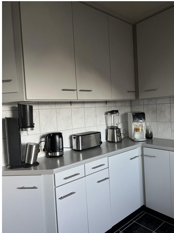
Einbauküche - DG