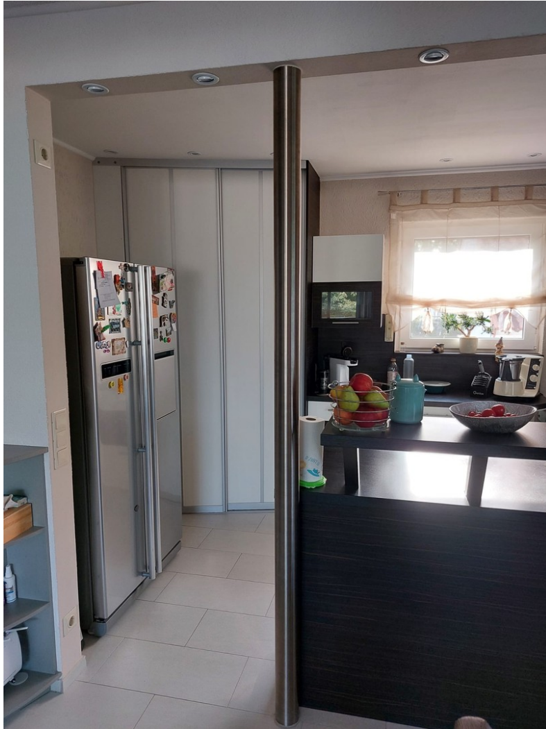
Küche - EG