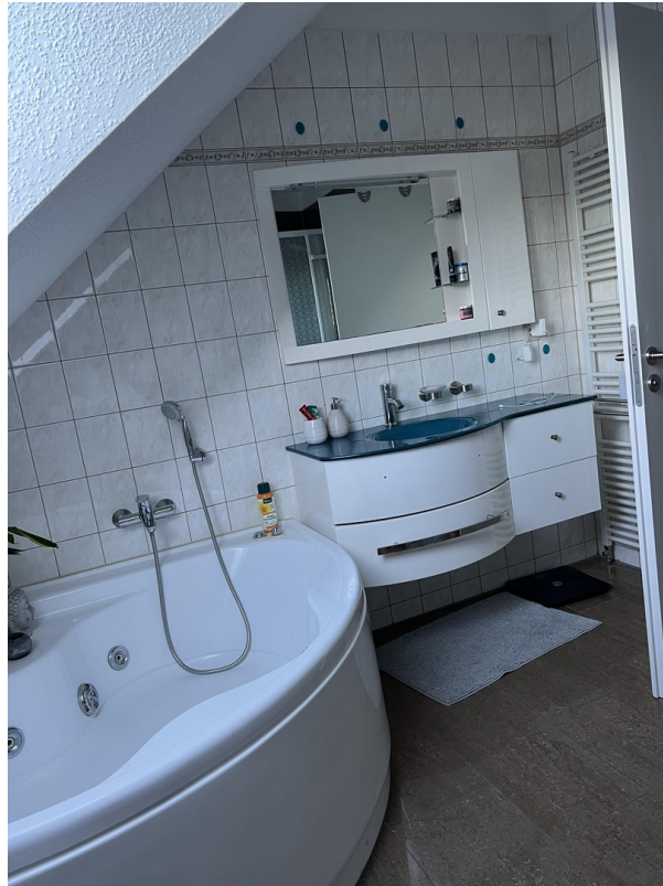
Bad - DG