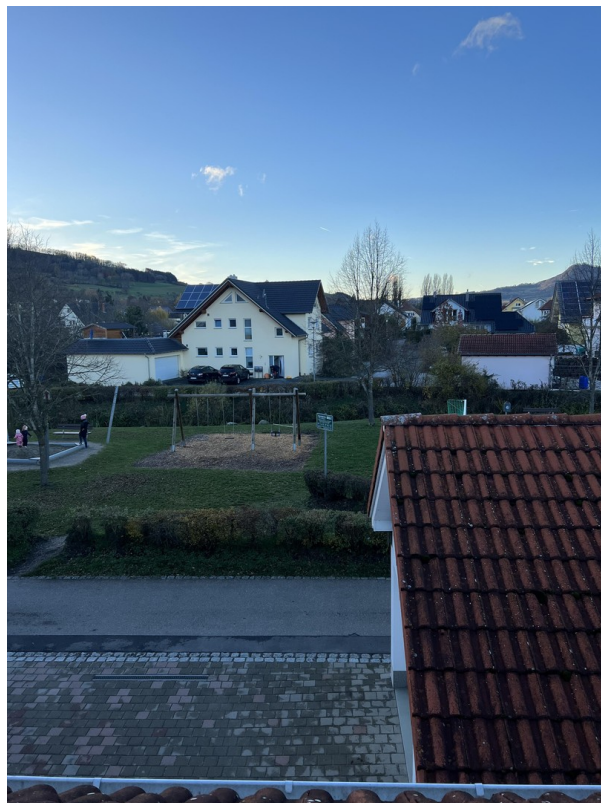
Ausblick Essbereich - DG