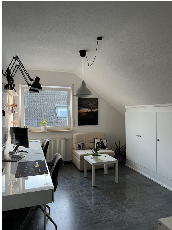
Schlafzimmer 2 - DG