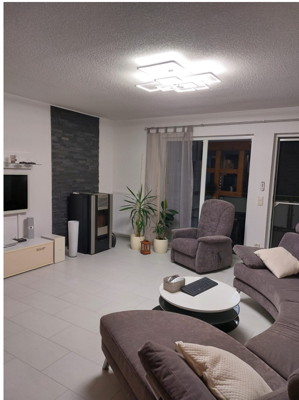
Wohnzimmer - EG