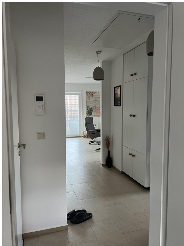
Flur - DG