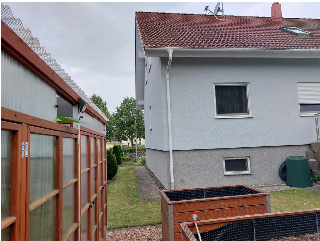
Hochbeeten mit Gewächshaus