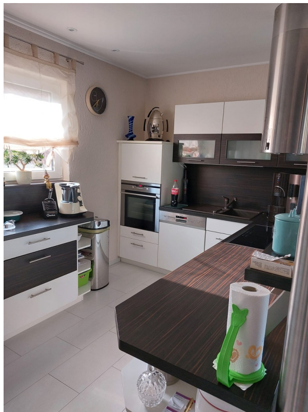
Küche - EG