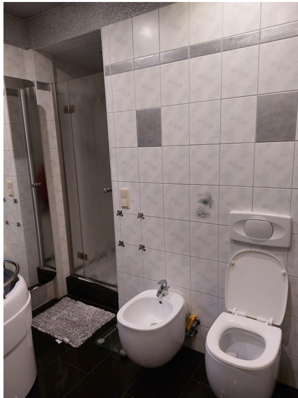
Bad - EG