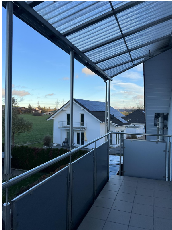
Balkon - DG