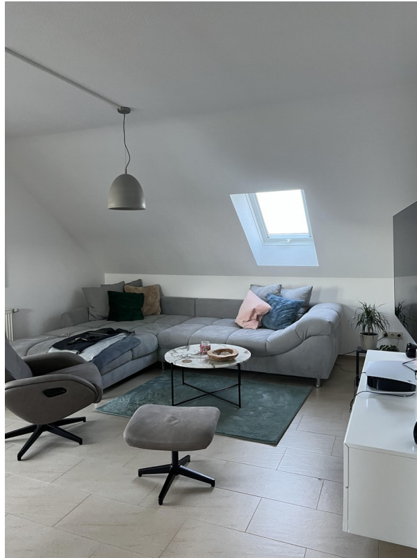
Wohnbereich - DG