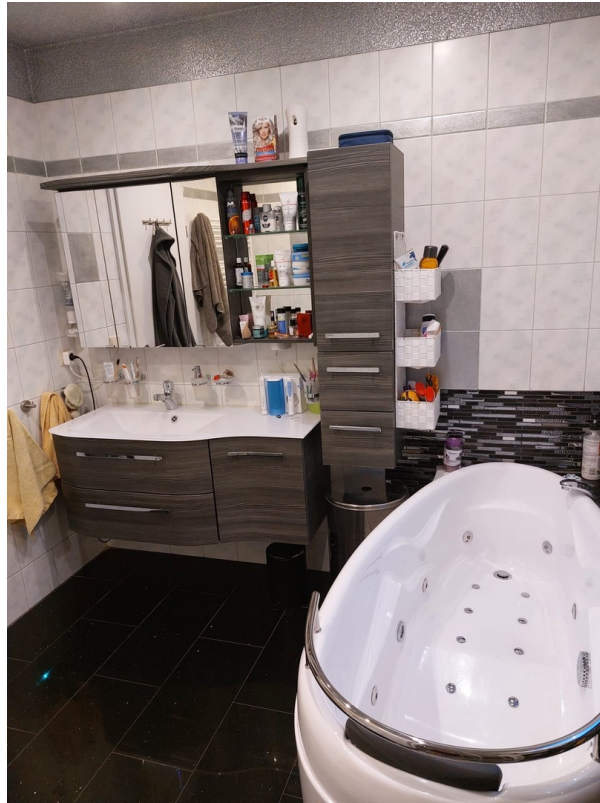
Bad - EG