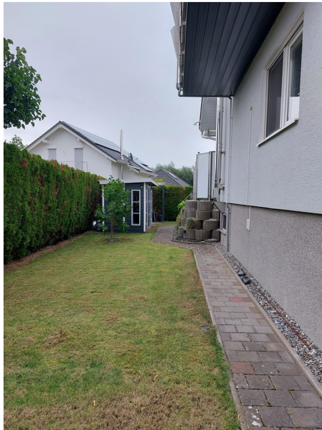
Linke Seite, Gartenhäuschen