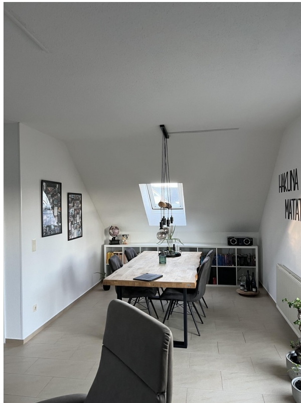
Esszimmer - DG