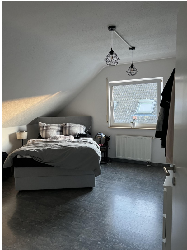
Schlafzimmer 1 - DG