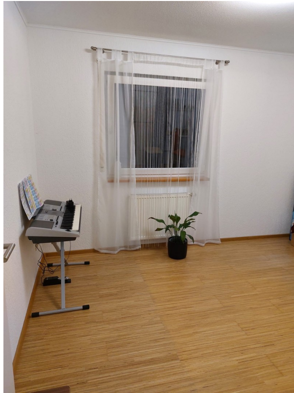
Schlafzimmer 3 - EG