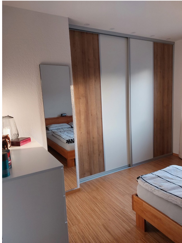
Schlafzimmer - EG