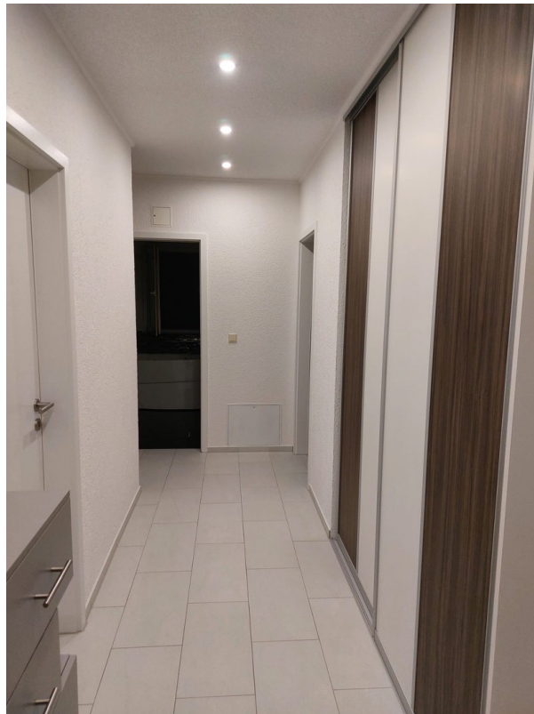
Flur - EG