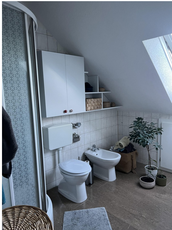
Bad - DG