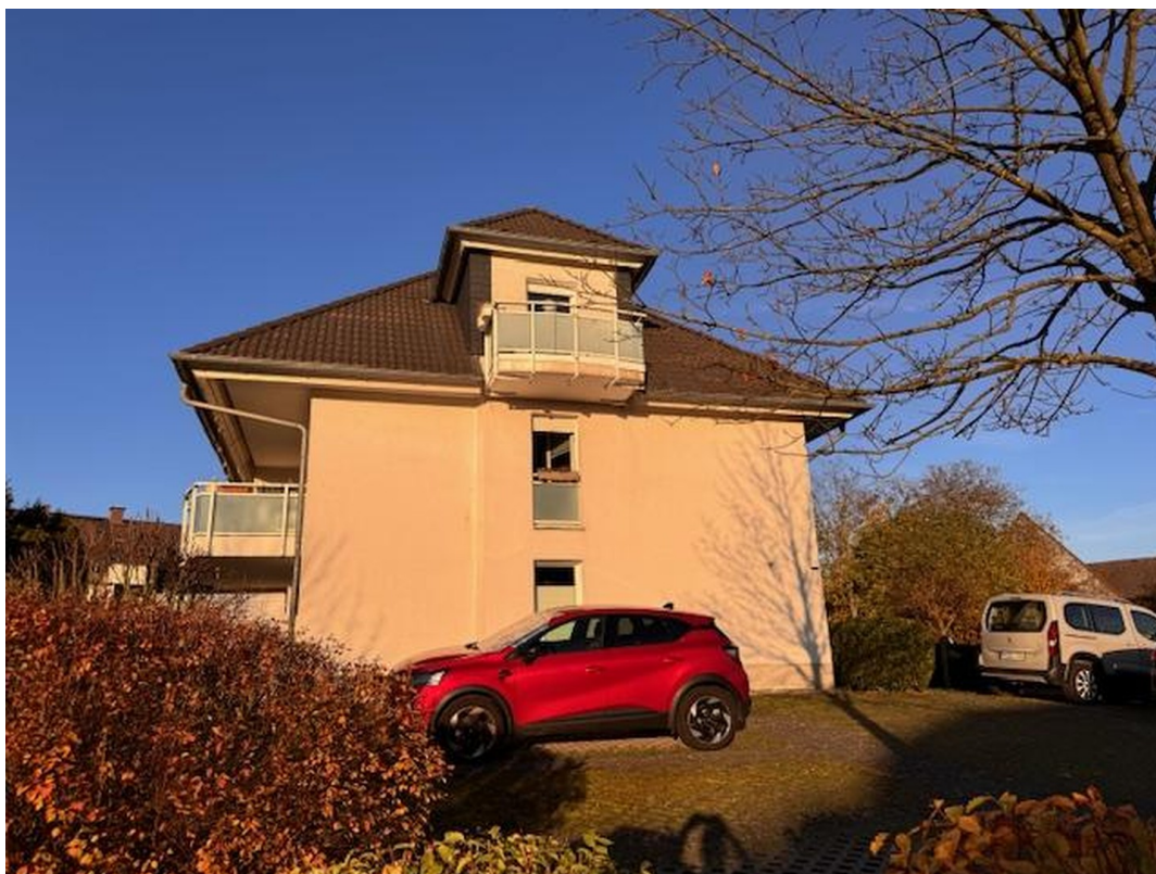
Parkplätze & Giebelseite I