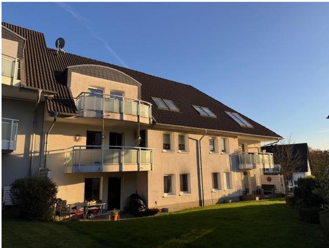
Gartenansicht mit Balkonen