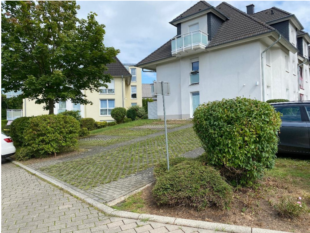
Parkplätze & Giebelseite II