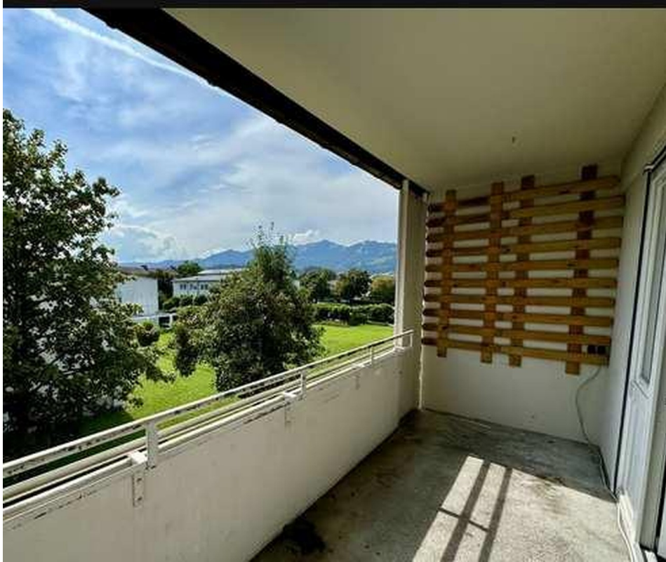
Loggia (noch ohne neuen Boden)