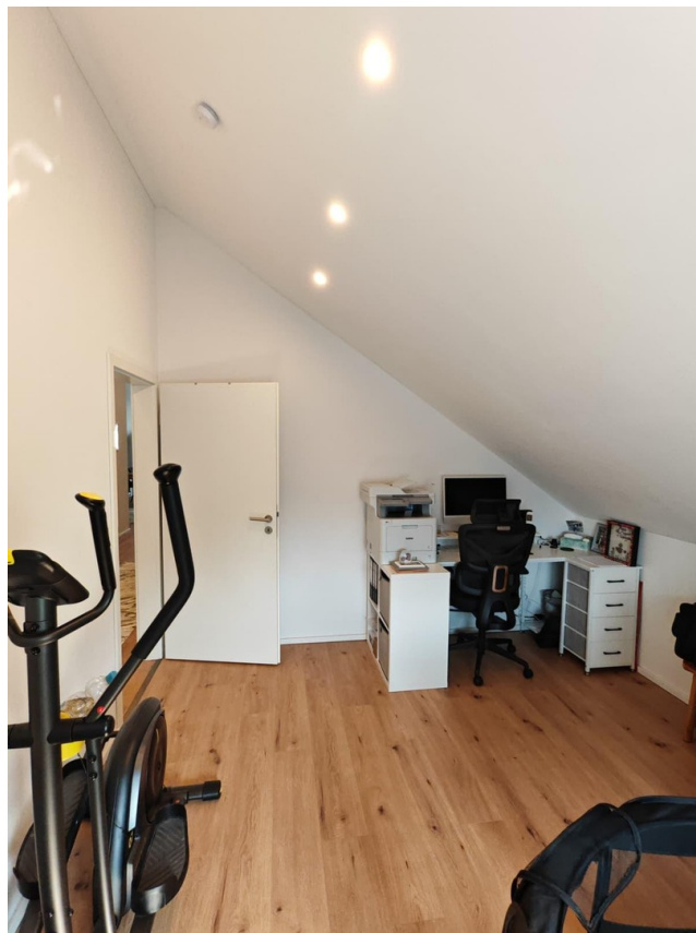
Kind / Büro